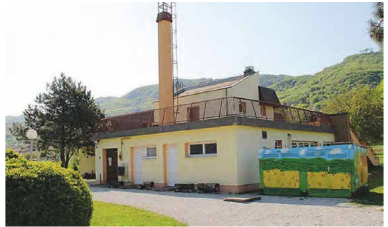
Jedan od prioritarnih projekata u 2016. je dogradnja i rekonstrukcija zgrade dječjeg vrtića