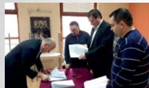
Ovogodišnji sustav financiranja udruga je bolji i pravedniji nego ranijih godina

■ Grad Lepoglava je ove godine u proračunu za potpore projektima udruga koje djeluju na području Lepoglave osigurao ukupno 350 tisuća kuna, pa je Grad Lepoglava primjer dobre prakse i u poticanju razvoja civilnog društva na svom području.