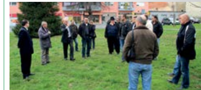
Bista bojnika Dragutina Naglaša bit će postavljena u gradskom parku

Dogovoreno je to na sastanku predstavnika koordinacije braniteljske populacije s područja Lepoglave i Grada Lepoglave s predstavnicima Udruge Crne mambe. Na sastanku su dogovoreni i detalji vezani za sam spomenik. Bit će to bista bojnika Dragutina Naglaša, koja će biti postavljena u gradski park u Lepoglavi, na Trgu prvog hrvatskog sveučilišta, a koju će dati izraditi Udruga Crne mambe. Prije postavljanja biste Grad Lepoglava će hortikulturalno urediti park te pripremiti teren za postavljanje biste jednom od jedanaestorice branitelja s područja Lepoglave poginulih u Domovinskom ratu. Osim uređenja parka i postavljanje biste u planu je da se ovaj park imenuje parkom bojnika Dragutina Naglaša. Koordinacija predstavnika braniteljske populacije s područja Lepoglave već je ranije istaknula namjeru da se u spomen na poginule branitelje s područja Lepoglave njihovim imenima nazovu javni gradski prostori, pa će imenovanje ovog parka - parkom bojnika Dragutina Naglaša, biti prvi korak u ostvarenju te namjere.