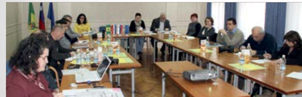
U projektu sudjeluje 9 partnera iz Hrvatske i Slovenije

■ Očuvanje i oživljavanje baštine glavni je cilj projekta "DE PARK – Baština – iz ruke u ruku do pokrajinskog parka", koji okuplja ukupno devet partnera iz Hrvatske i Slovenije.