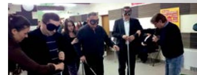
Gradskim čelnicima uvjerljivo su dočarane prepreke s kojima su svakodnevno suočene osobe s invaliditetom

Tom je prigodom posebno istaknuto kako Grad Lepoglava dobro skrbi o osobama s invaliditetom, te kako je većina objekata u gradu prilagođena osobama s posebnim potrebama.