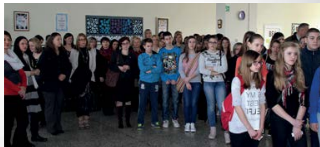
Visoki obrazovni standard škola na području Lepoglave potiče učeničku izvrsnost

Osnovna škola Ante Starčevića iz Lepoglave bila je domaćin Županijskog natjecanja iz hrvatskog jezika za učenike sedmih i osmih razreda, na kojem je sudjelovao 35 učenika sedmih i 36 učenika osmih razreda s područja Varoždinske županije.