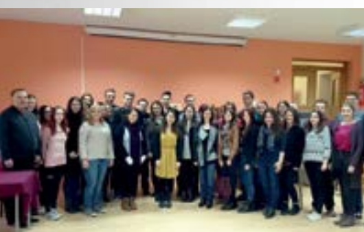
Stipendije Grada Lepoglave ove su akademske godine dodijeljene za 44 studenta i studentice s lepoglavskog područja

■ - Razvoj Lepoglave počiva na mladim i obrazovanim ljudima, jer samo temeljem znanja i kompetencija možemo u punini iskoristiti veliki potencijal koji imamo. Vjerujem u vas, u vašu inicijativu i znanje, pozivam vas da nam se priključite, kako bismo u toj sinergiji ostvarili novi razvoj, nove projekte i u konačnici nova radna mjesta – istaknuo je gradonačelnik Lepoglave Marijan Škvarić na svečanosti potpisivanja ugovora o stipendiranju, koja je održana u subotu, 14. ožujka, u lepoglavskom Turističko kulturno – informativnom centru.