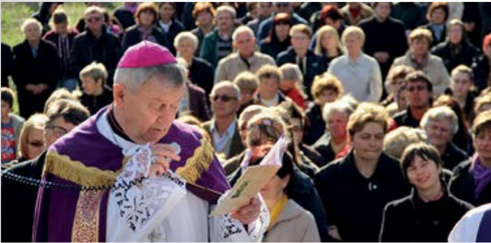
Varaždinski biskup istaknuo je duboku povezanost blaženog kardinala Stepinca s vjerničkim pukom u Lepoglavi

■ I ove je godine na blagdan Cvjetnice u Lepoglavi održan križni put koji je bio nadahnut mučeništvom blaženog Alojzija Stepinca.