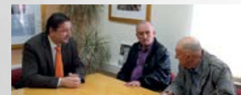
Predstavnici udruga policijskih umirovljenika na sastanku u Lepoglavi

■ Lepoglavu će 14. svibnja posjetiti članovi umirovljeničkih udruga policijskih službenika iz Varaždina i Čakovca te njihovi kolege iz mađarskih gradova Marcali i Nagykanizsa te slovenskog Maribora.