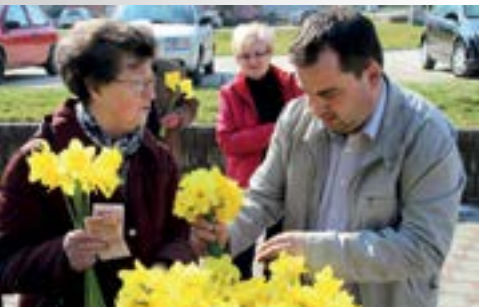
Prodajom narcisa prikupljana su sredstva za kupnju linearnog akceleratora