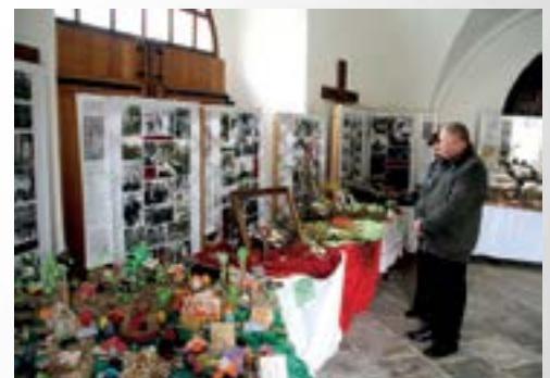
Izložba Ususret Uskrsu postavljena je u predvorju lepoglavske župne crkve

Na izložbi, postavljenoj u predvorju župne crkve Bezgrešnog začeca Blažene Djevice Marije u Lepoglavi, predstavilo se 14 izlagača. Riječ je o ustanovama, organizacijama i udrugama s područja Lepoglave čiji su izložci - pisanice i uskrsni ukrasi i ove godine pobudili veliko zanimanje svih koji su tijekom uskrsnih blagdana posjetili crkvu u Lepoglavi.