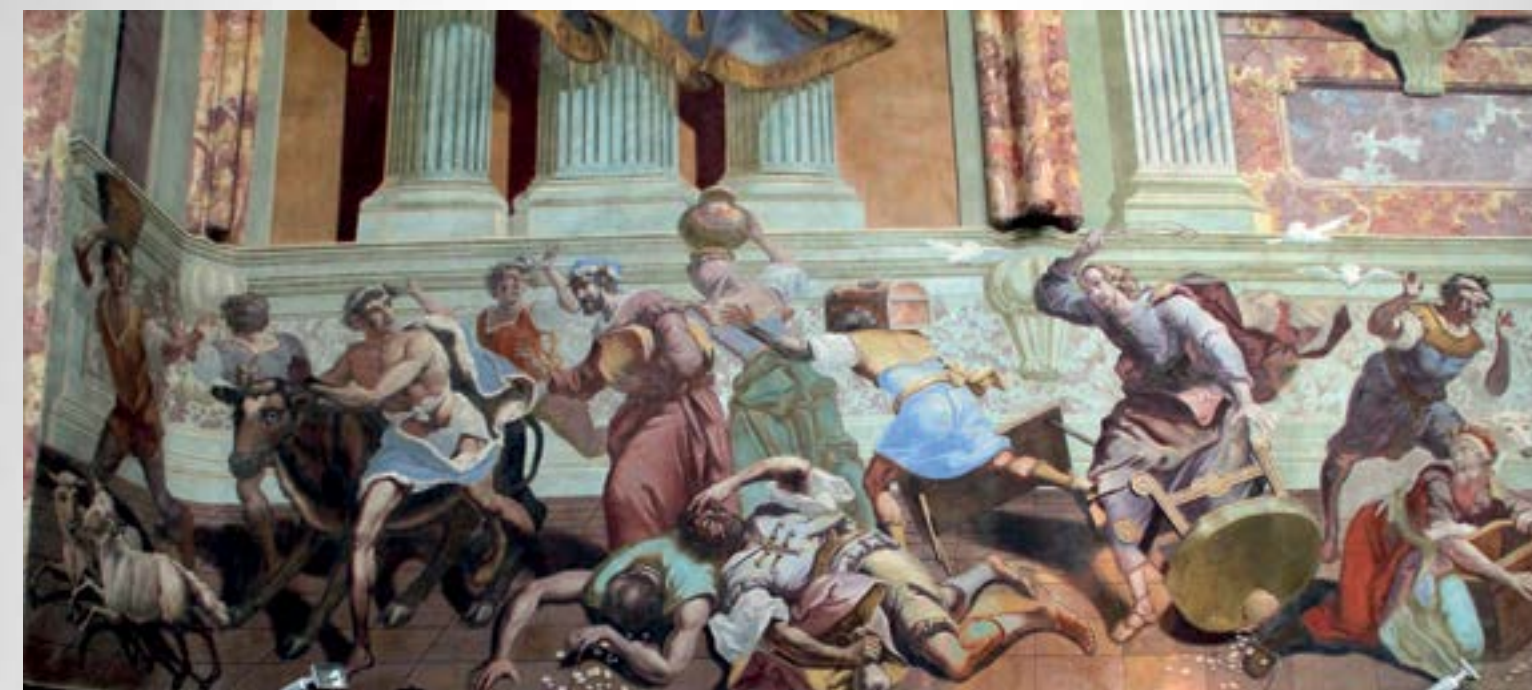
Želeći očuvati dostojanstvo i svetost hramskog prostora, Isus je jednom prilikom istjerao trgovce iz hrama, nije htio da Božju kuću pretvore u špilju razbojničku

Kuće, zgrade, ustanove i drugi objekti koje je čovjek izgradio za prikladan život imaju svoju vrijednost i značenje za pojedince i društvo u cjelini. Različite namjene i svrhe kojima služe građevine koje su izgrađene ljudskom rukom svjedoče o kreativnosti, mudrosti i uspješnosti graditelja koji su djelovali na određenom prostoru u određenom vremenu. Među svim građevinama u pojedinom mjestu, svojom se pojavom ističu crkve, religiozni prostori koji su drugačiji i različiti, po svom izgledu i po svojoj namjeni, od bilo koje druge građevine u svojem okruženju.