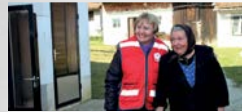
Gerontodomaćice svakodnevno brinu o nemoćnim osobama s područja Lepoglave

■ - Kvaliteta života u lokalnoj zajednici može se mjeriti onom kvalitetom koju uživa njena najranjivija osoba. Na žalost, stariji su ljudi postali najranjivija skupina i o njima vodimo posebnu skrb u okviru gerontoslužbe, na čiji smo rad ponosni – rekao je zamjenik lepoglavskog gradonačelnika Hrvoje Kovač, govoreći o jednoj od mjera socijalne politike Grada Lepoglave.