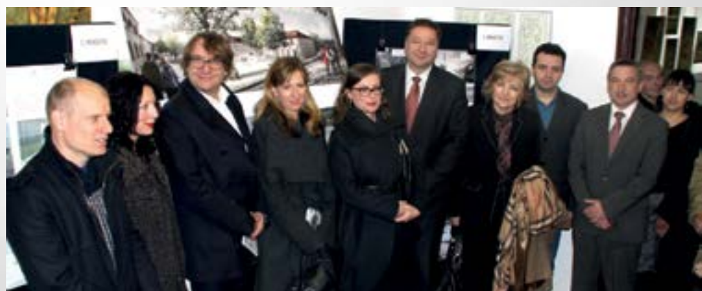
Na natječaj je ukupno prijavljeno čak 41 arhitektonsko rješenje novog centra u središtu Lepoglave

Ponosan sam da sam župan u županiji koja ima Lepoglavu. Ovaj grad nije samo primjer dobre prakse, već i podstrek drugim gradovima – rekao je župan Štromar i čestitao Lepoglavi na još jednom izuzetno vrijednom projektu, koji će biti i dio kandidature grada Varaždina i regije sjever za Europsku prijestolnicu kulture 2020. godine. Centar za posjetitelje postat će čimbenik oblikovanja vizualnog identiteta Lepoglave i katalizator razvoja grada te stvaranja novih radnih mjesta.