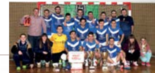
Momčad ASO Ponos iz Krapine ponovo je slavila na lepoglavskom malonogometnom turniru

Momčad ASO Ponos iz Krapine je s rezultatom 3:1 pobijedila NK Rudar iz Mihovljana u finalu 11. otvorenog zimskog turnira u malom nogometu "Karlovačko kup Lepoglava 2015. i tako po treći puta za redom osvojila lepoglavski malonogometni turnir.