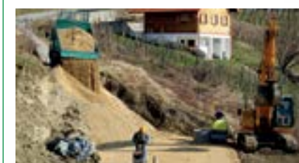
Za sanaciju klizišta Grad će zatražiti i potporu Europske unije

■ U Kameničkom Podgorju završeni su radovi vrijedni oko 700 tisuća kuna kojima Grad Lepoglava sanira klizište koje je prije tri godine prekinulo komunikaciju na lokalnoj nerazvrstanoj cesti.