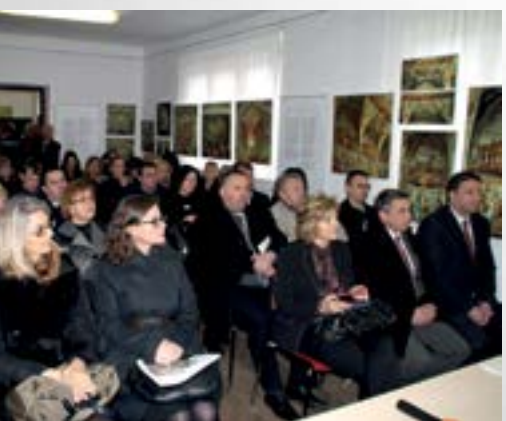
Predstavljanje natječajnih radova u dvorani Ekomuzeja u Lepoglavi pobudilo je veliko zanimanje