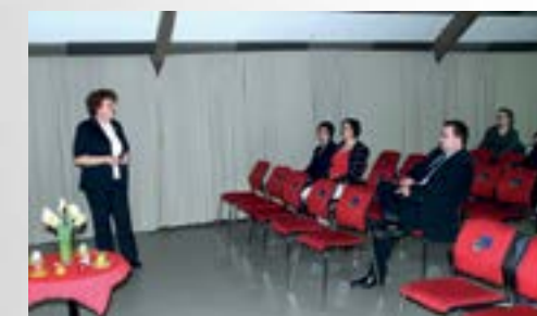
Na predavanju je istaknuta ideja da se u Lepoglavi osnuje klub žena oboljelih od karcinoma dojke

■ Pod pokroviteljstvom Grada Lepoglave u lepoglavskom Domu kulture održano je predavanje "Rak dojke – rano otkrivanje bolesti spašava živote".