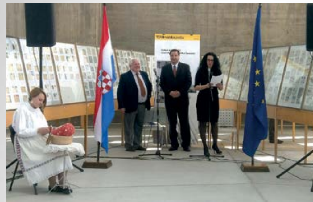
Novo izdanje poštanskih maraka s motivima lepoglavske i seviljske čipke predstavljeno je na Nacionalnoj i međunarodnoj filatelističkoj izložbi «Croatica 2015.»

Lepoglavska čipka dobila je još jedno veliko priznanje. Naime, krajem ožujka u opticaj su puštene poštanske marke «Čipka na batiće» s motivima lepoglavske i seviljske čipke.