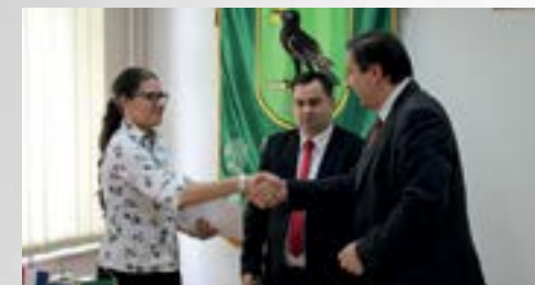
Grad Lepoglava dodijelio je bespovratne novčane pomoći za 13 obiteljskih poljoprivrednih gospodarstava

■ Temeljem provedenih natječaja za dodjelu bespovratnih sredstava pomoći u poljoprivredi te pomoći za osnaživanje organizacija za poticanje razvoja gospodarstva na području Lepoglave, Grad Lepoglava dodijelio je bespovratne novčane pomoći za 13 OPG-a te četiri organizacije, odnosno obrta.