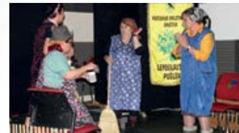
Na 5. kazališnim noćima nastupilo je devet glumačkih družina

Tijekom subotnje i nedjeljne večeri, 11. i 12. travnja, u Domu kulture u Lepoglavi publici se predstavilo devet amaterskih družina - KUD Lepoglavski pušlek, KUD Klaruš iz Maruševca, KUD Gruntovec, Udruga mladih Sve pet iz Svetog Petra Ludbreškog, Komedijaši iz Stažnjevca, KUD Cestica, Udruga žena Gornji Hrašćan, Udruga Stara brv iz Gornje Voće i KUD Josip Genc iz Bednje. Svojim su nastupima glumci amateri nasmijali i zabavili publiku koja je i ove godine u velikom broju pratila njihove nastupe.