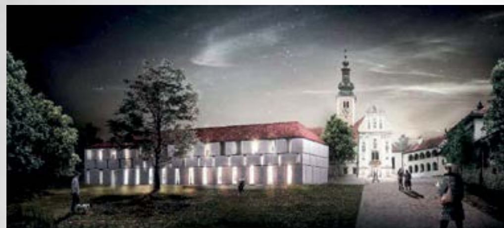
Prvonagrađeni rad na arhitektonsko – urbanističkom natječaju za Centar za posjetitelje «Centar pavlina u Lepoglavi

Radovi stigli na arhitektonsko – urbanistički natječaj koji je raspisao Grad Lepoglava za novi Centar za posjetitelje «Centar pavlina» predstavljani su u utorak, 7. travnja, na izložbi u Ekomuzeju Lepolava.