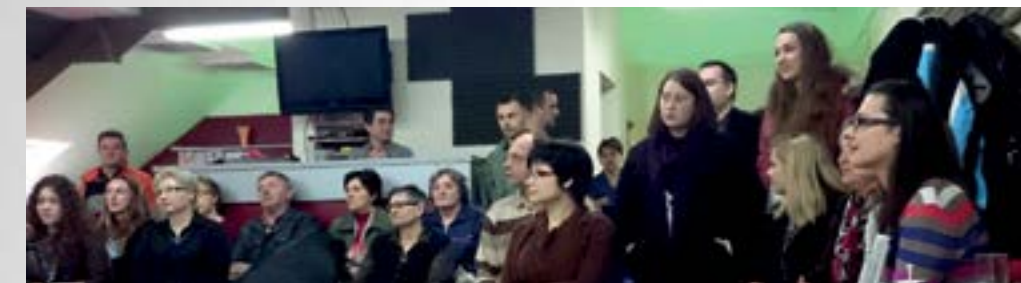
Jedan od ciljeva akcije je i bolja suradnja s jedinicama lokalne samouprave

■ U lepoglavskom Centru za kulturu u subotu, 14. ožujka, Udruga slijepih Varaždinske županije organizirala je program – Čujmo glasove različitih, koji se provodi zahvaljujući potpori iz Europskog socijalnog fonda, kako bi se šira javnost upoznala s problemima s kojima se suočavaju osobe s posebnim potrebama, ali i kako bi se poticalo ostvarivanje njihovih prava te bolja suradnja s jedinicama lokalne samouprave.