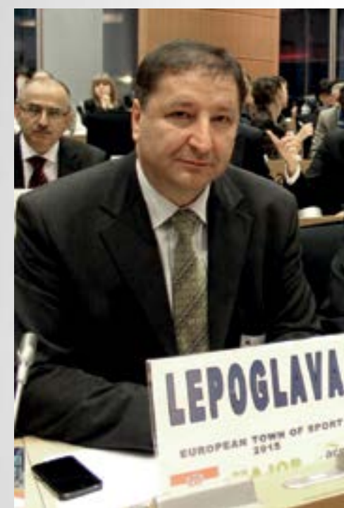
Lepoglava ove godine nosi još jednu prestižnu titulu - Europski grad sporta 2015.

- Točno, u različitim fazama realizaciju su projekti Centra za posjetitelje, Tehnološki centar drvne industrije te Centar bioraznolikosti sjeverozapadne Hrvatske. Riječ je o projektima koji imaju podršku resornih ministarstava, a koje ćemo kandidirati i za fondove Europske unije. Riječ je o strateškim razvojnim projektima koji daleko premašuju lokalne okvire, no ovom prilikom želim istaknuti i niz drugih projekata koji ponekad ostaju u njihovoj sjeni. Za mlade obitelji primjerice, gradimo POS stanove, gradimo novi vatrogasni centar, uređujemo i prenamjenjujemo derutne objekte, ulažemo u obnovljive izvore energije i u projekte energetske učinkovitosti, čime nastojimo da Lepoglava bude prepoznata i kao - zeleni grad. Stvaranjem primjerene komunalne infrastrukture nastojimo privući nove investitore, nastojimo na cijelom području Grada Lepoglave osigurati ravnomjerni razvoj i mijenjati sliku Lepoglave – poručio je lepoglavski gradonačelnik.