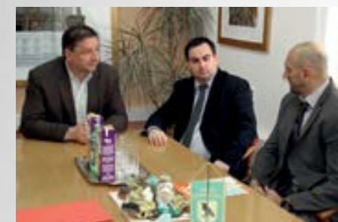
Odaberi sport – novi je projekt vezan uz sport mladih u Lepoglavi

Grad Lepoglava će podržati projekt Udruge za poticanje tjelesne aktivnosti – "Odaberi sport".