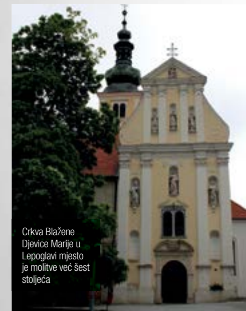
Crkva Blažene Djevice Marije u Lepoglavi mjesto je molitve već šest stoljeća

Svima nam je poznato kako crkva ima posebnu vrijednost, izaziva poštovanje, poziva na razmišljanje o Bogu, vjeri, smislu i svrsi vlastitog života. Naša je namjera da ukratko opišemo i podsjetimo u čemu se sastoji vrijednost i svetost crkvenog prostora. Iskazivanje i svjedočenje naše vjere nije isključivo vezano uz crkveni prostor, uz građevinu, živa Crkva postoji tamo gdje se okuplja zajednica koja slavi Boga. No, kao što nam je važno za sebe izgraditi što ljepši dom, školu, muzej, igralište ili stadion, jednako je važno izgraditi i njegovati prostor u kojem slavimo Boga, koji će nas podsjećati na Božju blizinu i prisutnost u našem mjestu, u našoj župi.