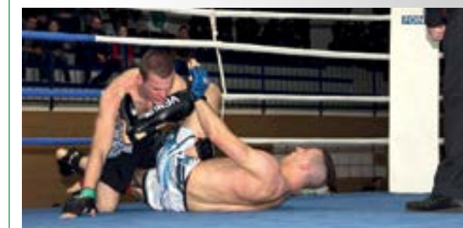
Publika je u lepoglavskoj školsko – sportskoj dvorani imala prigodu vidjeti atraktivne borbe u čak šest disciplina

Riječ je o Svjetskom kupu po verziji WKF koji je u Lepoglavi održan u organizaciji Nezavisne udruge mladih i u suradnji s Fight klubom Kovačić iz Varaždina. Sudionici natjecanja, većinom iz Poljske, Mađarske, Slovenije, Nizozemske i Hrvatske, nastupili su u šest disciplina - forms, point fighting, full contact, lowkick, K1 i thai boxing.