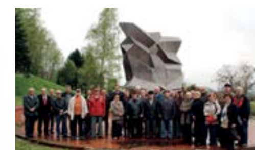
U Lepoglavi je svečano obilježeno 70 godina od oslobođenja i pobjede u 2. svjetskom ratu