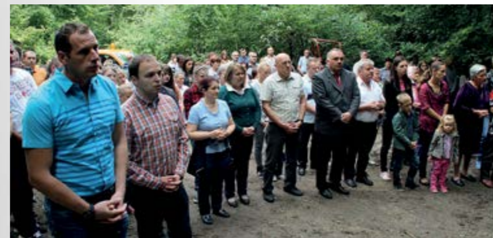
U Višnjici je obilježen Europski dan sjećanja na žrtve totalitarnih i autoritarnih režima

Europski dan sjećanja na žrtve totalitarnih i autoritarnih režima - 23. kolovoz, obilježen je u Višnjici misnim slavljem održanim kod križa podno Ravne gore, podignutog na mjestu gdje su nakon 2. svjetskog rata partizani, prema sjećanjima svjedoka, ubili oko 40 ljudi.