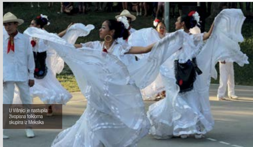
U Višnjici je nastupila živopisna folklorna skupina iz Meksika

Folklorna skupina Ballet Folklorico Santa Anita iz Meksika nastupila je u Višnjici. Na mjesnom su igralištu mladi meksički folkloristi, praćeni glazbom mariachija, oduševili okupljene gledatelje jednosatnim plesno – glazbenim programom tijekom kojeg su predstavili meksičku folkloru tradiciju.