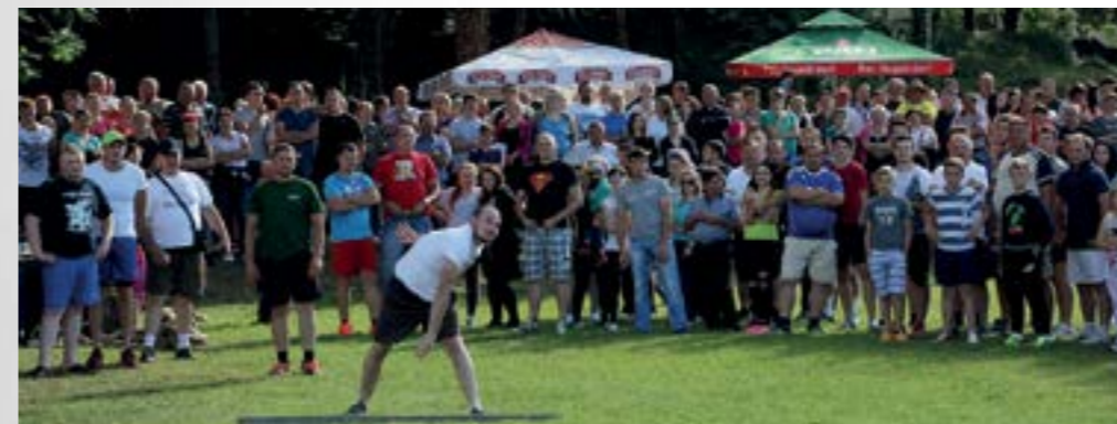
Višnjičke seoske igre već treću godinu privlače veliku pozornost publike

■ Udruga za sport i rekreaciju "Sport za sve" organizirala je u Višnjici treće Višnjičke seoske igre na kojima su nastupile ekipe iz Donje Višnjice, Gornje Višnjice, Zlogonja, Bednjice, Zalužja i Komes brijega.