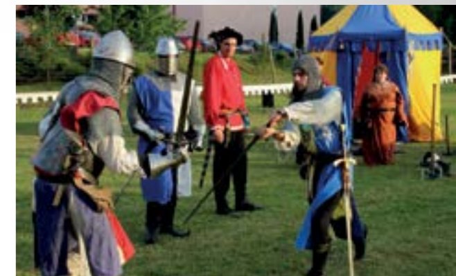
Vitezovi iz Loške doline oživjeli su priču o Martinu Krpanu

Snežnik" koju ljubitelji povijesti iz Loške doline, Općine s kojom je Grad Lepoglava potpisao povelju o bratimljenju, upriličuju tijekom srednjovjekovnog sajma koji se održava podno starog grada Snežnik u Loškoj Dolini. Ovom je prilikom, na zadovoljstvo brojnih posjetitelja manifestacije Dani sporta, zabave i kulture, izvedena i u Višnjici.