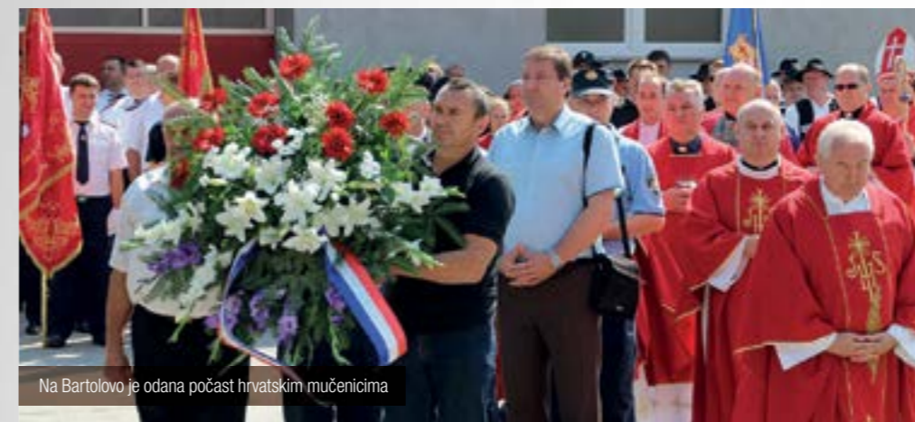
Na Bartolovo je odana počast hrvatskim mučenicima

Blagdan svetog Bartola, zaštitnika kameničke župe, obilježen je u Kamenici misnim slavljem koje je u župnoj crkvi predvodio varaždinski biskup msgr. Josip Mrzljak.