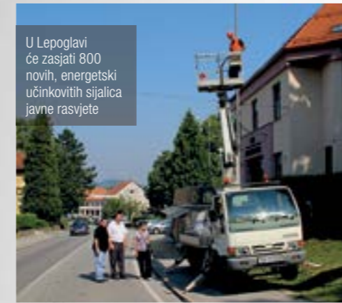
U Lepoglavi će zasjati 800 novih, energetski učinkovitih sijalica javne rasvjete

■ Stare sijalice javne rasvjete mijenjaju se novim - energetske učinkovitijima, zahvaljujući projektu - Energetske učinkovite i ekološka javna rasvjeta, za koji je Grad Lepoglava dobio potporu Fonda za zaštitu okoliša i energetske učinkovitost.