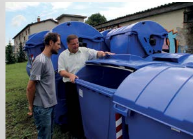
Zahvaljujući novim kontejnerima u Lepoglavi će biti moguće sortirati komunalni otpad

- Građani moraju shvatiti koliko je važno sortirati otpad. Zato ćemo ih dodatno educirati o potrebi i načinu njegova sortiranja. Želimo ih potaknuti da sortiraju otpad i odlažu ga u za to predviđene kontejnere - poručio je gradonačelnik Škvarić.