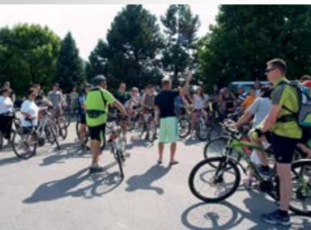
Udruga za sportsku rekreaciju «Sport za sve» i ove je godine organizirala biciklijadu - Svi na bic, do zdravlja mic po mic

Na biciklističku rutu dugu 33 kilometara 4. je srpnja, iz Lepoglave krenulo osamdesetak sudionika tradicionalne biciklijade - Svi na bic, do zdravlja mic po mic, koju je organizirala Udruga za sportsku rekreaciju "Sport za sve".