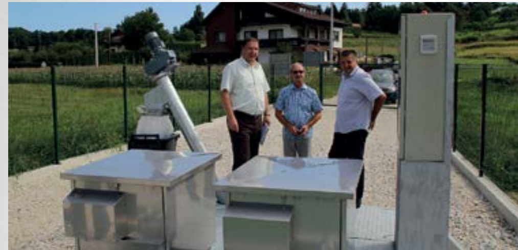
Završena je izgradnja kanalizacijskog sustava s pročistačem u Kamenici

■ Neugodni mirisi koji su se zbog otpadnih i fekalnih voda širili u djelu naselja Kamenica postali su prošlost - završena je izgradnja kanalizacijskog sustava s pročistačem za naselje Kamenica.