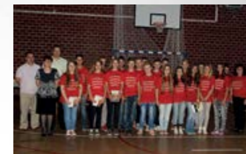
Učenici koji su sudjelovali na županijskim i državnim natjecanjima nagrađeni su knjigama

Iza vas cijelo vrijeme stoje i podupiru vas vaši roditelji i učitelji, ali i Grad Lepoglava, koji se brine da školski standard na gradskom području bude na najvišoj razini. Budite ponosni na svoju školu i prekrasnu Višnjicu – istaknuo je gradonačelnik Marijan Škvarić predajući učenicima gradske nagrade.