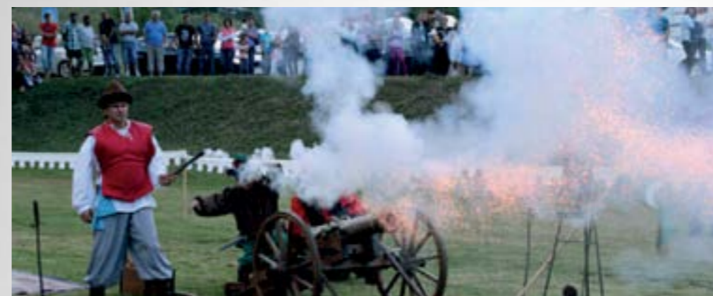
U Višnjici je upriličena prava srednjovjekovna bitka

■ Tijekom manifestacije - Dani sporta, zabave i kulture, u Višnjici je upriličena srednjovjekovna bitka.