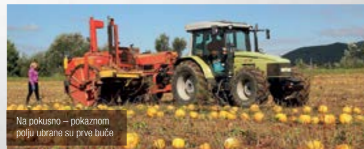
Na pokusno – pokaznom polju ubrane su prve buče

Prvu promociju proizvoda dobivenih uzgojem buča na pokusno – pokaznom polju u Lepoglavi, ATK Lepoglava imat će na Sajmu tradicijskog rukotvorstva i starih zanata koji će se održati u okviru 19. međunarodnog festivala čipke u Lepoglavi.