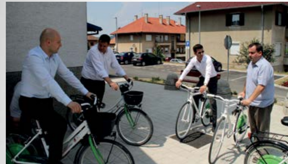
Ministar Zmajlović u obilazak Lepoglave krenuo je na električnom biciklu