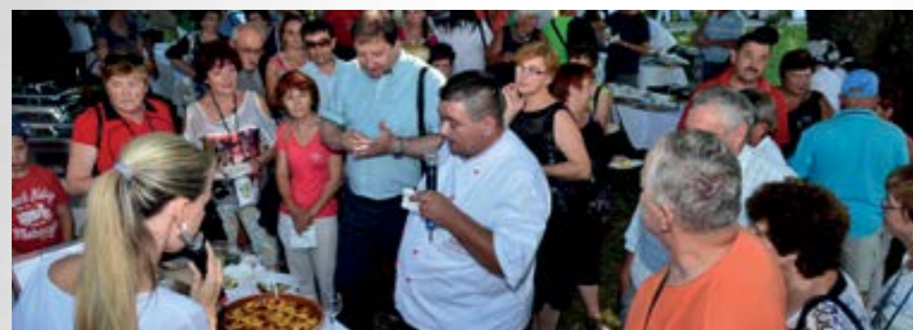
Zagorska jela je na duhovit i zabavan način predstavio popularni kuhar Tomislav Špiček

■ Lepoglavski dani ove su se godine profilirali kao jedno od središnjih mjesta promocije naše tradicijske kulture i baštine, koja je zahvaljujući raznovrsnim i atraktivnim sadržajima u Lepoglavu privukla mnoštvo posjetitelja.