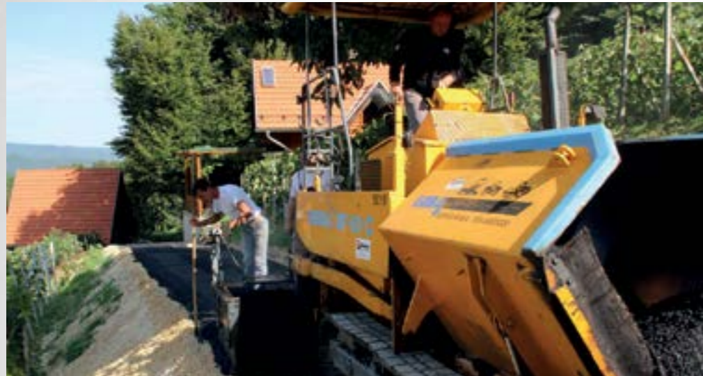
Novcem iz gradskog proračuna uređuju se novi kilometri lokalnih prometnica

■ Na području Grada Lepoglave, polaganjem asfaltnog tepiha, kraju je privedeno uređenje gotovo kilometar nerazvrstanih i lokalnih cesta. Riječ je o tri dionice koje su ušle u ovogodišnji gradski program uređenja nerazvrstanih i lokalnih cesta i to u naseljima Sestranec, Borje i Čret.