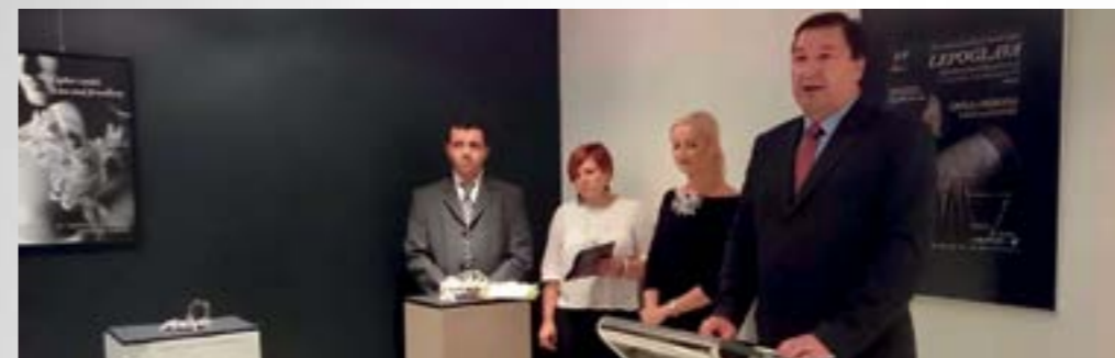
Program ovogodišnjeg festivala predstavljen je u Galerijском centru Varaždin

■ Posjetitelji će i na 19. međunarodnom festivalu čipke, koji će od 17. do 20. rujna biti održan u Lepoglavi pod visokim pokroviteljstvom predsjednice Republike Kolinde Grabar Kitarović, imati prigodu vidjeti neke od najljepših primjeraka čipke iz Hrvatske, Belgije, Poljske, Mađarske, Bosne i Hercegovine, Slovenije, Crne Gore i Njemačke. Tema ovogodišnjeg festivala je – Čipka i priroda, pa će i većinu izložaka na festivalu krasiti upravo motivi iz biljnog i životinjskog svijeta.