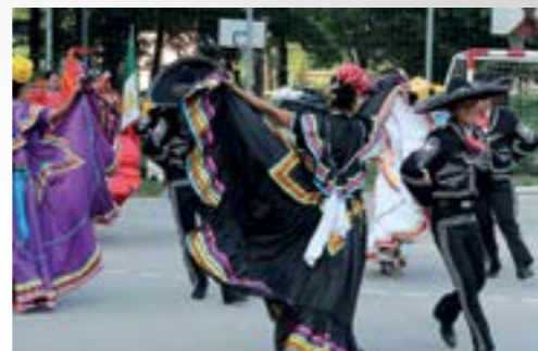
Višnjička publika imala je prigodu vidjeti dio bogate folklorne tradicije Meksika

ljudi na koje smo naišli. Od srca vam hvala – zahvali su domaćinima simpatični Meksikanci, čije je gostovanje u Višnjici organizirao Međunarodni klub prijatelja, uz potporu višnjičkih udruga. Nakon Višnjice, gosti iz Meksika posjetili su i Lepoglavu, gdje su razgledali njene znamenitosti.