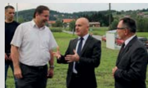
Memorijalni turnir otvorio je ministar branitelja Predrag Matić