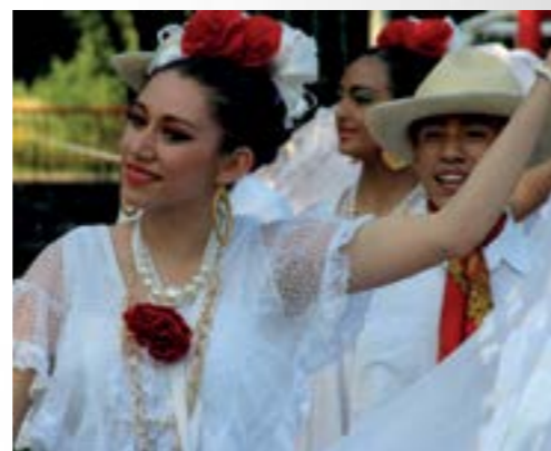
Gosti iz Meksika priredili su atraktivnu plesnu i glazbenu priredbu

Nastup ispunjen živopisnim bojama meksičkih narodnih nošnji i zvicima meksičke tradicionalne glazbe gledatelji su nagrađivali glasnim pljeskom,