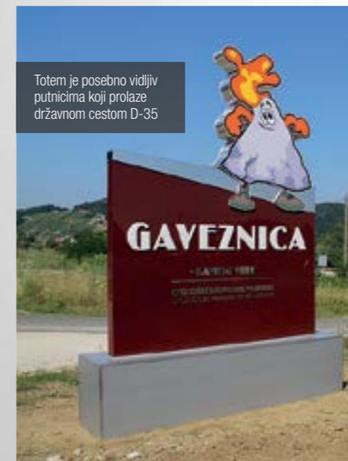
Totem je posebno vidljiv putnicima koji prolaze državnom cestom D-35

Ove je godine Gaveznicu – Kameni vrh već posjetilo gotovo dvije tisuće posjetitelja - ističu u Turističko kulturno – informativnom centru, nositelju koncesijskog odobrenja. Većinom su to bile organizirane učeničke grupe koje na Gaveznicu imaju prigodu upoznati geološko bogatstvo Hrvatske, zahvaljujući zbirci stijena, koja je ove godine upotpunjena primjercima mramora, granita, bazalta te kalcitnom ružom.