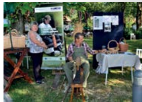
Proizvodi tradicijske baštine plijenili su pozornost posjetitelja u lepoglavskom Gradskom parku

Ovogodišnje Lepoglavske dane organizirao je lepoglavski TKIC, uz suorganizaciju Turističke zajednice grada Lepoglave i Agroturističkog klastera, a pod pokroviteljstvom Grada Lepoglave.