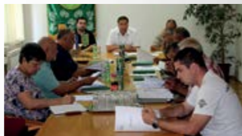
Novoizabrani predsjednici mjesnih odbora na sastanku u Gradu

Predsjednici mjesnih odbora tom su prigodom upoznati s obavezama te pozvani na suradnju s gradskim tijelima. Istaknuta je njihova značajna uloga, pa time i odgovornost koju odbori i njihovi članovi imaju prema građanima i Gradu, čiju sponu predstavljaju. - Na vama leži velika odgovornost, budući da ste poveznica između građana i Grada. Od vas se očekuje da zahtjeve građana kanalizirate prema Gradu, poštujući postojeće procedure. Također, očekuje se i da informirate građane o gradskim aktivnostima i provedbi gradskih programa – rekao je tom prigodom gradonačelnik Marijan Škvarić.