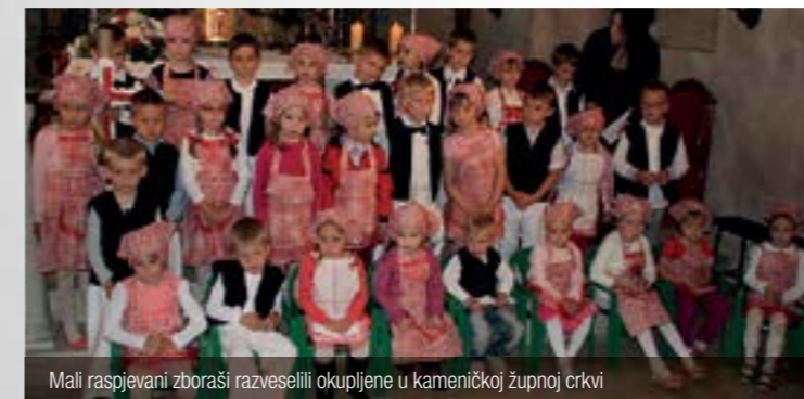
Mali raspjevani zborasi razveselili okupljene u kameničkoj župnoj crkvi

Dječji vrtić "Runolist" iz Žarovnice organizirao je u kameničkoj župnoj crkvi koncert na kojem su se javnosti predstavili vrtički mališani okupljeni u vrtičkom zboru Runolistići.