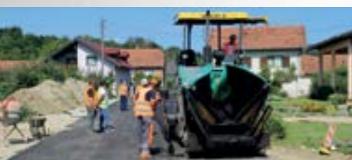
U naselju Vulišinec uređuje se cesta, cestovna odvodnja, kanalizacija i nogostup

■ Još jedna velika kapitalna investicija Grada Lepoglave, vrijedna milijun i 100 tisuća kuna, privodi se kraju.