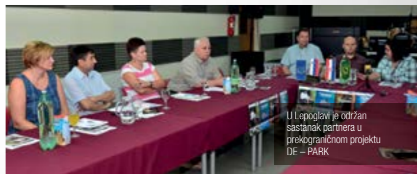
U Lepoglavi je održan sastanak partnera u prekograničnom projektu DE – PARK

■ U Lepoglavi je 11. srpnja održan sastanak partnera u prekograničnom projektu DE – PARK – Baština – Iz ruke u ruku do pokrajinskog parka, na kojem su predstavljene aktivnosti vezane uz očuvanje tradicijske baštine pograničnog područja Republike Hrvatske i Slovenije.