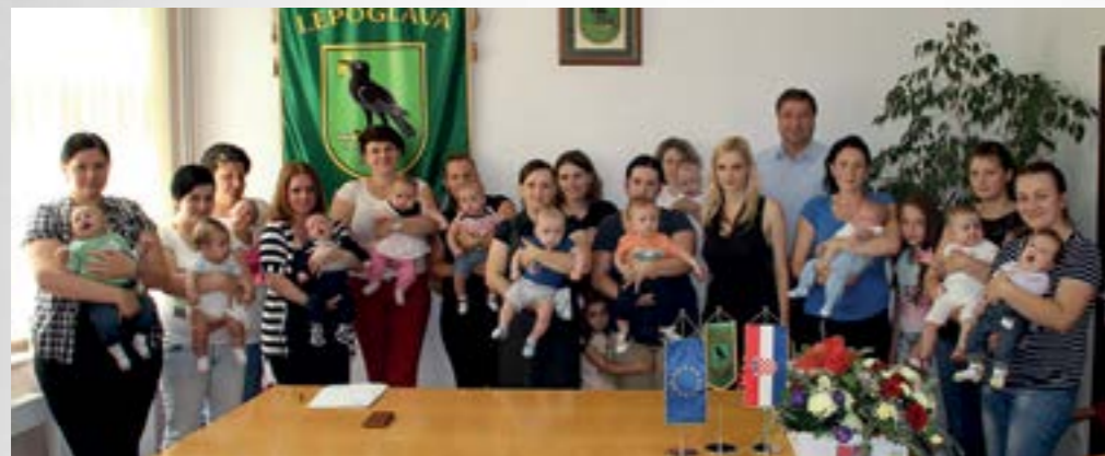
Obitelji s novorođenom djecom primile su novčane potpore Grada

■ Već po drugi puta u ovoj godini u Lepoglavskoj gradskoj vijećnici je organiziran prijem za obitelji s novorođenom djecom kojima su dodijeljene jednokratne gradske novčane potpore.