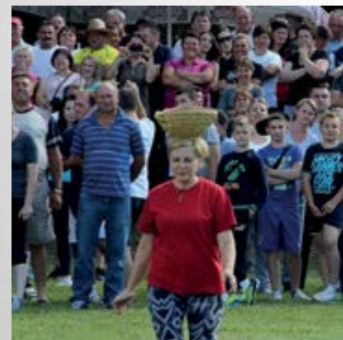
Nošenje košare na glavi bila je tek jedna od atraktivnih disciplina seoskih igara u Višnjici

Ekipe, sastavljene isključivo od Višnjičaraca, odnosno onih koji su na neki način vezani uz Višnjicu, natjecale su se u skoku u dalj s mjesta, nošenju jajeta u žlici, skakanju u vreći, hodanju na štulama, nošenju košare na glavi, potezanju štapa, bacanju potkove uz štap, bacanju kamena s ramena, potezanju užeta, ispijanju piva i kuhanju kotlovine.