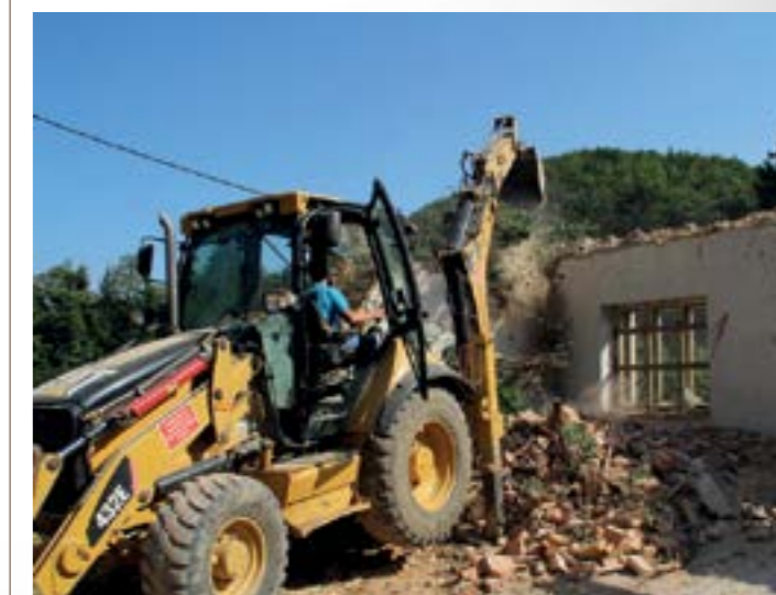
U Kamenici je konačno srušena zgrada zbog koje je bila zatvorena cesta prema Kameničkom Podgorju

■ Stara derutna zgrada u Kamenici, koja je zbog dotrajalosti i urušavanja predstavljala opasnost za sigurnost građana, zbog čega je bila zatvorena županijska cesta na relaciji Kamenica – Kameničko Podgorje, napokon je uklonjena.