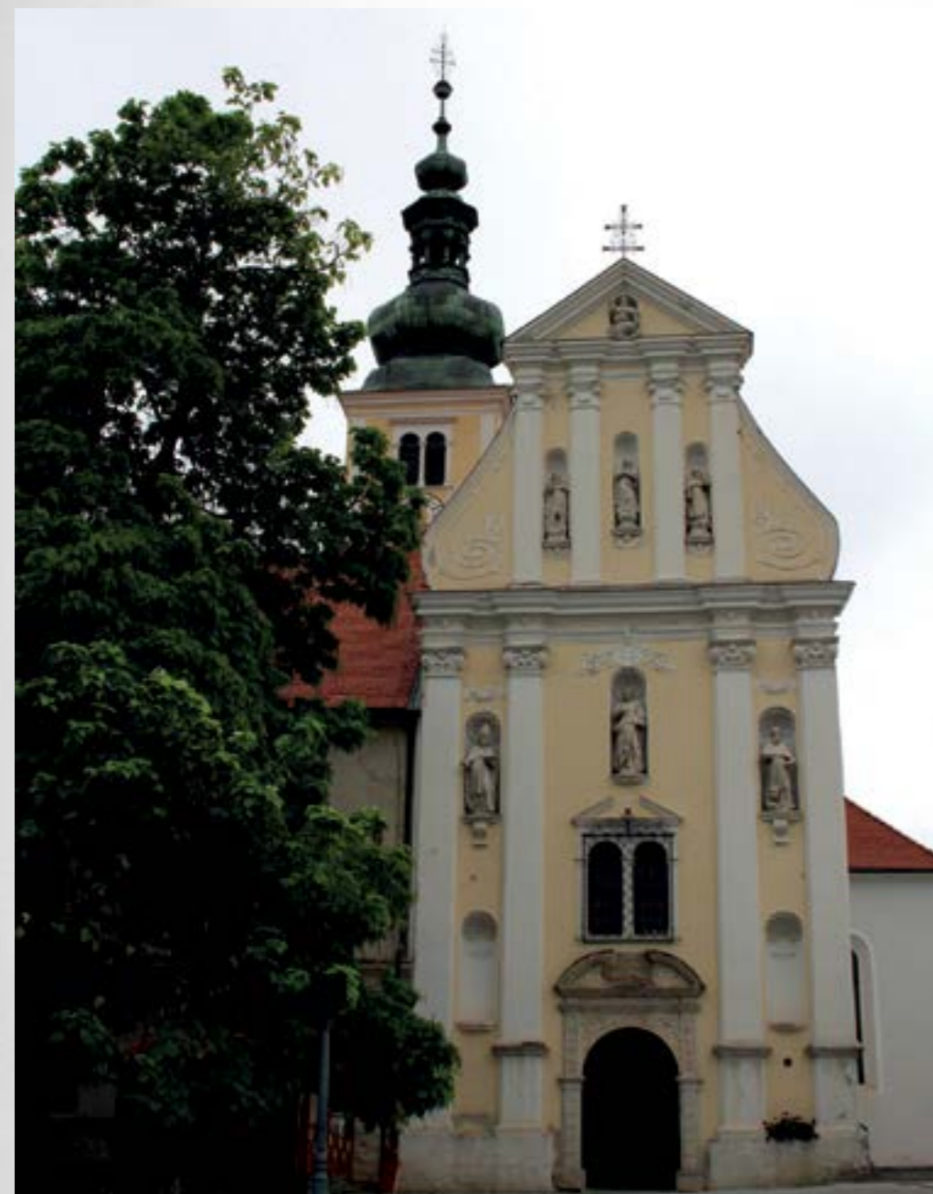
Lepoglava će obilježiti 600 godina od posvećenja crkve Blažene Djevice Marije

Veliki jubilej – 600. godišnjica župne crkve u Lepoglavi, bit će proslavljen u nedjelju, 11. listopada, kada će svetu misu u lepoglavskoj crkvi Blažene Djevice Marije predvoditi varaždinski biskup msgr. Josip Mrzljak.