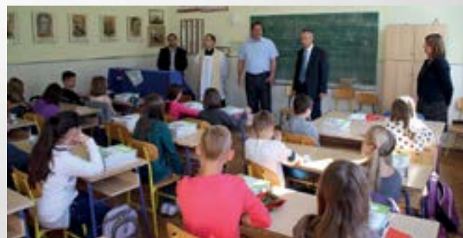
Dobre želje učenicima u novoj školskoj godini

Prvog dana školske godine svakog su učenika dočekali udžbenici koji su im osigurani zahvaljujući jedinstvenom modelu koji je osmislila Varaždinska županija.