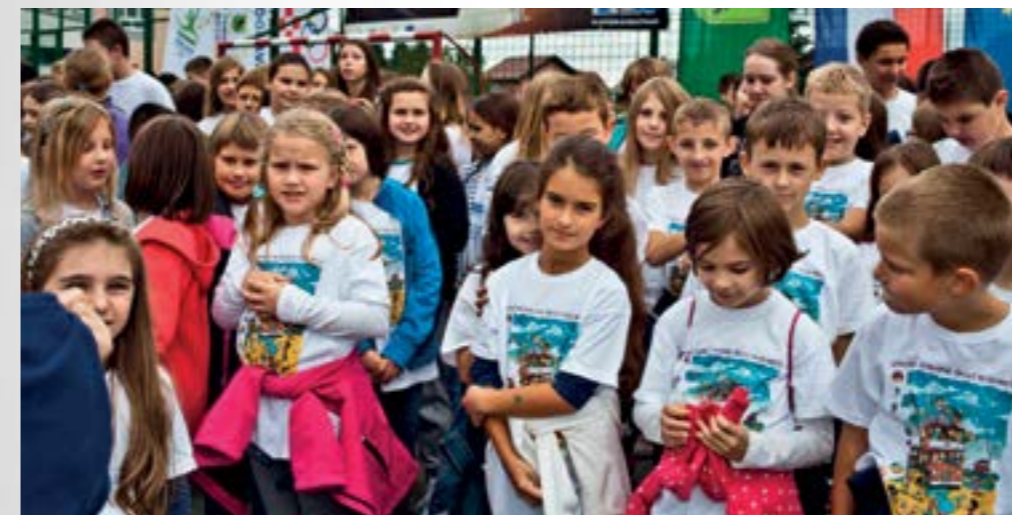
Lepoglava je ponovo dokazala da je – grad sporta

- Europska komisija ove je godine pokrenula inicijativu Europski grad sporta kako bi potaknula tjelesnu aktivnost građana te svijest o zdravom načinu života. Lepoglava, kao Europski grad sporta 2015., prihvatila je ovaj izazov i u Europskom tjednu sporta organizirala niz sportskih i rekreacijskih priredbi u kojima je sudjelovalo gotovo 20 posto svih žitelja Grada Lepoglave, od djece vrtičkog uzrasta do umirovljenika – istaknuo je Damir Kužir, tajnik Zajednice sportskih udruga grada Lepoglave.