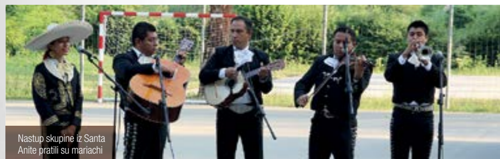
Nastup skupine iz Santa Anite pratili su mariachi

ljudi na koje smo naišli. Od srca vam hvala – zahvali su domaćinima simpatični Meksikanci, čije je gostovanje u Višnjici organizirao Međunarodni klub prijatelja, uz potporu višnjičkih udruga. Nakon Višnjice, gosti iz Meksika posjetili su i Lepoglavu, gdje su razgledali njene znamenitosti.