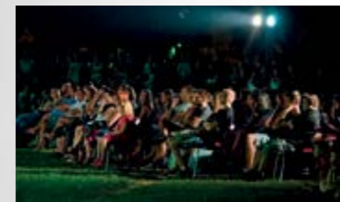
U atraktivnim sadržajima uživalo je ove godine više tisuća posjetitelja

Ovogodišnji festival privukao je pozornost više tisuća posjetitelja, koji su imali prigodu uživati u raznovrsnim sadržajima ponuđenih tijekom deset festivalskih dana u kolovozu.