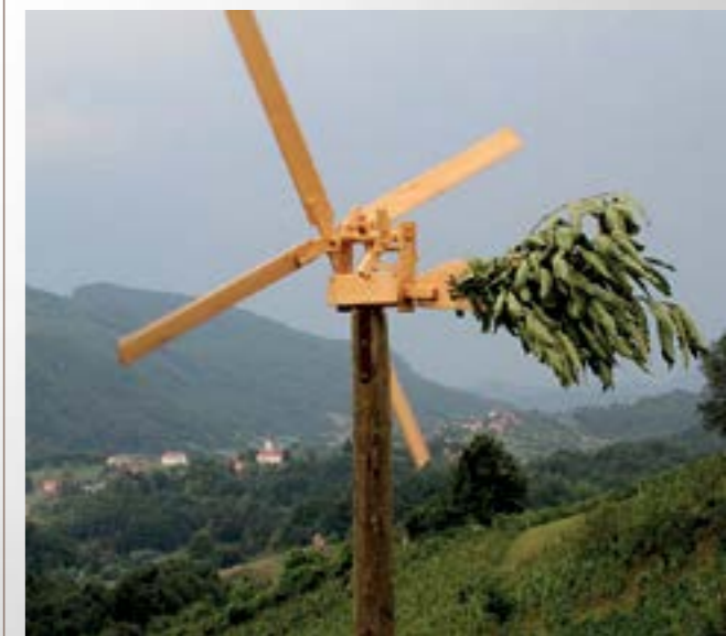
Višnjičke vinograde će do berbe čuvati klopoci

Njegovo su postavljanje višnjički kuburaši, kojima se pridružio i predsjednik Gradskog vijeća Robert Maček te brojni Višnjičarci, popratili gromoglasnim pucnjem koje je odzvanjalo višnjičkim bregima i goricama. Nakon bučnih kubura, vinograde će do berbe čuvati klopoci koji su u Višnjici ovih dana postavljeni i u drugim vinogradima.