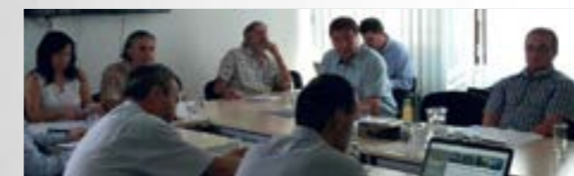
U Ministarstvu poljoprivrede predstavljen je Tehnološki centar drvne industrije

■ Ministarstvo poljoprivrede i Uprava šumarstva, lovstva i drvne industrije organizirali su sastanak na kojem su predstavljene centri kompetencija u području drvopreradaivačkog sektora Hrvatske.