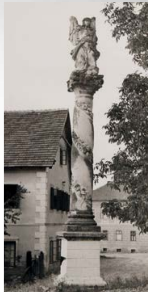
Pil arkandela Gabrijela bio je djelo nepoznatog majstora iz 18. stoljeća