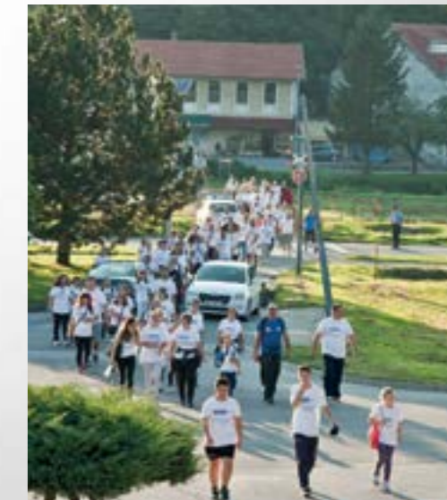
Više stotina rekreativaca pješačilo je ulicama Lepoglave

Partneri priredbe kojom je u Europskom gradu sporta obilježen Europski tjedan sporta bili su - Grad Lepoglava, Hrvatski olimpijski odbor, Zajednica športskih udruga grada Lepoglave, koja okuplja 19 sportskih udruga, asocijacije TAFISA i ACES Europe, lepoglavski TKIC, Ministarstvo unutarnjih poslova, Nezavisna udruga mladih, Udruga umirovljenika Lepoglava, lepoglavski dječji vrtići te osnovne škole iz Lepoglave, Kamenice i Višnjice, a program je podržan iz europskog programa Erasmus +.