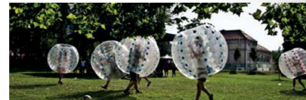
Adrenalinski bubble nogomet bio je jedna od atrakcija festivala