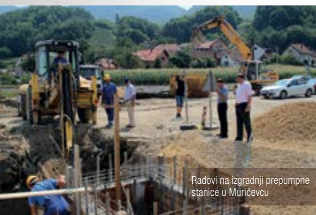
Radovi na izgradnji prepumpne stanice u Muričevcu

■ Projekt izgradnje sustava za odvodnju i pročišćavanje otpadnih voda grada Lepoglave započeo je protekle godine realizacijom faze koja obuhvaća izgradnju kanalizacijskog sustava za dio centra Lepoglave te naselja Očuru, Muričevac i Šumec. Godinu dana kasnije ta je faza pred samim završetkom.