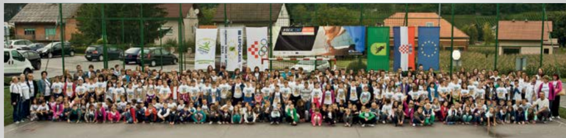
U programu #BeActive Kids Challenge aktivno je sudjelovalo više od tisuću osnovnoškolaca i djece predškolskog uzrasta

U Lepoglavi – Europskom gradu sporta, s velikim je uspjehom od 9. do 12. rujna, organizirana četverodnevna priredba kojom je obilježen Europski dan sporta i Hrvatski olimpijski dan. U brojnim sportskim i rekreativnim programima sudjelovalo je gotovo dvije tisuće djece, rekreativaca i sportaša koji su i ovom prigodom potvrdili kako je Lepoglava – sportski grad.