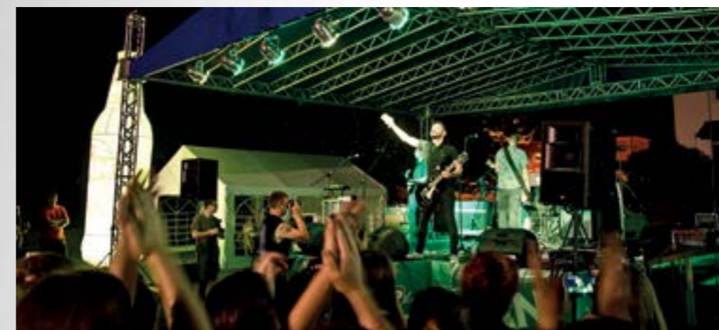
Koncert grupe Vatra bio je tek dio bogate koncertne ponude ovogodišnjeg Jailhouse festivala