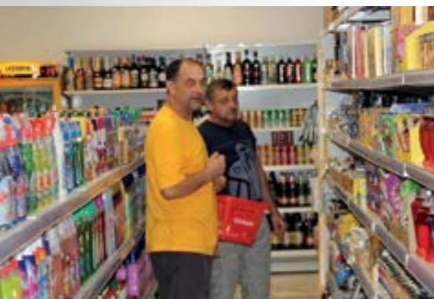
U bivšem poslovnom prostoru IGM-a otvorena je nova trgovina mješovite robe

■ U nekadašnjem poslovnom prostoru tvrtke IGM u ulici Hrvatskih pavlina, koji je godinama zjapio prazan, krajem srpnja je otvorena trgovina mješovite robe.