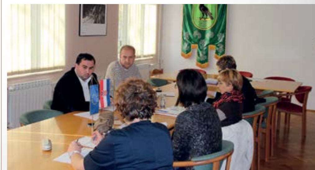
Na sastanku Savjeta za socijalnu politiku raspravljano je o novom sustavu socijalne skrbi u Lepoglavi

■ Grad Lepoglava iduće godine uvodi novi sustav socijalne skrbi o kojem je raspravljao Savjet za socijalnu politiku grada Lepoglave, čiji su se članovi složili da će novi sustav prema korisnicima biti stroži, ali i pravedniji.