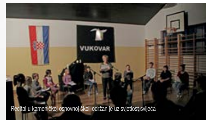
Recital u kameničkoj osnovnoj školi održan je uz svjetlost svijeća

Recital nosi ime i čuva uspomenu na jednog od vukovarskih branitelja, pripadnika 204. vukovarske brigade, koji je ubijen na Ovčari. Uz svjetlost upaljenih svijeća i s puno pije-teta, učenici i učitelji kameničke škole recitacijama, pjesmom i glazbom odali su počast Gradu heroju, civilnim žrtvama i hrabrim vukovarskim braniteljima. Recital Vinko Andrijić svake će se godine održavati u drugoj školi na području Grada Lepoglave.