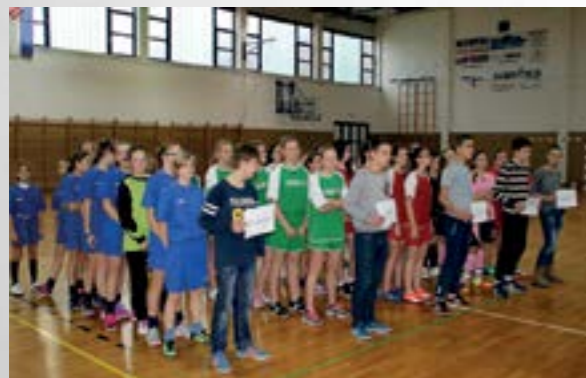
Na nogometnom turniru nastupilo je pet ženskih ekipa, među kojima je bila i ona iz slovenskih Cirkulana