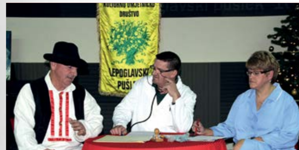
Lepoglavski pušlek svečano je obilježio deset godina uspješnog rada

Višesatnim slavljeničkim programom u ispunjenom tavanu Doma kulture u Lepoglavi, Kulturno umjetničko društvo Lepoglavski pušlek obilježilo je prvo desetljeće uspješnog rada.