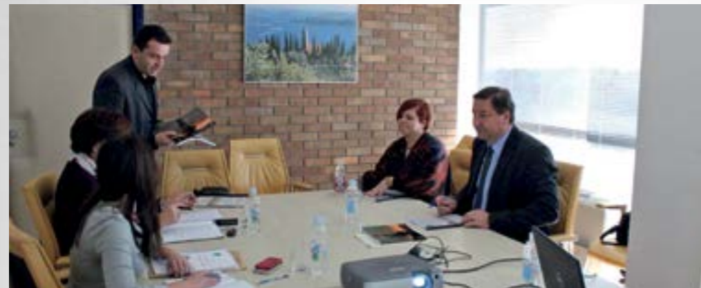
U Ministarstvu turizma predstavljen je projekt - Centar za posjetitelje "Centar pavlina"

■ Na poziv Ministarstva turizma, Grad Lepoglava je predstavio projekt - Centar za posjetitelje "Centar pavlina", koji je prijavljen na natječaj Ministarstva - Fond za razvoj turizma "Program razvoja javne turističke infrastrukture u 2015"