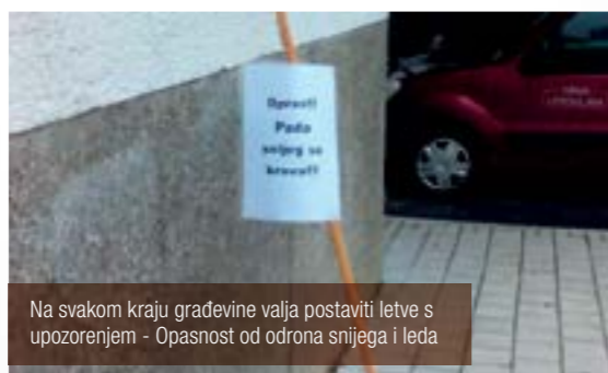
Na svakom kraju građevine valja postaviti letve s upozorenjem - Opasnost od odrona snijega i leda

■ Odlukom o komunalnom redu Grada Lepoglave (Službeni vjesnik Varaždinske županije broj 26/08) propisano je da su pravne i fizičke osobe, vlasnici ili korisnici stambenih, poslovnih prostora ili objekata, te građevinskog zemljišta uz javne prometne površine, dužni obavljati uklanjanje snijega i leda s nogostupa razvrstanih i nerazvrstanih cesta.