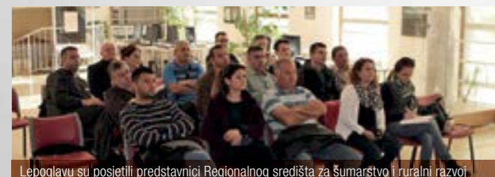
Lepoglavi su posjetili predstavnici Regionalnog središta za šumarstvo i ruralni razvoj

Predstavnici REFORD-a razgledali su i područje koje svojim aktivnostima pokriva udruga "Kesten" te šumsku mehanizaciju kojom se koriste njeni članovi.