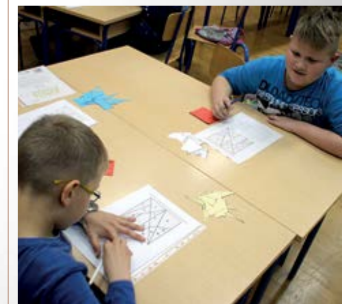
U Višnjici djeca otkrivaju zabavnu stranu matematike

Matematika može biti zabavna - rekli su učenici višnjičke osnovne škole