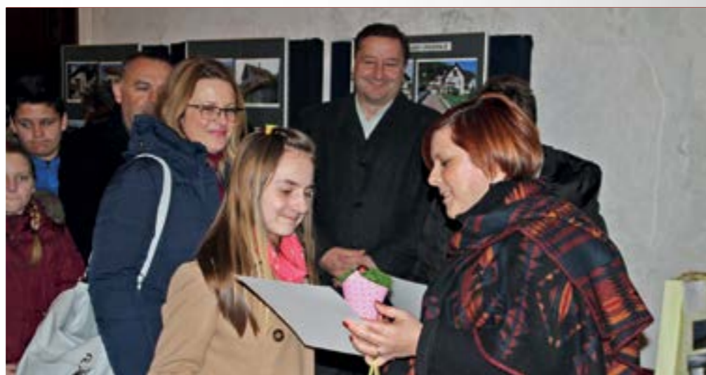
Dodjelom priznanja završila je akcija – Cvijet za ljepši grad

U jedinstvenom ambijentu pavlinskog samostana u Lepoglavi, održana je završna priredba akcije Turističke zajednice grada Lepoglave – Cvijet za ljepši grad.