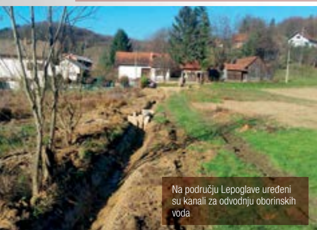
Na području Lepoglave uređeni su kanali za odvodnju oborinskih voda

■ U okviru gradskog programa održavanja komunalne infrastrukture, na područjima gdje su oborinske vode prijetile izlivanjem, uređeni su kanali za njihovu odvodnju.