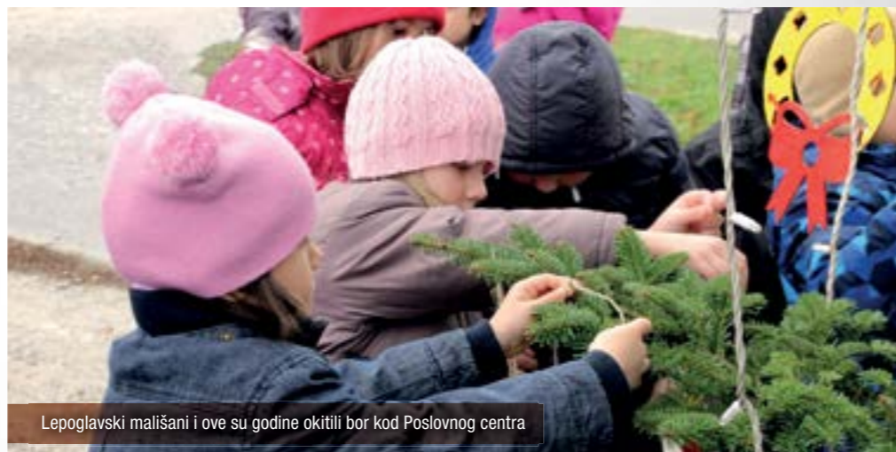
Lepoglavski mališani i ove su godine okitili bor kod Poslovnog centra