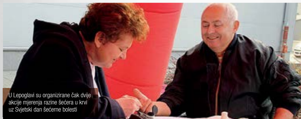
U Lepoglavi su organizirane čak dvije akcije mjerenja razine šećera u krvi uz Svjetski dan šećerne bolesti

- Zdravlje je na prvom mjestu, a za uspješno liječenje bolest je potrebno otkriti na vrijeme - naglašeno je tijekom akcija u Lepoglavi.