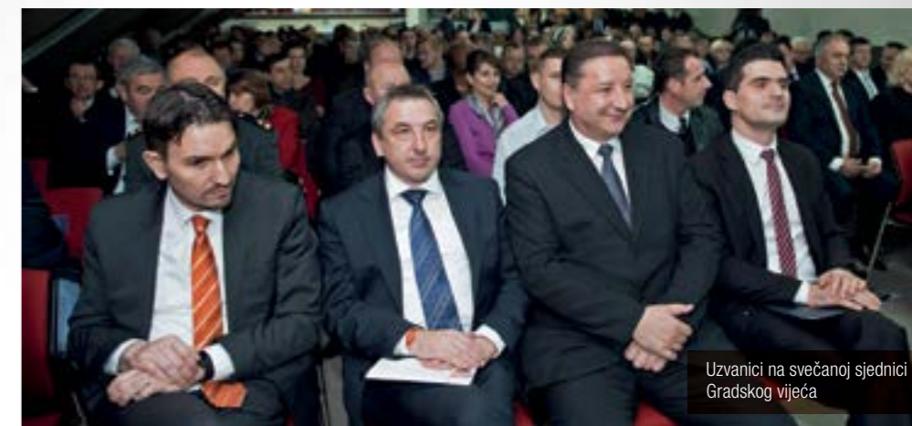
Uzvanici na svečanoj sjednici Gradskog vijeća

Radili smo na tekućem održavanju komunalne infrastrukture, brinuli smo o gospodarstvu, a prije svega vodili smo brigu – o našim građanima.