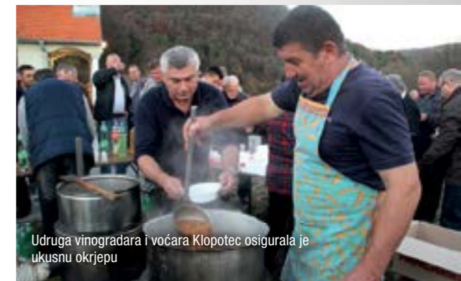
Udruge vinogradara i voćara Klopotec osigurala je ukusnu okrjepu

Nakon mise članovi Udruge vinogradara i voćara Klopotec počastili su okupljene kuhanim grahamom i vinom, a u čast svetom Martinu zapucali su i kuburaši iz kuburaške udruge Glasna kubura.