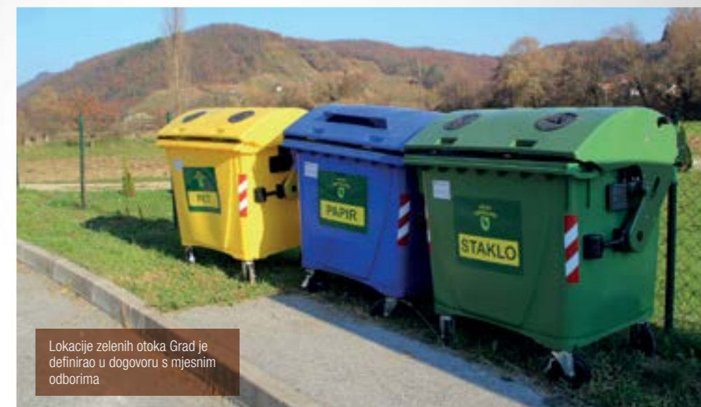
Lokacije zelenih otoka Grad je definirao u dogovoru s mjesnim odborima

Na svakom od 25 zelenih otoka nalaze se po tri kontejnera – jedan za odlaganje papira, jedan za staklo te jedan kontejner za odlaganje pet ambalaže. Odvoz otpada skupljenog u kontejnerima na zelenim otocima dogovoren je s IVKOM-om, u čijem se krugu nalazi i reciklažno dvorište na koje će građani s područja Grada Lepoglave moći sami dovesti veći komunalni otpad ili u dogovoru s IVKOM-om organizirati njegov odvoz. - Rješavamo i problem građevinskog otpada, tako da smo skupljanje otpada podigli na višu razinu.