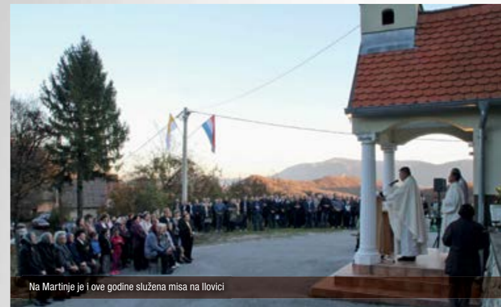
Na Martinje je i ove godine služena misa na Ilovici

■ Blagdan svetog Martina tradicionalno se u vinorodnom području Kameničkog Podgorja – Ilovici, obilježava misnim slavljem.