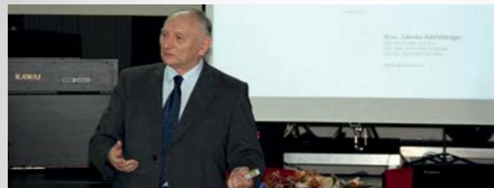
Lepoglava je ponovo bila domaćin radionice koju je organizirala Platforma hrvatskih županija i gradova za smanjenje rizika od katastrofa

■ Procjena rizika - metodologija za izradu procjene rizika, utjecaj procjene rizika na prevenciju i prostorno planiranje, naziv je dvodnevne radionice koju je u Lepoglavi organizirala Platforma hrvatskih županija i gradova za smanjenje rizika od katastrofa.