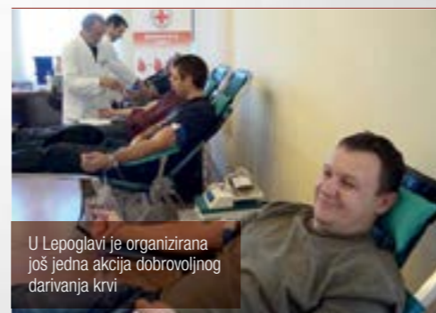
U Lepoglavi je organizirana još jedna akcija dobrovoljnog darivanja krvi

■ Gradsko društvo Crvenog križa Ivanec, u suradnji s aktivom dobrovoljnih darivatelja krvi iz Lepoglave, organiziralo je akciju dobrovoljnog darivanja krvi za građane sa šireg lepoglavskog područja.