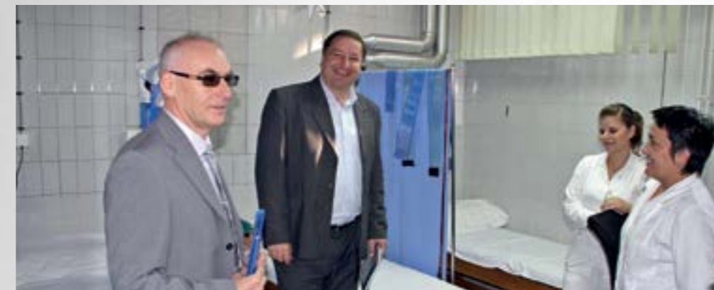
Ugradnja invalidske platforme prioritet je županijskog Doma zdravlja

■ Dom zdravlja Varaždinske županije i Grad Lepoglava intenzivirali su aktivnosti vezane uz ugradnju podizne platforme u objekt Doma zdravlja u Lepoglavi.