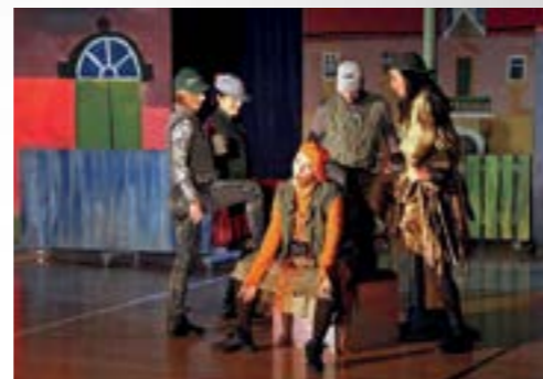
Lepoglavski mališani uživali su u predstavi Miševi i mačke naglavačke, varaždinskog kazališta

Glumci Hrvatskog narodnog kazališta iz Varaždina najmlađe žitelje Lepoglave razveselili su predstavom - Miševi i mačke naglavačke, nastaloj prema zbirci pjesama Luke Paljetka.