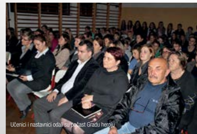
Učenici i nastavnici odali su počast Gradu heroju

Višnjički učenici matematiku uče i na zabavan način