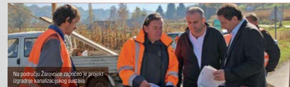
Na području Žarovnice započeo je projekt izgradnje kanalizacijskog sustava

■ Gotovo dva milijuna kuna vrijedan projekt izgradnje 800 metara nogostupa te oborinske i cestovne odvodnje u naselju Žarovnica, na potezu od naselja Mački do ulaza u Sutinsku, započeo je gradnjom dvaju odvojaka za odvodnju oborinskih voda prema potoku Žarovnica.