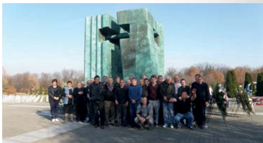
Lepoglavski branitelji i ove su godine posjetili Vukovar i odali počast vukovarskim braniteljima

U Lepoglavi organizirano mjerenje šećera u krvi