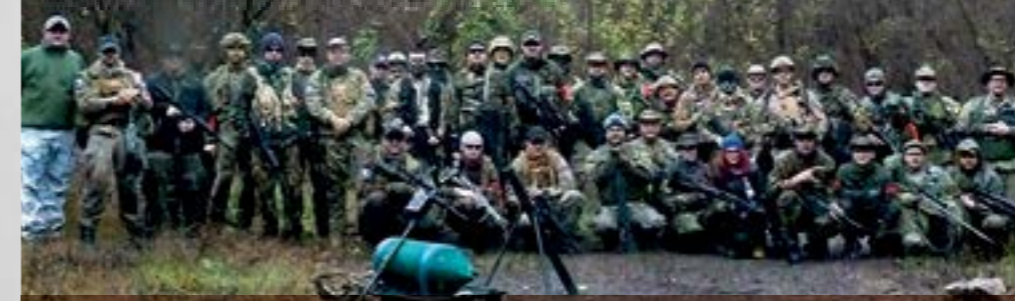
U operaciji Mountain storm nastupilo je četrdesetak sudionika

- Već drugu godinu organiziramo ovakav susret za koji želimo da postane tradicionalan, budući da je i ove godine zadovoljio sve organizacijske i sigurnosne aspekte – poručili su članovi P.A.S. Kluba Lepoglava i dodali kako na ovaj način žele predstaviti potencijal Lepoglave u ponudi turističko – adrenalinskih