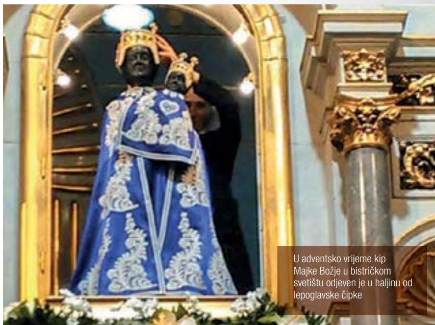
U adventsko vrijeme kip Majke Božje u bistričkom svetištu odjeven je u haljinu od lepoglavske čipke