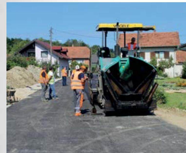
Završni radovi na uređenju prometnice u Vulišincu

- Ispred Grada Lepoglave zahvaljujem Ministarstvu regionalnog razvoja i fondova Europske unije koje je prepoznalo potrebu ulaganja u komunalnu infrastrukturu lokalne zajednice. Ulaganje u ovaj projekt vezan uz jedan gradski mjesni odbor, ustvari je dio velikog razvojnog projekta Grada kojem je cilj izgradnja moderne i učinkovite infrastrukture, kao preduvjeta daljnjeg gradskog razvoja i napretka – istaknuo je gradonačelnik grada Lepoglave Marijan Škvarić.