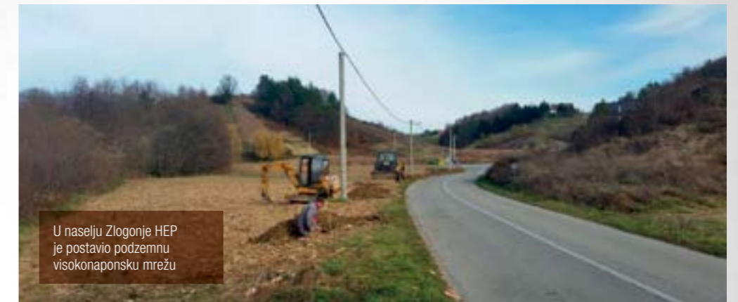
U naselju Zlogonje HEP je postavio podzemnu visokonaponsku mrežu

Na taj je način stvorila preduvjete za nastavak vlastitog ulaganja na području Mjesnog odbora Zlogonje, odnosno izgradnju tri trafostanice, čija je izgradnja planirana za iduću godinu. Ukupna vrijednost ovih investicija, kojima će biti riješen problem slabog napona na tom području, veća je od milijun i 700 tisuća kuna. Uz već odrađene investicije u 2015. godini i planirane investicije za 2016. godinu - u ulici Ves, ulici Sestranc i naseljima Crkovec i Zlogonje, Hrvatska elektroprivreda će tijekom ove i iduće godine na području Grada Lepoglave odraditi investicije ukupne vrijednosti 2 milijuna i 700 tisuća kuna.