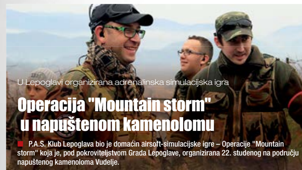
U Lepoglavi organizirana adrenalinska simulacijska igra