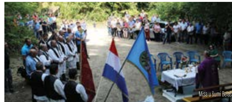
Misa u šumi Belaš

U šumi Belaš u Višnjici služena je misa za ubijene na tom mjestu, za sve ubijene u 2. svjetskom ratu i u vremenu nakon njegova završetka te za sve stradale od totalitarnih režima i poginule u Domovinskom ratu.