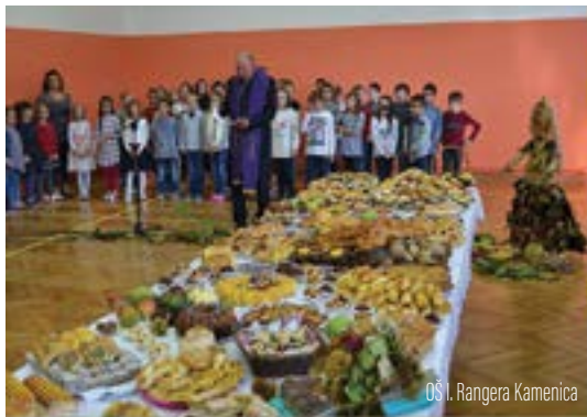
OŠ I. Rangera Kamenica