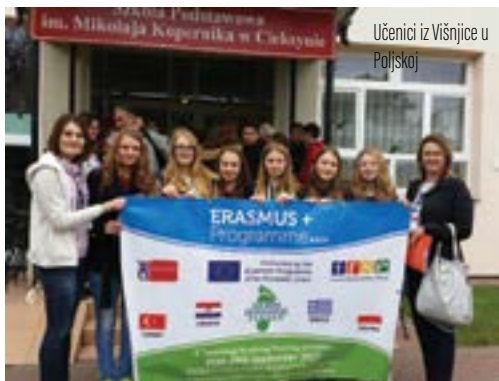
Učenici iz Višnjice u Poljskoj

- Riječ je o projektu koji se provodi i financira u okviru Erasmus+ programa Europske unije, a cilj mu je podizanje ekološke svijesitosti provedbom različitih samostalnih radionica u školama te na zajedničkim susretima koji će biti organizirani u svim školama koje sudjeluju u projektu. Tako su učenici iz višnjičke škole, prije Poljske, boravili