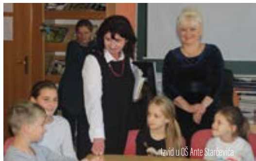
Izvid u OS Ante Starčevića

Grad Lepoglava je i inače prijatelj djece, ali na ovaj način željeli bismo to formalizirati. Tijekom naše kandidature ispunili smo