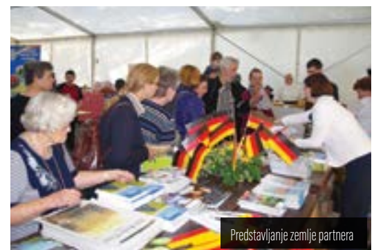
Predstavljanje zemlje partnera