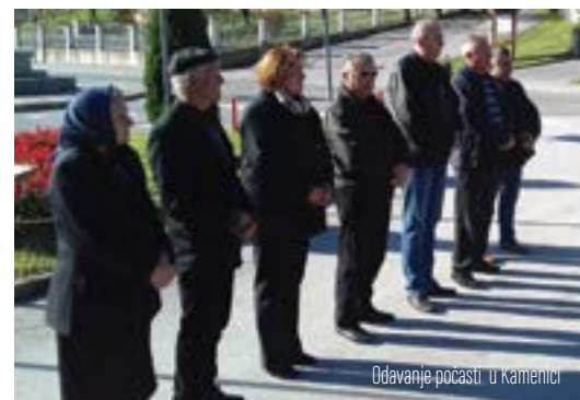
Odavanje počasti u Kamenici

Počast je poginulim braniteljima odana i na njihovim posljednjim počivalištima.