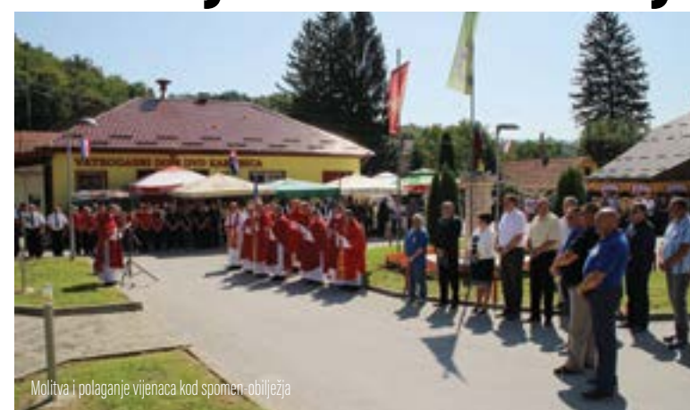
Molitva i polaganje vijenaca kod spomen-obilježja

Nakon misnog slavlja višnjički su kuburaši počasnim pucnjem odali počast stradalima.