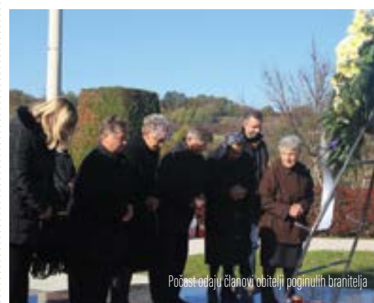
Počast odaju članovi obitelji poginulih branitelja

Grad Lepoglava se povodom Dana mrtvih prisjetio svojih preminulih građana.