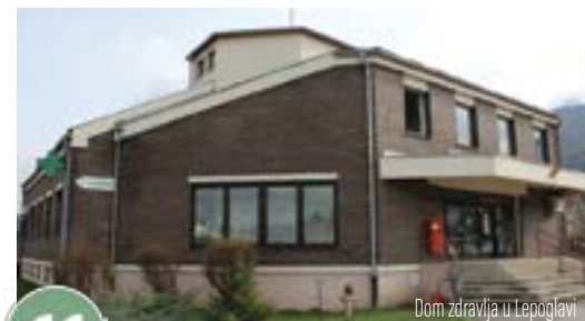
Doma zdravlja u Lepoglavi

Dugi niz godina Grad Lepoglava nastoji realizirati projekt izgradnje dizala u zgradi Doma zdravlja u Lepoglavi. S obzirom na to da je riječ o zgradi koja je u vlasništvu Doma zdravlja Varaždinske županije, Gradu su pri tome uglavnom bile "vezane ruke". No, nismo čekali da netko drugi iznađe rješenje, već smo se u okviru dopuštenih zakonskih mogućnosti angažirali oko tog projekta. Izradili smo i projektnu dokumentaciju te pronašli način da se prijavimo na jedan od natječaja na kojem smo imali izglednu priliku dobiti potrebna sredstva, no cjelokupni je