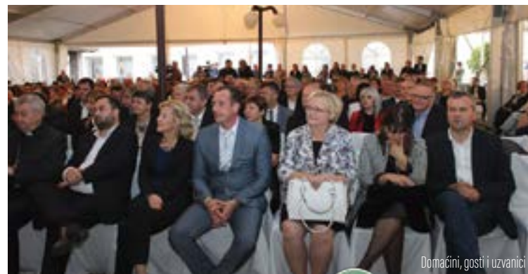
Domaćini, gosti i uzvanici