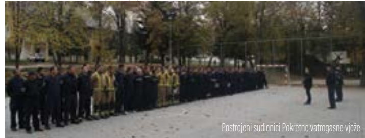
Postrojeni sudionici Pokretne vatrogasne vježbe

Prvo je mjesto osvojila prva ekipa DVD-a Višnjice. Drugo je mjesto zauzela druga ekipa DVD-a Višnjice dok se na treće mjesto plasirala ekipa DVD-a Lepoglave. Četvrto je mjesto zauzela ekipa DVD-a Kamenice.