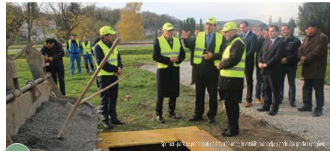
Spomen-park će podsjećati na žrtvu 12-orice hrvatskih branitelja s područja grada Lepoglave

“Projekt je vrijedan 150.000 kuna. Ministarstvo hrvatskih branitelja financirat će ga sa 100.000 kuna, a Grad Lepoglava sa 50.000 kuna.”