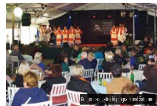
Kulturno-umjetnički program pod šatorom