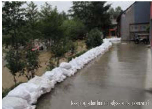
Nasip izgrađen kod obiteljske kuće u Žarovnici

Zbog obilnih je kiša na više mjesta na gradskom području 19. rujna došlo do izlivanja vode iz korita potoka koja je zaprijetila kućama i gospodarskim objektima. Najkritičnije je bilo na području Žarovnice i u Višnjici gdje su vatrogasci gradili zečje nasipe zaustavljajući prodor vode u kuće.