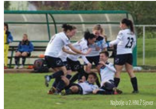
Najbolje u 2. HNLŽ Sjever

Seдам pobjeda u sedam odigranih kola ostvarile su nogometašice Lepoglave u jesenskom dijelu prvenstva 2. hrvatske nogometne lige za žene skupine Sjever.