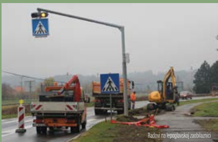
Radovi na lepoglavskoj zaobilaznici

U okviru radova postavljanja rasvjete na navedenim križanjima planira se gradnja kanala za buduće vodove kandelaberske javne rasvjete na potezu od asfaltna baze do križanja na ulazu u Lepoglavu s državne ceste D35 u Čretu.