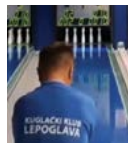
Kuglači u borbi za vrh

Kuglački klub Lepoglava nakon odigranih osam kola 1. B hrvatske kuglačke lige Sjever nalazi se na drugom mjestu prvenstvene tablice.