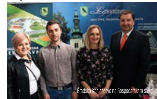
Gradska izaslanstva na Gospodarskom sajmu

- Koristimo svaku prigodu predstaviti naše potencijale i tako privući investitore i goste u naš grad. Uvjete za dolazak investitora i ulaganje smo stvorili, ali potrebno ih je predstaviti što i činimo sudjelovanjem na ovim i sličnim sajmovima. Predstavljanjem naše turističke ponude želi-