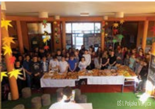
OŠ I. Poljaka Višnjica