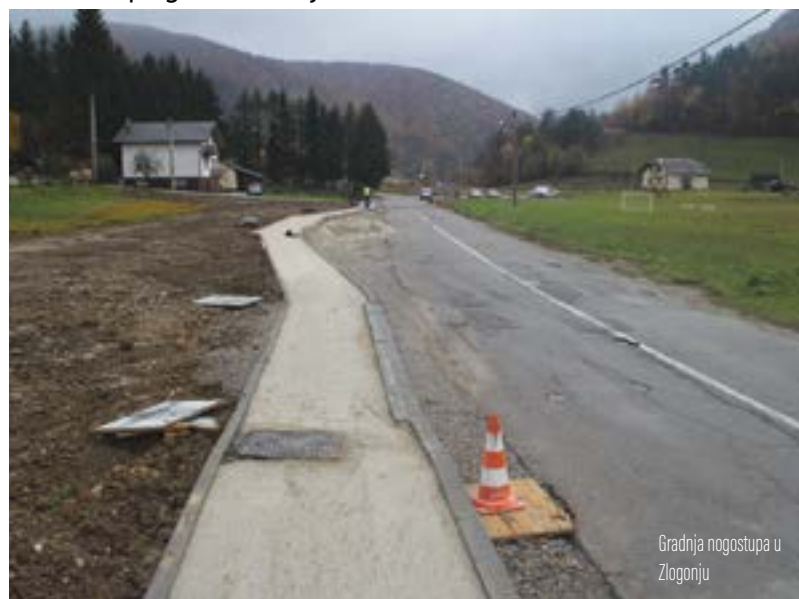
Gradnja nogostupa u Zlogonju

Izgradnju nogostupa financiraju Županijska uprava za ceste i Grad Lepoglava u omjeru 75:25 %.