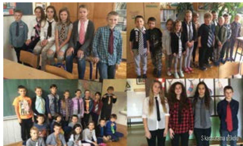
S karavatama u školu

Za učenike i učitelje OŠ Ante Starčevića iz Lepoglave 18. listopada nije bio uobičajen dan što se odijevanja tiče. Naime, tog su dana u školu stigli noseći kravate. Povod tomu bio je Dan kravate koji se obilježava upravo 18. listopada.