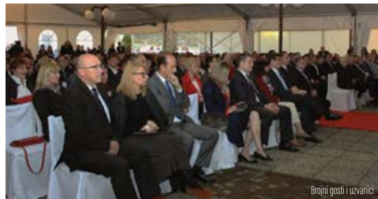
Brojni gosti i uzvanici