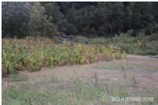
Voda je poplavila usjeve

U Žarovnici i Višnjici zečji su nasipi izgrađeni kod nekoliko kuća koje se nalaze u blizini lokalnih potoka koji su se izlili zbog obilne kiše. Vatrogascima su tehničku pomoć pružile tvrtke Lomi i TTG iz Višnjice dovozeći vreće s pijeskom,.