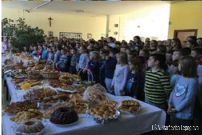
OŠ A. Starčevića Lepoglava