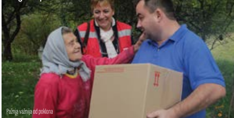
Pažnja važnija od poklona