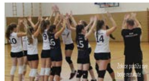
Žokice postižu sve bolje rezultate

Do kraja prvog dijela prvenstva još su tri kola, a za vodećom momčadi lige, Medveščakom 1958, Lepoglava zaostaje dva boda.