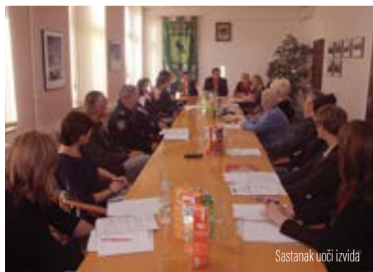
Sastanak uoči izvida

Hoće li Grad Lepoglava dobiti status grada prijatelja djece, znat će se sredinom studenoga kada budu objavljeni rezultati odluke o dodjeli statusa koja će biti donesena i na temelju rezultata obavljenog izvida.