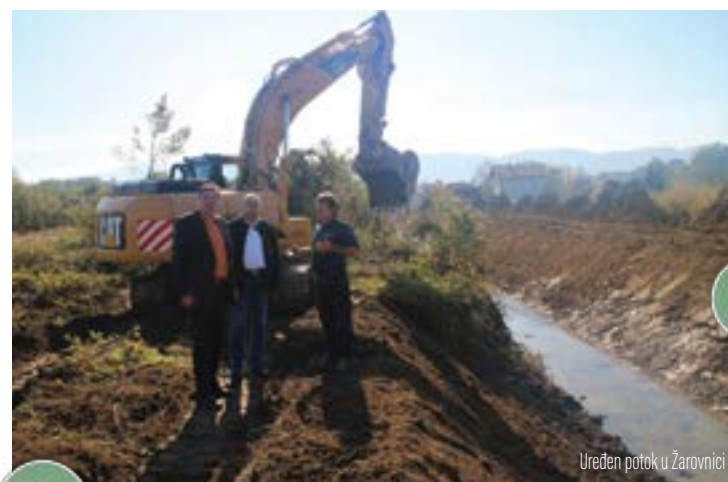
Uređen potok u Žarovnici

Gradnja navedenog nogostupa nije krenula zbog problema koje Županijska uprava za ceste ima s izvođačem radova s kojim je raskinut ugovor te se kreće u odabir novog izvođača radova.