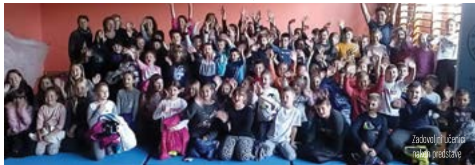
Zadovoljni učenici nakon predstave

Na kraju predstave s učenicima je realizirana kratka i poučna radionica koja se bavi preživljavanjem u prirodi.