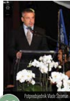
Potpredsjednik Vlade Štromar

Brojne je goste pozdravio domaćin, lepoglavski gradonačelnik Marijan Škvarić, istaknuvši nacionalno značenje Festivala koji okuplja sve čipkarske lokalitete i organizacije iz Hrvatske, ali i spaja Lepoglavu gotovo sa svim kontinentima. Poseban je naglasak u obraćanju gostima gradonačelnik Škvarić stavio na značajne obljetnice koje će biti obilježene tijekom trajanja 21. Međunarodnog festivala čipke.