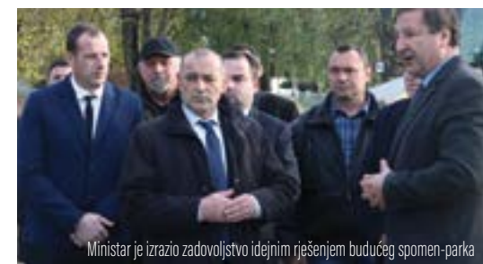
Ministar je izrazio zadovoljstvo idejnim rješenjem budućeg spomen-parka

Nazočili smo početku radova na modernom spomen-obilježju koje će budućim naraštajima prenositi poruku od 12 hrabrih hrvatskih branitelja koji su svoje živote položili za slobodu domovine. Drago mi je da kao ministar i u partnerstvu s Gradom Lepoglavom mogu sudjelovati u izgradnji jednog takvog modernog spomen-obilježja koji je po svom dizajnu i rješenju fantastično uklopljen u prostor. Uvjeren sam da će hrvatski branitelji i članovi obitelji poginulih hrvatskih branitelja te građani, a nadam se i naši budući naraštaji, biti sretni i zadovoljni tim rješenjem – istaknuo je ministar Tomo Medved.