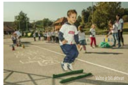
Važno je biti aktivan

Zajednica sportskih udruga grada Lepoglave organizirala je niz sportskih događanja povodom Europskog tjedna sporta i Hrvatskog olimpijskog dana.