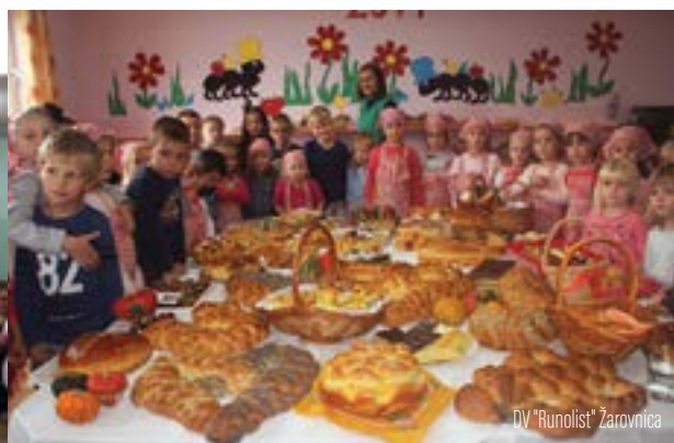
DV "Runolist" Žarovnica