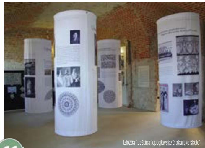
Izložba "Baština lepoglavske čipkarske škole"

"Razlog za prihvaćanje partnerstva bilo je i to što je Festival u Lepoglavi dobar način za pokazati da kontinentalni dio Hrvatske ima što ponuditi."