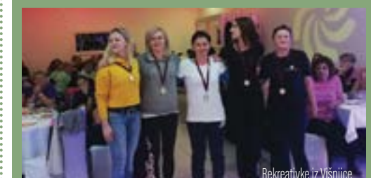
Rekreativke iz Višnjice

U ukupnom poretku ekipa USR-a Višnjice osvojila je 7. mjesto, dok se ekipa Lepoglavske Vesi plasirala na 14. mjesto.