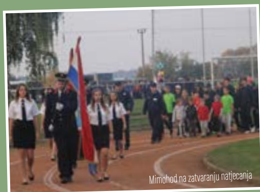
Mimohod na zatvaranju natjecanja

U Lepoglavi je 1. listopada u organizaciji Vatrogasne zajednice Varaždinske županije te uz potporu DVD-a Lepoglava i Vatrogasne zajednice grada Lepoglave održano 12. natjecanje vatrogasne mladeži Varaždinske županije.