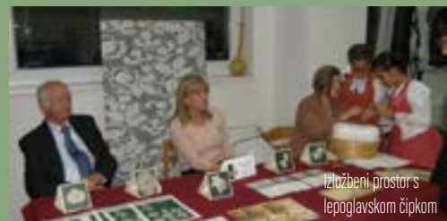
Izložbeni prostor s lepoglavskom čipkom

Lepoglavska čipka predstavljena je od 13. do 15. listopada na 1. Izložbi čipke u Sikirevcima. Izložbu je organizirala udruga Sikirevački motivi, stalni gost i izlagač na Međunarodnom festivalu čipke u Lepoglavi.