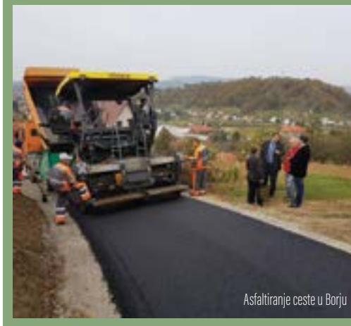
Asfaltiranje ceste u Borju

Za svaku od tih dionica Grad Lepoglava je osigurao 85 % potrebnih sredstava od ukupnog iznosa, dok su preostalih 15 % podmirili građani koji će koristiti tu dionicu.