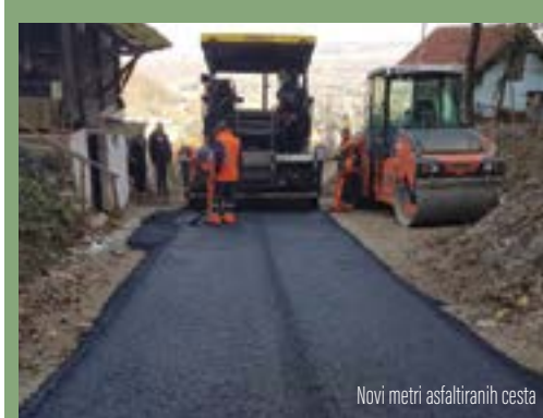
Novi metri asfaltiranih cesta

Polaganjem asfaltnog tepiha na dionicama nerazvrstanih cesta Horvati - Gaj u Borju te Vukovski - Križopotje Franci u Gornjoj Višnjici završen je ovogodišnji Program modernizacije i asfaltiranja nerazvrstanih cesta na području grada Lepoglave.