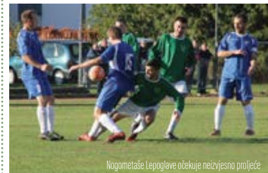
Nogometaše Lepoglave očekuje neizvjesno proljeće

U 13 odigranih kola Lepoglava je doživjela devet poraza, dva je puta odigrala neriješeno, a ostvarila je tek dvije prvenstvene pobjede te tako osvojila osam bodova.