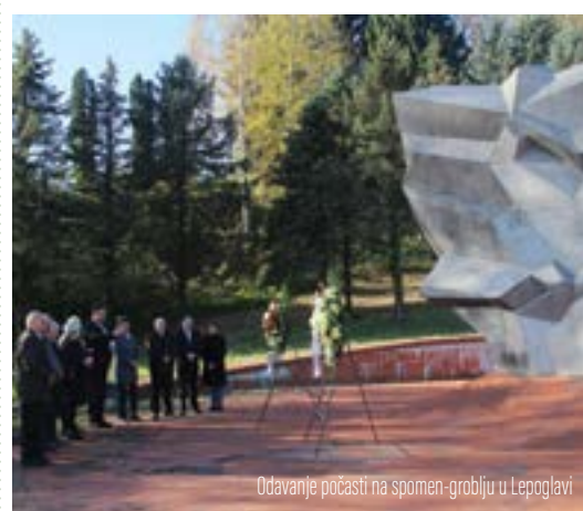
Odavanje počasti na spomen-groblju u Lepoglavi

Povodom Dana mrtvih izaslanstvo Grada Lepoglave predvođeno gradonačelnikom Marijanom Škvarićem te članovima Udruge antifašista i antifašističkih boraca iz Lepoglave položilo je vijence i upalilo svijeće na spomen-groblju u Lepoglavi. Vijenci su položeni i kod spomen-obilježja poginulim antifašistima u Kamenici i Višnjici.