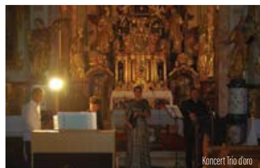
Koncert Trio d'oro