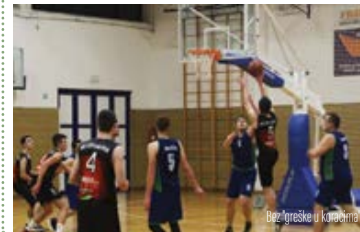
Bez igračke u konkurenciji

Košarkaši Lepoglave odlično su otvorili novu prvenstvenu sezonu 4. košarkaške lige Košarkaškog saveza Međimurske županije. U prvih pet kola ostvarili su stopostotan učinak i bez poraza nalaze se na vrhu prvenstvene tablice u konkurenciji 11 klubova.