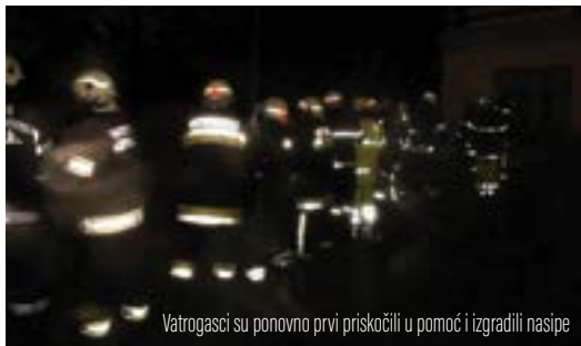
Vatrogasci su ponovno prvi priskočili u pomoć i izgradili nasipe

Na pojedinim mjestima došlo je do izlivanja rijeke Bednje i plavljenja okolnih površina. Najveće probleme ovog su puta stvarali potoci bujičari koji su se izlivali na cijelom gradskom području i plavili brojne površine ugrožavajući kuće i druge objekte.