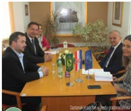
Sastanak je održan u uredu gradonačelnika

Razgovarali smo o svim otvorenim pitanjima vezanim za Kaznionicu i Grad Lepoglavu. Ono što je na sastanku dogovoreno je konkretno rješavanje otvorenih pitanja. Moram priznati da nisam bio upoznat s tim da postoji to-