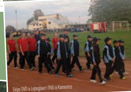
Ekipe DVD-a Lepoglave i DVD-a Kamenice