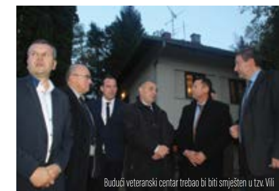
Budući veteranski centar trebao bi biti smješten u tzv. Vili

obišao je objekt Vile i izrazio zadovoljstvo samim objektom i njegovim stanjem.