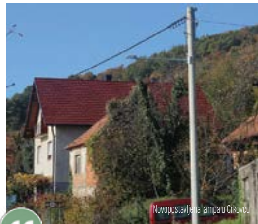
Novopostavljena lampa u Crkovcu

Riječ je o zahvatu kojim se na postojeće električne stupove postavljaju nova LED rasvjetna tijela - ukupno 91 lampa. Dio lampi, i to one koje se postavljaju na stupove uz lokalne i nerazvrstane ceste, snage su 28 vata dok su one koje se postavljaju uz županijsku cestu snage 38 vata.