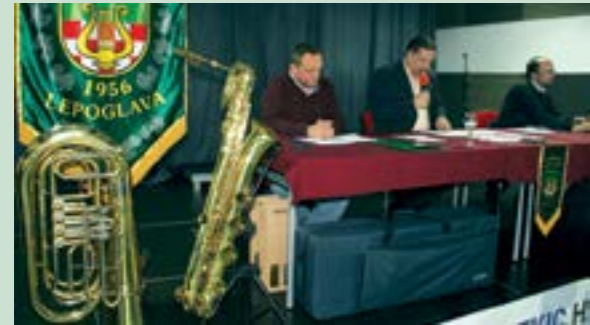
Na Skupštini je najavljeno kako će Limena glazba i ove godine dobiti nove puhače instrumente

Limena glazba Lepoglava je u 2018. godini imala 26 nastupa - istaknuto je na redovitoj sjednici Skupštine.