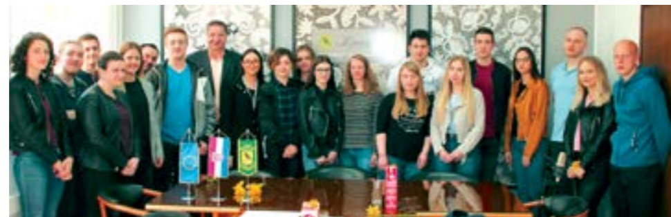
Grad će studentima plaćati stipendiju u iznosu od 700 kuna mjesečno

U Gradskoj vijećnici u Lepoglavi 23 studenta s područja Grada Lepoglave potpisalo je s Gradom Lepoglavom ugovore o stipendiranju.