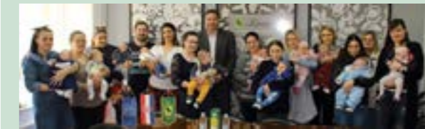
Ovoga je puta gradsku potporu primilo 13 obitelji

Grad Lepoglava je u gradskoj vijećnici uoči Uskrsa organizirao prijem za roditelje novorođene djece na kojem su im uručene jednoglasne gradske novčane potpore.