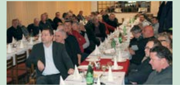
Na Skupštini Udruge vinogradara, vinara i voćara Klopotec dodijeljeno je sedam zlatnih te 36 srebrnih i 28 brončanih medalja

- Vinogradarstvo i proizvodnja vina jedan je od potencijala za razvoj Grada Lepoglave, koji svojim projektima i programima razvija infrastrukturu koja omogućava da se taj potencijal iskoristi - istaknuo je gradonačelnik Lepoglave Marijan Škvarić.