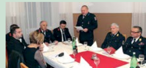
Istaknuta je odlična suradnja Vatrogasne zajednice i Grada Lepoglave

Nakon gradskih DVD-ova, skupštinu je održala i Vatrogasna zajednica Grada Lepoglave.