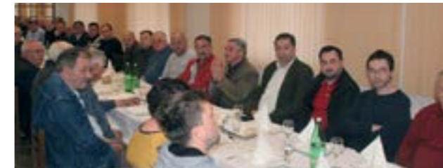
Na Skupštini je najavljeno da će Grad nastaviti podržavati rad Pčelarske udruge Čmalico

nika i vrtičkih mališana uvede med i proizvodi od meda - istaknuo je na Skupštini gradonačelnik Marijan Škvarić.