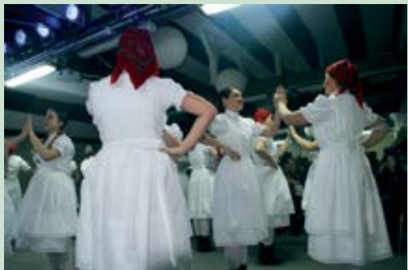
Glazba i ples ispunili su lepoglavski Dom kulture

Kulturno umjetničko društvo Lepoglavski pušlek i ove je godine organizirao u Lepoglavi - Večer Valentinova.