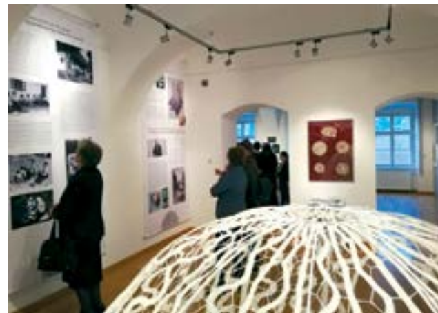
Šator od čipke jedna je od atrakcija bjelovarske izložbe - Čarolija čipke

Izložba je tematski podijeljena u tri cjeline, pa je na njoj predstavljen nastanak i razvoj čipkarstva, zatim čipkarstvo u Hrvatskoj, pri čemu je posebno predstavljena vrijedna baština vezana uz lepoglavsku čipku, te čipkarstvo s područja Bilogore i sjeverne Moslavine. Lepoglavsko čipkarstvo predstavljeno je s baroknim čipkama, haljinama s motivima čipke, instalacijom "šator od čipke" te popratnim tekstovima i fotografijama koje su posjetitelje upoznale s poviješću lepoglavskog čip-