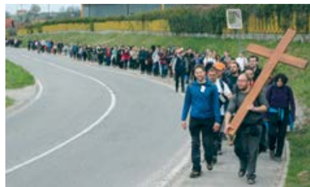
Na hodočasnički put od 45 km krenulo je više od 200 hodočasnika

tom je u župnoj crkvi za njih služena i sveta misa.