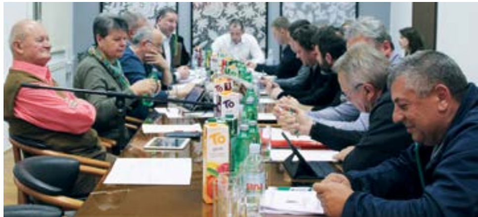
Na sjednici Gradskog vijeća prihvaćena je odluka o sufinanciranju smještaja djece u dječjim vrtićima

- Kriteriji su isti za svu djecu bez obzira da li