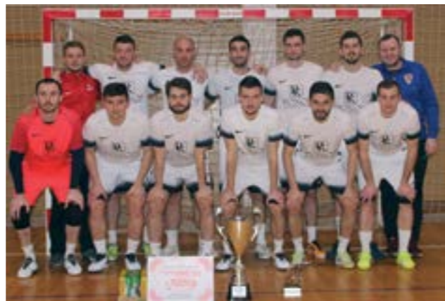
Momčad ASO Ponos pobjednik je ovogodišnjeg malonogometnog turnira u Lepoglavi