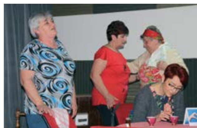
Na Kazališnim noćima u Lepoglavi nastupili su glumci - amateri iz sjeverozapadne Hrvatske

Prve večeri, u subotu, 23. ožujka, nastupilo je pet amaterskih družina - Priločka amaterska scena iz Preloga, Udruga žena iz Svetog Đurđa, KUD Zvonec iz Krapine, KUD Kaštel iz Pribislavca te Klub za starije osobe iz Varaždina, a sljedeće večeri publici su se predstavili - Dramska družina Ka te briga mi iz Petrijanca, KUD Goričan, Udruga umirovljenika iz Malog Bukovca te Udruga Profesionalci iz Gojanca.