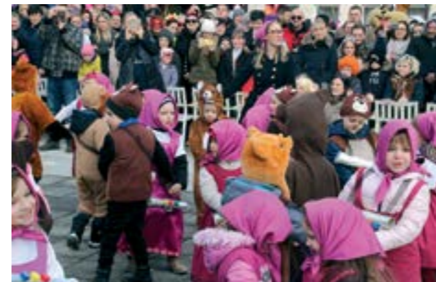
Ovogodišnji fašnik u Lepoglavi bio je u znaku - najmlađih

Na terasi restorana Ivančica fašničke skupine iz dječjih vrtića Runo-