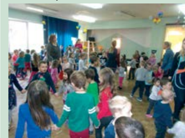
Valentinovska atmosfera u lepoglavskom dječjem vrtiću

Predškolska skupina polaznika vrtića pripremila je za Dan je zaljubljenih za sve vrtičke skupine kratki i šaljivi igrokaz o zaljubljenim žabicama i ljubavnim mukama mačaka.