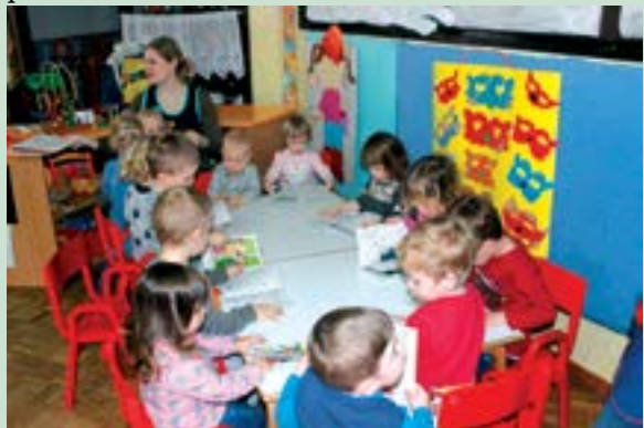
Bojanku već koriste djeca u dječjim vrtićima i osnovnim školama na području Grada Lepoglave i Općine Klenovnik

Primjerci ove poučne bojanke moći će se naći i u Gradskoj knjižnici u Lepoglavi te u školskim knjižnicama u osnovnim školama.