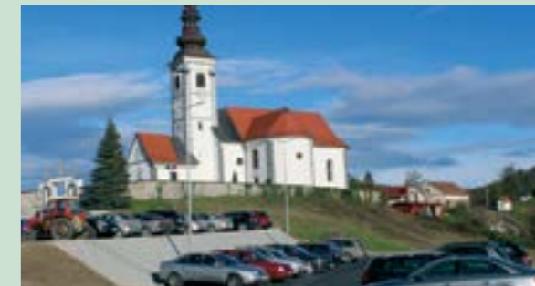
Pred crkvom u Višnjici uređeno je parkiralište s četrdesetak parkirnih mjesta

U blizini višnjičke župne crkve i trga dovršena je izgradnja parkirališta kojim će se riješiti dugogodišnji problem nedostatka parkirnog prostora, posebno u vrijeme obilježavanja crkvenih svetkovina i održavanja crkvenih obreda. Na novom parkiralištu u Višnjici uređeno je četrdesetak parkirnih mjesta.