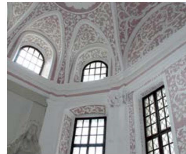
Nakon dvije godine opsežnih konzervatorsko-restauratorskih radova završena je restauracija štukatura kapele svetog Trojstva

O završenim radovima na štukaturi kapele svetog Trojstva, koja je prigrađena uz južni zid lade lepoglavske crkve 1705. godine, govorila je mr. sc. Dijana Požar , voditeljica Odjela za štuko Hrvatskog restauratorskog zavoda. - Štukatura je imala karakteristična oštećenja, pukotine, nedostajali su pojedini dijelovi, a bila je i višekratno preličena slojevima naknadne boje. Radovi koje