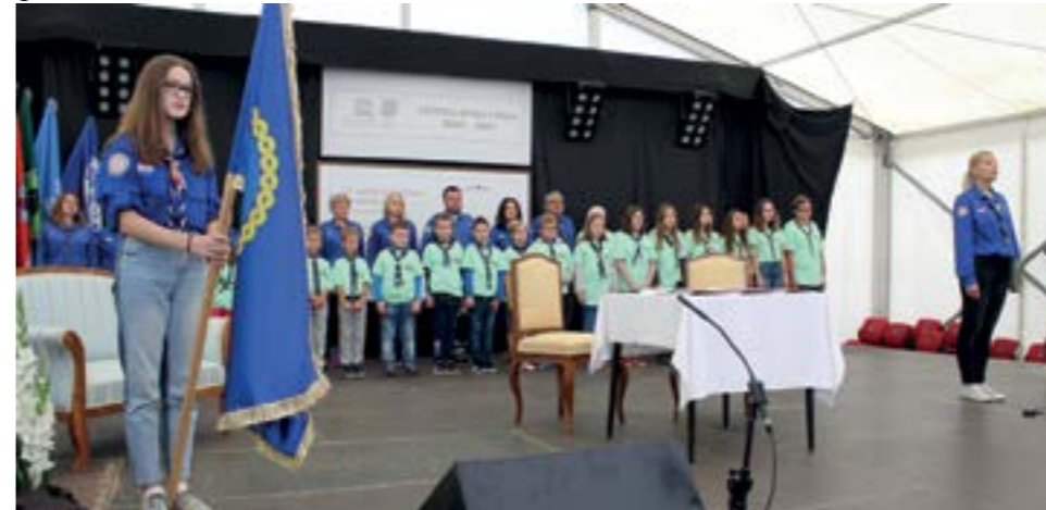
Na 17. Brđanskim susretima u Lepoglavi bilo je više od 170 izviđača

Više od 170 izviđača iz cijele Hrvatske okupilo se od 13. do 15. rujna u Lepoglavi, na 17. Brđanskim susretima Saveza izviđača Hrvatske.