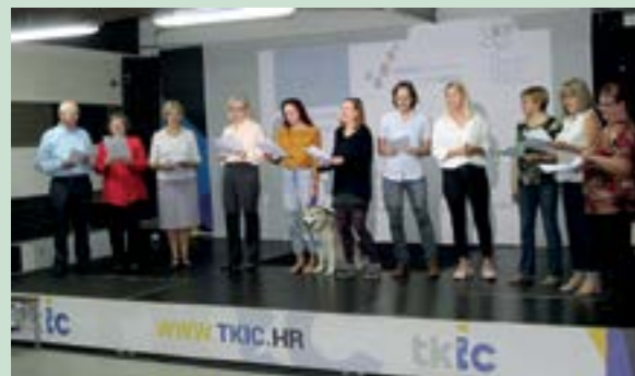
U projektu su sudjelovale i čipkarice iz Lepoglave

Projekt "Čipka iluzija" izjedrio je istomenu dramsku predstavu, dokumentarni film, radio dramu te audio CD. Lepoglavskom premijerom kratkog dokumentarnog filma te premijerom radio drame i glazbenog albuma završio projekt koji je za cilj imao postizanje bolje socijalne uključenosti i unaprjeđenje kvalitete života osoba starijih od 54 godine, kroz poboljšanje pristupa kulturnim i umjetničkim aktivnostima.