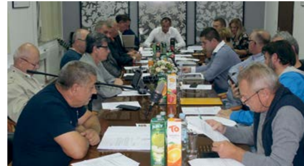
Vijećnici su na sjednici raspravljali o 12 točaka dnevnog reda

Grad Lepoglava će, zajedno s Općinom Bednja, biti partner Centru za socijalnu skrb iz Ivanca u projektu koji će biti prijavljen na program Unapređivanje infrastruktu-