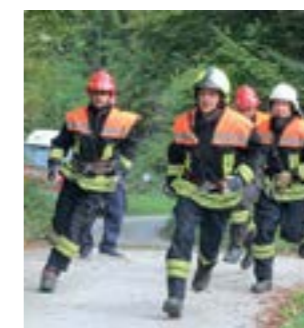
U Višnjici je održan 4. Memorijal Darko Komes

DVD-a Čret i DVD-a Mače. Natjecanje se odvijalo na šest lokacija na području Višnjice na kojima su vatrogasci izvršavali zadane vatrogasne zadatke, pri čemu je najuspješnija bila ekipa DVD-a Čret, koja je tako obranila prošlogodišnji naslov, drugo je mjesto zauzela ekipa DVD-a Lepoglava, a treće DVD-a Ivanec.