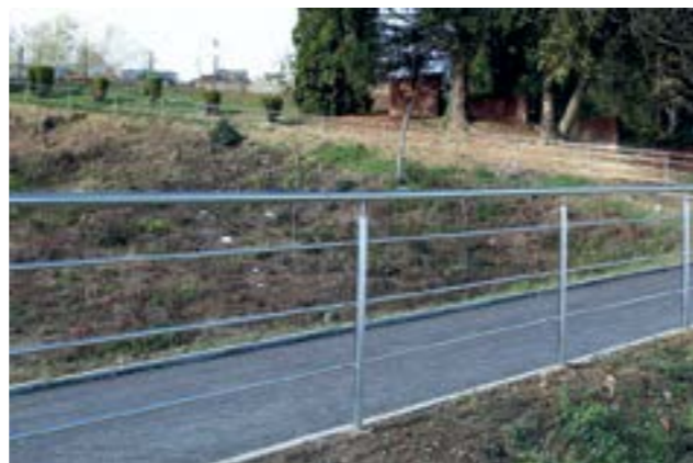
Pred blagdan Svih svetih uređen je prilaz starom groblju u Lepoglavi

Radove je, nakon provedene javne nabave na kojoj joj je dodijeljen posao sanacije ovog pri-