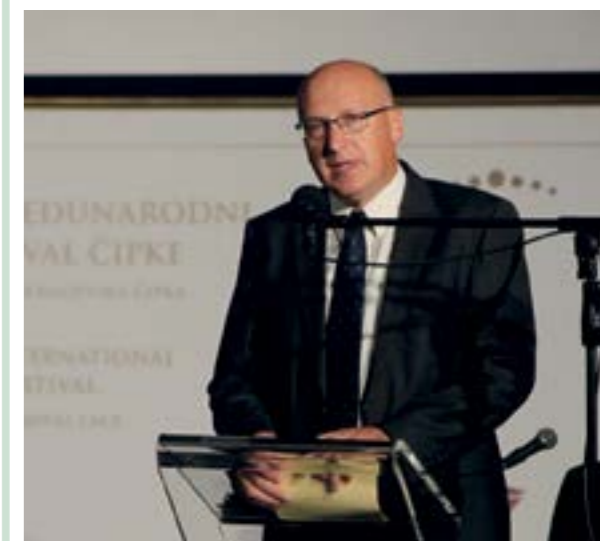
Državni tajnik Zdravko Jakop, izaslanik predsjednice Kolinde Grabar-Kitarović, prenio je njenu zahvalu lepoglavskim čipkaricama

Na svečanom otvaranju 23. Međunarodnog festivala u Lepoglavi, državni tajnik Zdravko Jakop, izaslanik predsjednice Republike Hrvatske Kolinde Grabar-Kitarović, visoke pokroviteljice festivala u Lepoglavi, prenio je zahvalu predsjednice Republike lepoglavskim čipkaricama i organizatorima ovoga festivala na predanom i ustrajnom radu u zaštiti vrijedne tradicijske baštine.