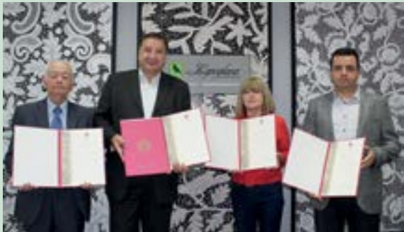
Priznanja za predani rad na očuvanju vrijedne tradicijske baštine

Etnografski muzej osnovan je 1919. godine i od tada prikuplja, čuva, istražuje, obrađuje i izlaže vrijedne predmete tradicijske kulture.