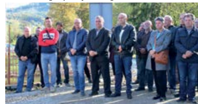
Uzvanici na svečanosti polaganja povelje u temelje novoga vrtića

Radovi na izgradnji zgrade vrtića u Višnjici trebali bi biti gotovi do polovice iduće godine, nakon čega će uslijediti opremanje vrtića, pa će novi dječji vrtić s radom započeti na jesen sljedeće godine.