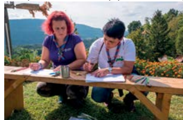
Izviđači su imali prigodu upoznati prirodne i kulturne znamenitosti lepoglavskog kraja