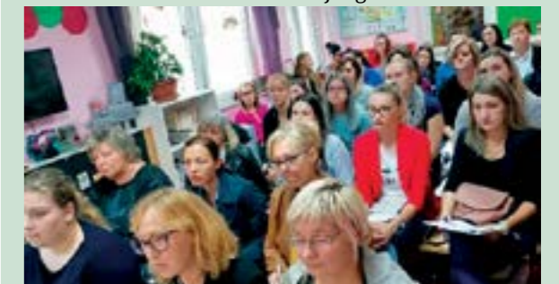
Na susretu u Žarovnici bile su odgajateljice iz šest dječjih vrtića

ranja prostora u vrtiću s puno odgojno - obrazovnih potencijala za cjeloviti dječji razvoj. Najvažnija uloga prostora je omogućavanje dječji obavljanje njihove glavne aktivnosti, a to je igra.