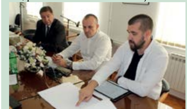
Predstavnici tvrtke Kocka iz Sibenika predstavili su prijedloge rješenja postave i koncepta Centra za posjetitelje

Projekti likovnog postava, opremanja interijera i muzeološkog koncepta te likovnog postava i opremanja, kada budu konačno definirani, s ostalom će dokumentacijom omogućiti Gradu Lepoglavi prijavu projekta Centar za posjetitelje "Centar pavlina" na natječaj Europske unije te resornih ministarstava, kako bi se osigurala sredstva za njegovu punu realizaciju.