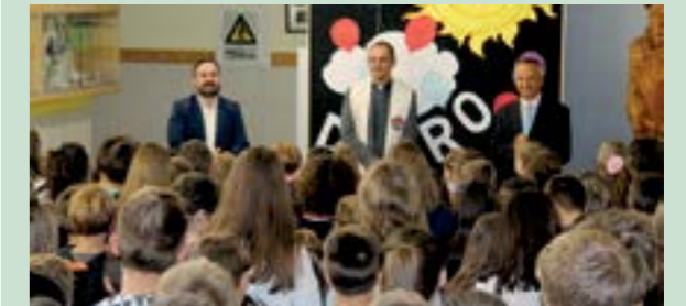
Učenicima je uspjeh u novoj školskoj godini zaželio zamjenik gradonačelnika Hrvoje Kovač

Grad Lepoglava i ove godine financijski podupire školske projekte i programe, pa je Grad pružio financijsku potporu kod nabavke školskog pribora za učenike prvih razreda, sufinancira prijevoz učenika kao i projekt cjelodnevnog boravka u školi te izvannastavne aktivnosti, a na kraju i ove školske godine nagradit će najuspješnije učenike i njihove mentore.