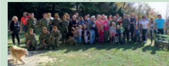
U akciji je sudjelovalo pedesetak volontera

Pod motom - Zasadi drvo, ne budi panj", na stotinjak lokacija diljem Hrvatske provedena je akcija kolektivne sadnje drveća. Akcija je provedena u organizaciji građanske inicijative Dani kolektivne sadnje drveća, a jedna od lokacija na kojoj su se volonteri sadili sadnice bila je i ona na Ravnoj gori.