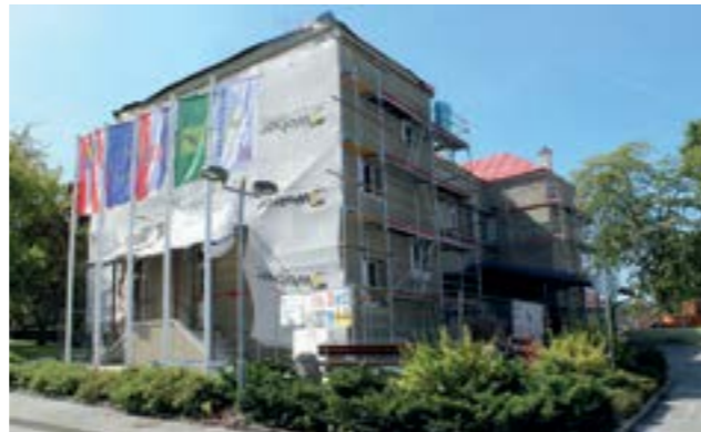
Radove na energetskej obnovi zgrade gradske uprave Ministarstvo regionalnog razvoja poduprla je s 300 tisuća kuna

S ovih dodatih, više od 300 tisuća kuna značajno smo smanjili učešće Grada u financiranju energetske obnove zgrade gradske uprave, pa ćemo tim sredstvima koja su ostala u gradskom proračunu moći financirati druge razvojne projekte. Na ovaj način nastavlja-