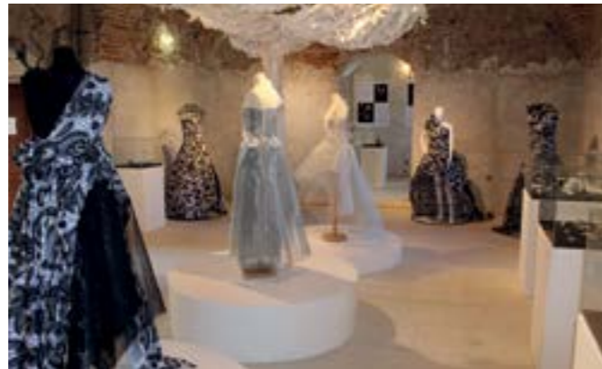
Atraktivni izložci na ovogodišnjem festivalu čipke

- Lepoglava je grad duge i bogate kulturne tradicije, koju dugujemo pavlinima, ali i tradicijske kulture, koju imamo zahvaliti upravo našim čipkaricama, koje su očuvale tu iznimno vrijednu tradiciju i koje vještinu izrade lepoglavске čipke prenose novim naraštajima. Zahvaljujući toj tradiciji Lepoglava se može prezentirati ne samo lokalno ili na nacionalnoj razini, već u cijelom svijetu, što najbolje svjedoči podatak da na ovogodišnjem festivalu predstavljamo čipke iz čak 16 zemalja svijeta, među kojima su, prvi puta, i čipke iz zemalja Južne Amerike. Zahvaljujući našoj čipki stekli smo mnogo pri-