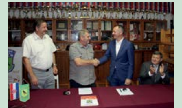
Ugovor je potpisan u Vatrogasnom domu u Lepoglavi

Nabava novog navalnog vozila za DVD Lepoglavu, koju će financirati Grad Lepoglava, dio je najavljenih ulaganja u vatrogastvo na području Grada Lepoglave vrijednih 10 milijuna kuna.