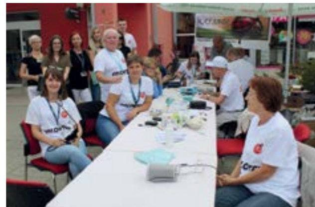
U Lepoglavi je organizirana javno - zdravstvena akcija - Puhanjem do zdravlja

Odaziv građana je dobar, no često nas izbjegavaju pušači, a upravo je pušenje direktno poveza-