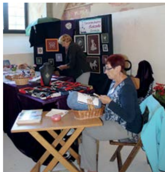
Na festivalu su predstavljene čipke iz čak 16 zemalja svijeta

Na festivalu su ove godine održana i predavanja te radionice koje su organizirane uz Dan Europske godine kulturne baštine na temu - Umjetnost i zabava, filatelistička izložba te izložba učeničkih zadruga iz lepoglavskog kraja. I ove je godine ispred restorana Ivančica postavljen sajam tradicijskog rukotvorstva i starih zanata. Posebno atraktivni program organizirala je u subotu zemlja - partner festivala, priredivši Flamenco show plesne grupe Flame&Co, dok je u nedjelju festivalska publika imala prigodu uživati u nastupu Folklorne skupine Osijek 1862, koji je upriličen u suradnji s FolkoFonijom, međunarodnim festivalom