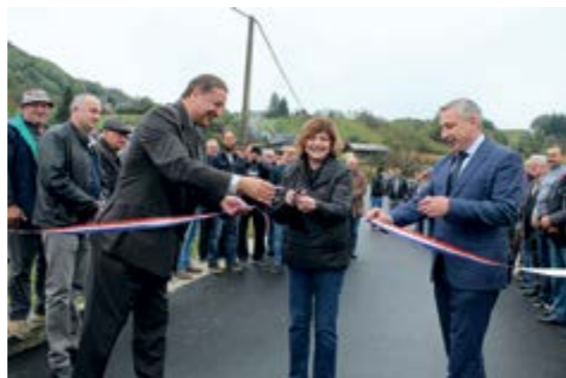
Na svečanosti otvorenja ceste bio je i potpredsjednik Vlade RH

U nazočnosti potpredsjednika Vlade i ministra graditeljstva i prostornog uređenja Predraga Štomara otvorena je novouređena cesta Antekolovići - Huđi u Žarovnici.