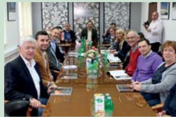
Članovi Rotary Cluba Zagreb Medvedgrad na prijemu u gradskoj vijećnici u Lepoglavi

U Kameničkom Podgorju je 10. studenoga obilježen završetak projekta ugradnje automatskog dozatora klora na lokalnom vodovodu Strupari - Jureni. Projekt je realiziran zahvaljujući suradnji i financijskoj podršci Rotary Cluba Zagreb Medvedgrad i Grada Lepoglave.