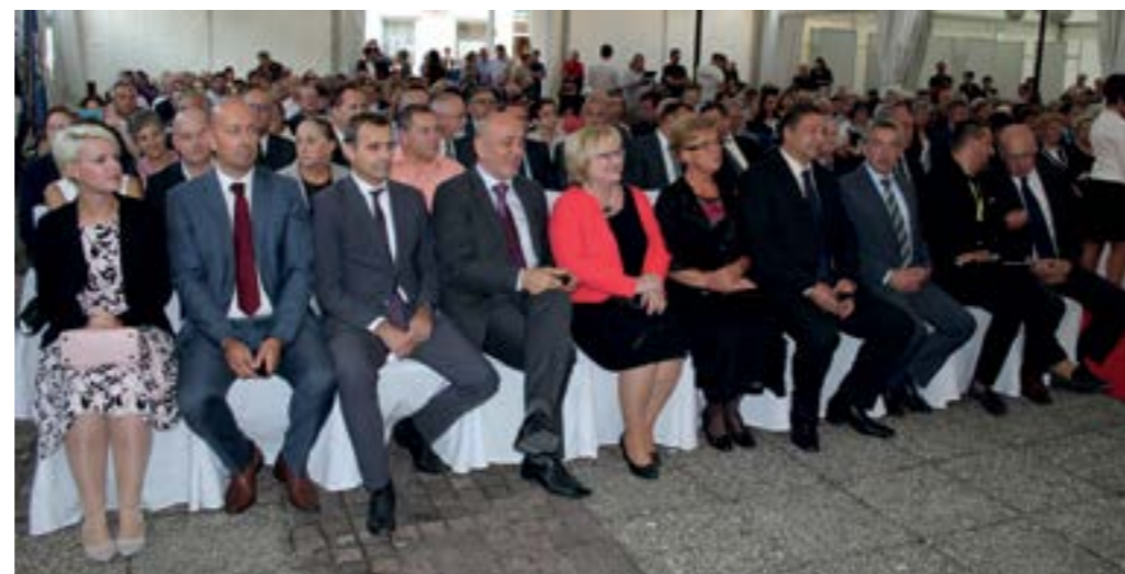
Visoki uzvanici na svečanom otvorenju 23. Međunarodnog festivala čipke

ateljstva, sklopili smo mnogo partnerstva, uspostavili smo niz kulturnih veza i stjecali nova iskustva u očuvanju i prezentaciji te vrijedne tradicijske baštine. S ponosom možemo reći kako je Lepoglava ovih dana čipkarsko središte svijeta - istaknuo je gradonačelnik Lepoglave pred uzvanicima na svečanom otvorenju lepoglavskog čipkarskog festivala te podsjetio kako Lepoglava, kolijevka naše kulture, ove godine obilježava nekoliko