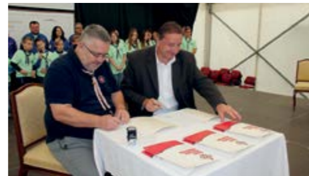
Potpisivanjem sporazuma o suradnji Grad Lepoglava je započeo proces stjecanja statusa - Grad prijatelja izviđača

Želimo da lepoglavski kraj i Varaždinska županija ostave traga u vašim sjećanjima, ali i da vi ovdje ostavite svoj trag potaknuvši daljnji razvoj izviđačkog pokreta - poručio je dožupan Vugrin .