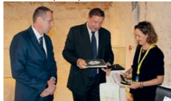
Izložbe je prvog festivalskog dana razgledala i ministrica kulture Nina Obuljen Koržinek

Ministrica kulture izložbe je razgledala u pratnji gradonačelnika Marijana Škvarića , njegovog zamjenika Hrvoja Kovača te predsjednika Gradskog vijeća Roberta Dukarića .