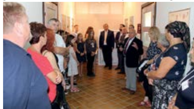
Na izložbi su predstavljene dopisnice i poštanske marke s motivima Lepoglave i Međunarodnog festivala čipke

pošte podsjetila je na suradnju Hrvatske pošte s