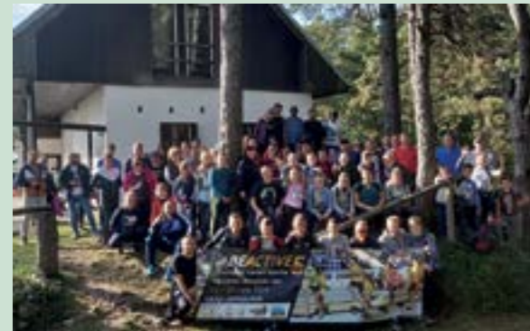
Rekreativci iz Višnjice i ove su godine pješačili na Ravnu goru

Pješačilo je 75 rekreativaca koji su se krenuvši od višnjičke škole, popeli do planinarskog doma Pustih, gdje je za sve bio organiziran ručak.