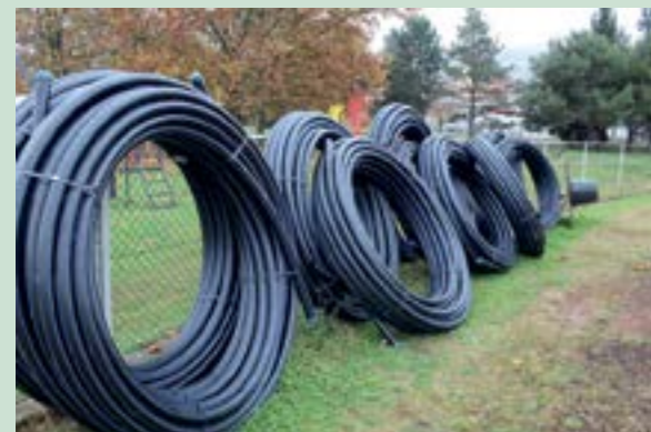
Na igralištu će biti postavljen i novi sustav za navodnjavanje

Temeljem potpisanog ugovora izvođač radova obavezan je radove na rekonstrukciji nogometnog igrališta u Lepoglavi, koje je započeo uklanjanjem starog travnjaka, završiti najkasnije do 1. lipnja 2020. godine.