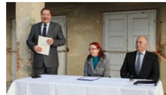
Potpisivanjem ugovora napravljen je značajan korak u realizaciji projekta vatrogasno-društvenog doma u Kamenici

Gradonačelnik Škvarić i ovu je prigodu iskoristio da zahvali kameničkim, ali i drugim