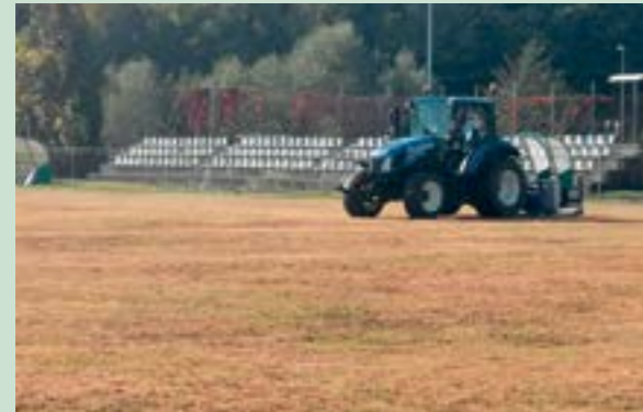
Započeli su radovi na obnovi nogometnog igrališta u Lepoglavi

Ovih su dana započeli radovi na rekonstrukciji velikog nogometnog igrališta na Sportsko-rekreativnom centru u Lepoglavi. Na igralištu će biti postavljen novi drenažni i sustav za navodnjavanje, a stari će travnjak biti zamijenjen novim.