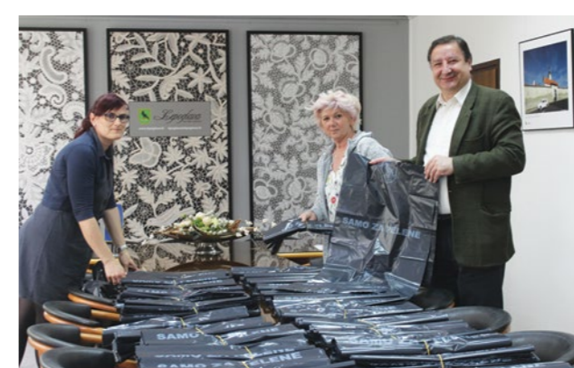
Na području Grada Lepoglave započet će odvojeno prikupljanje i zbrinjavanje iskorištenih pelena

Ovih je dana Grad Lepoglava nabavio posebne vreće u kojima će građani prikupljati iskorištene pelene. Pravo na vreće imaju obitelji s malom djecom u dobi do dvije godine ili starije dobi koja moraju koristiti pelene. Također, pravo na vreće imaju i punoljetne osobe koje moraju koristiti pelene. Građani koji zadovoljavaju ove uvjete, a korisnici su javne usluge prikupljanja miješanog komunalnog otpada, vreće će moći preuzeti u gradskoj upravi. Građani koji zadovoljavaju uvjete vezane uz djecu dobit će 12 vreća, dok će punoljetnim osobama biti dodijeljeno 15 vreća godišnje. Sve će vreće građanima biti podijeljene odjednom, za cijelu godinu. Vreće su crne boje, a odvozit će se istog dana kada i miješani