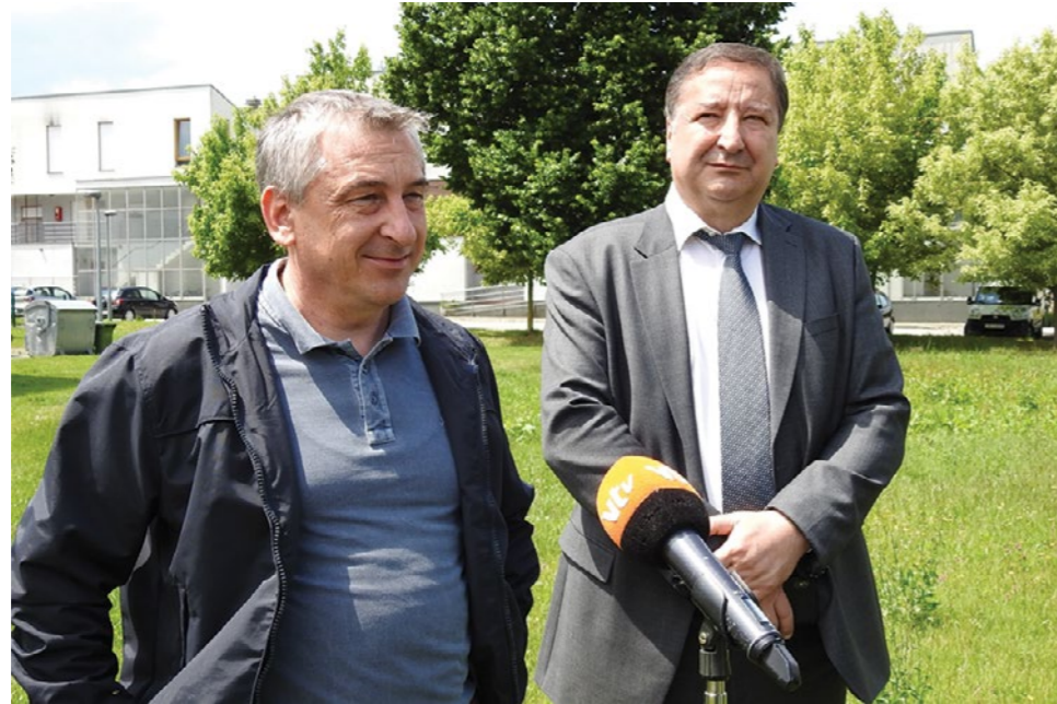
Potpredsjednik Vlade Predrag Štromar posjetio je Lepoglavu

- U tom smo cilju provodili dvije mjere - subvencioniranje stambenih kredita i društveno poticanu stanogradnju, zbog koje smo danas ovdje. Podsjetit ću da je do sada više od 13 tisuća mladih kroz našu subvencije riješilo svoje stambeno pitanje, a u tim je obiteljima do sad rođeno više od 1.500 djece. Kad tome pribrojimo mlade koji su stambeno pitanje riješili kroz program POS-a, onda možemo reći da je više od 21 tisuća obitelji ostalo živjeti, raditi i stvarati u