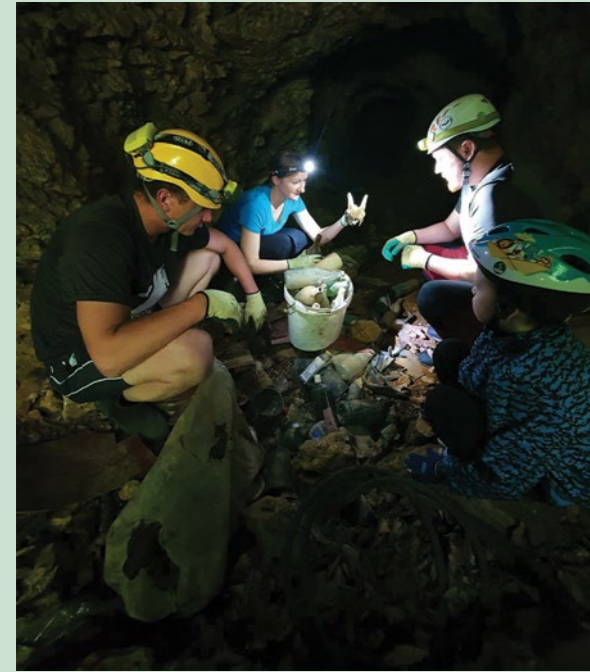
Speleolozi u akciji čišćenja podzemlja u lepoglavskom kraju

Članovi Speleološke udruge Kraševski zviru iz Ivanca organizirali su čišćenje Jelovec jame i rudnika Velika Sutinska na području Ravne gore.