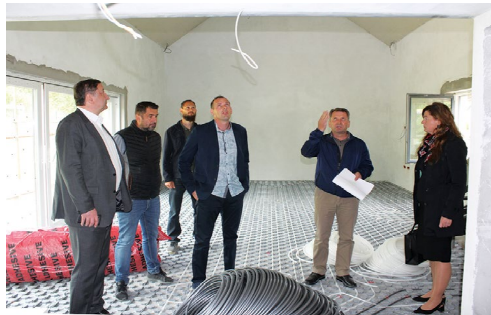
Tehnički pregled novog vrtića u Višnjici najavljen je za 15. srpnja

Ravnateljica dječjeg vrtića tom je prigodom