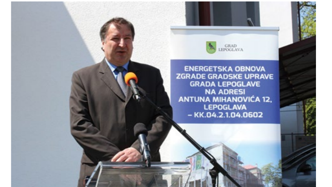
Energetska obnova zgrade gradske uprave jedan je od pedesetak projekata koji su na području Grada Lepoglave realizirani u posljednjih nekoliko godina

- Energetska obnova ovoga objekta obuhvatila je energetske obnovu toplinske ovojnice zgrade, dakle, vanjskih zidova i zidova prema tlu, toplinsku izolaciju stropova i zidova prema tavanu, zamjenu kosih krovova na zgradi gradske uprave, pri čemu je zamijenjeno i cjelokupno krovište zgrade. Tijekom obnove ugrađena je i rampa koja olakšava pristup osobama s invaliditetom i smanjene pokretljivosti. Zahvaljujući ovom projektu zamijenjen je i stari sustav pripreme potrošne vode sa sustavom koji koristi obnovljive izvore energije, jer smo ugradili i solarni sustav za grijanje vode - naglasio je Damijan Župančić, direktor TKIC-a, koji je istaknuo kako će zahvaljujući ovoj energetske obnovi potrošnja energije za grijanje zgrade gradske uprave biti na godišnjoj razini manja za čak 56 posto, emisija štetnih plinova umanjena je za više od 40 posto, a povećan je udio korištenja obnovljivih izvora energije za 18 posto. Na taj je način poboljšana i energetska