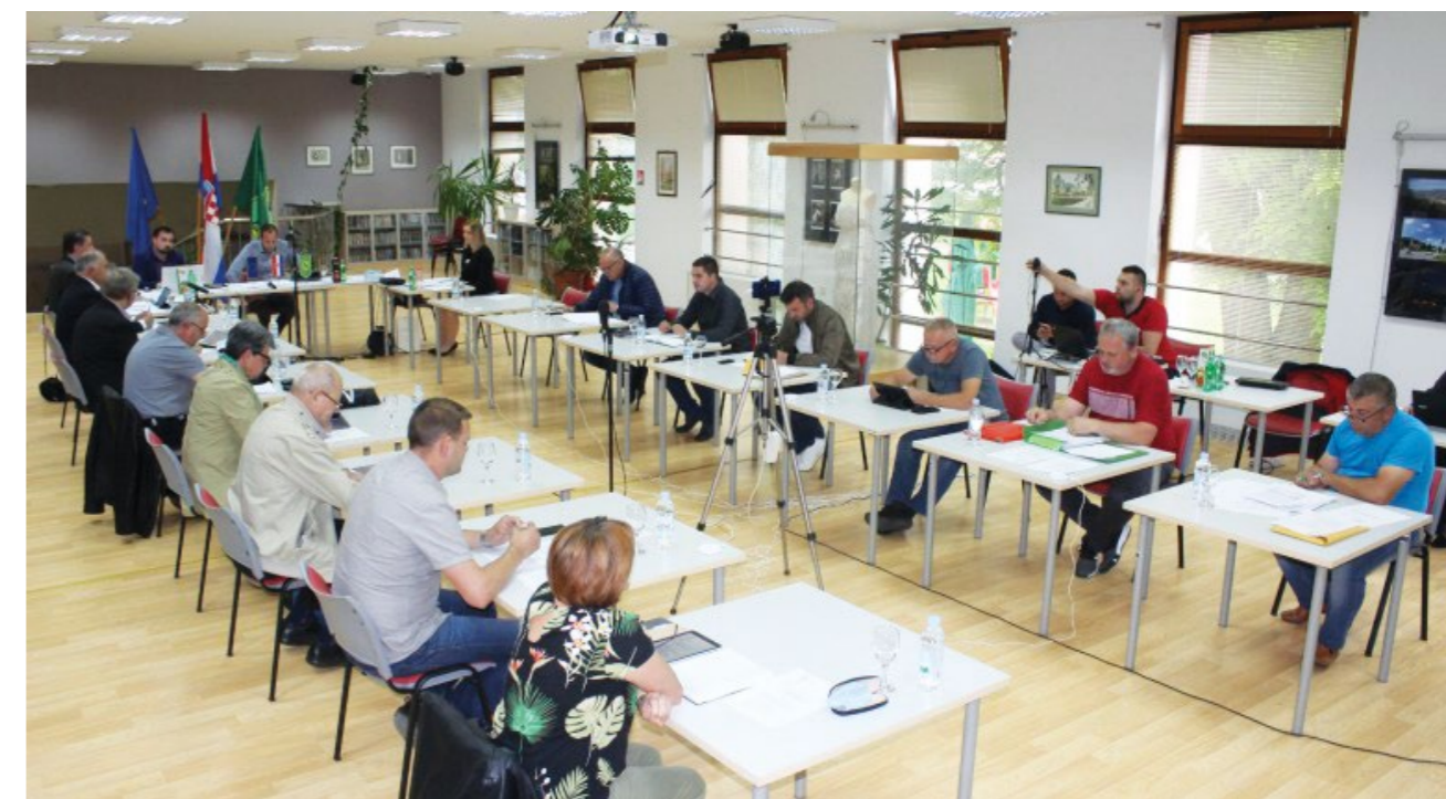
U čitaonici Gradske knjižnice održana je 22. sjednica Gradskog vijeća Grada Lepoglave

Jednoglasno su prihvaćeni prijedlozi odluka o davanju suglasnosti za sklapanje sporazuma o