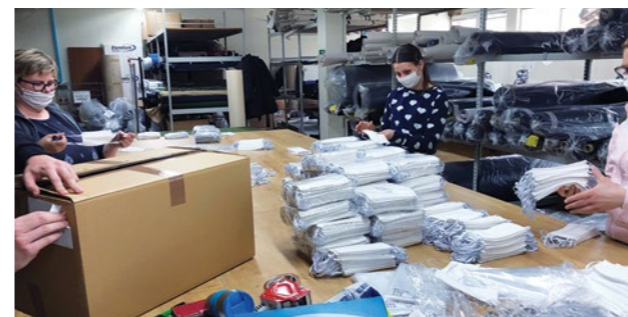
U pogonima lepoglavskih tvrtki sašiveno je više od 2.000 zaštitnih maski

jednice Grada Lepoglave, u sklopu svojih redovnih zadataka patroliranja ulicama i naseljima na širem gradskom području. Na taj način građani nisu bili izloženi nepotrebnim izlascima.