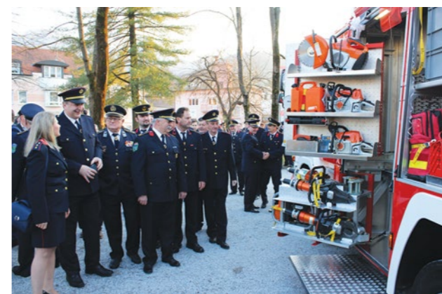
Grad Lepoglava ulaže u nabavu nove vatrogasne opreme koja će vatrogascima omogućiti još veću operativnost

- Ispred Grada Lepoglave i u svoje osobno ime želio bih svim vatrogascima, a posebice vatrogascima iz dobrovoljnih vatrogasnih društava koja djeluju na području Grada Lepoglave, uputiti VELIKO HVALA na svemu što čine za građane i naš grad. Iako je mjesec svibanj, i blagdan njihova nebeskog zaštitnika - svetog Florijana, vrijeme kada se uobičajeno vatrogascima upućuju čestitke i zahvale, mi u Gradu Lepoglavi činimo to tijekom cijele godine. Naime, vatrogasci su svih dana u godini zalag sigurnijeg života u našem gradu, spremni da u svakom trenutku budu na pomoć svim građanima. Posebno zahvaljujem našim vatrogascima koji su bili uključeni u provedbu svih aktivnosti našeg Stožera civilne zaštite u provođenju protuepidemijskih