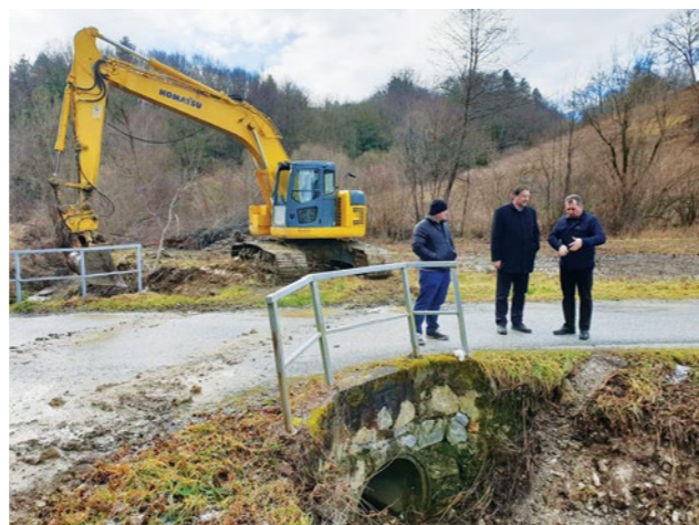
Program sanacije provodi se u suradnji s mjesnim odborima

Ceste život znače, a mi na lokalnoj razini znamo koliko su građanima važne lokalne ceste koje im omogućavaju dolazak do njihovih kuća i posjeda. Zbog toga, uz razvoj lokalne cestovne infrastrukture, odnosno izgradnju novih prometnica, vodimo brigu i o održavanju stotinu kilometara nerazvrstanih cesta na cijelom gradskom području, kako bi građanima omogućili punu mobilnost. Svake godine