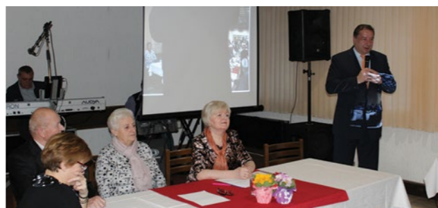
Rad Udruge pohvalio je gradonačelnik Marijan Škvarić

Dio članstva je i proteklo godine sudjelovao na sportskim susretima umirovljenika Varaždinske županije te na proslavi koju je u Varaždinu organizirao Savez udruga umirovljenika Varaždinske županije. Udruga je obilježila i Dan starijih osoba u Dječjem vrtiću Lepoglava, a nastavljeno je okupljanje i druženje članova u prostoru Udruge u Lepoglavi, gdje ih jednom mjesečno posjećuje patronažna sestra koja im mjeri tlak i šećer u krvi. Brinući o zdravlju