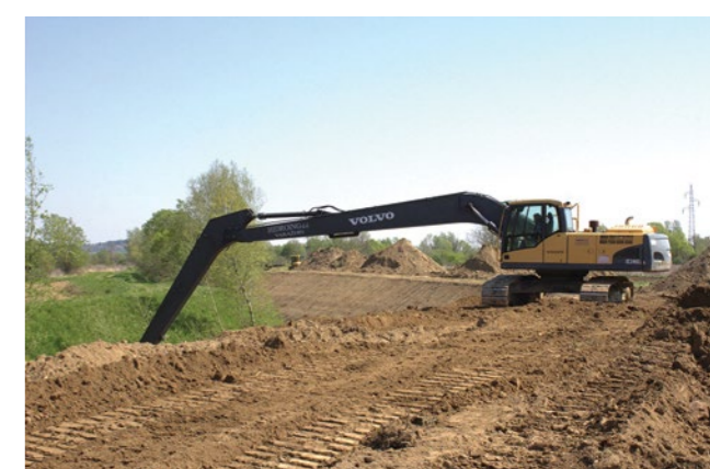
Uređenjem vodotoka značajno je smanjena opasnost od poplava

U okviru tih zahvata uredili su vodotoci potoka na području Kameničkog Podgorja, Lepoglavske Vesi, na području mjesnog odbora Lepoglavske Vesi i Vulišinec-Viletinec, na području zvanom Dunaj te u Sestrancu i Žarovnici.