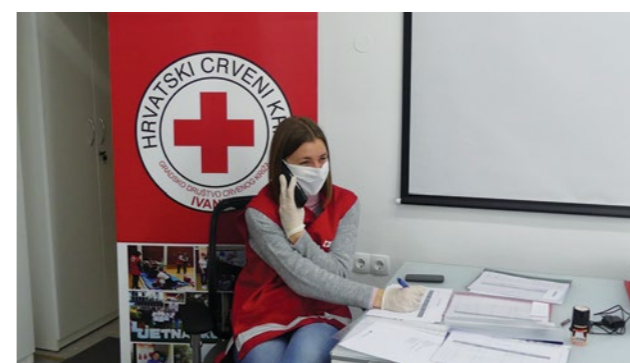
Volonteri Crvenog križa predano su se uključili u borbu s posljedicama epidemije

nizirali smo i pomoć za starije i bolesne, kao i za osobe kojima je bila propisana mjera samoizolacije. Uveli smo i posebnu telefonsku liniju te adresu elektronske pošte za naše građane, koja je bila vrlo aktivna. Stožer je zaprimio 2.673 telefonska poziva te 1.360 mailova. Veliki dio našeg