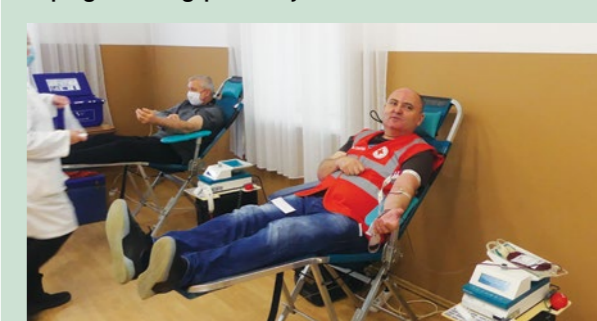
U Lepoglavi su nedavno održane dvije akcije dobrovoljnog darivanja krvi u kojima je prikupljeno stotinu doza krvi

Gradsko društvo Crvenog križa Ivanec je u suradnji s aktivom Dobrovoljnih darivatelja krvi iz Lepoglave organiziralo 24. ožujka akciju dobrovoljnog darivanja krvi za građane šireg lepoglavskog područja.