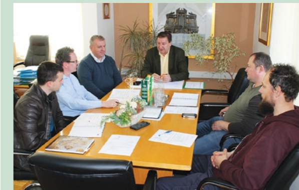
Cilj je da sva kućanstva i poslovni subjekti na cijelom gradskom području imaju kvalitetnu i sigurnu opskrbu električnom energijom

ske Elektre Zdenko Đula potvrdio je da je u planovima HEP-a u 2020. godini provode nje zahteva na rekonstrukciji niskonaponske mreže na području Sestranca i Crkovca te u naselju Breški i Vinogradskoj ulici u Lepoglavskoj Vesi. Istaknuo je i da je velikim ulaganjima u izgradnju najmodernije niskonaponske mreže riješen dugogodišnji problem opskrbe električnom energijom na području Višnjice.