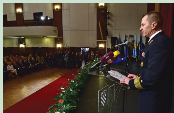
Viceadmiral Robert Hranj imenovan je na dužnost načelnika Glavnog stožera Oružanih snaga Republike Hrvatske

što je to činio i dosad, uspješno odgovori na sve izazove koje donosi ova zahtjevna dužnost - poručio je u čestitki novom načelniku Glavnog stožera Oružanih snaga Republike Hrvatske gradonačelnik Marijan Škvarić.