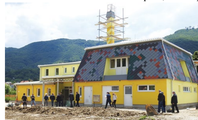
Tijekom posjete Lepoglavi potpredsjednik Vlade Štromar se uvjerio da radovi na uređenju dječjeg vrtića izvrsno napreduju

Hrvatskoj. Ponosan sam na sve koji su sudjelovali u tim programima i sretan zbog građana kojima smo pomogli - rekao je potpredsjednik Štromar.