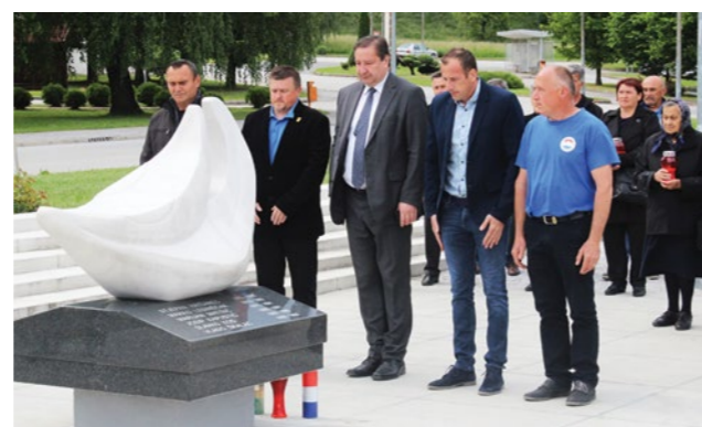
Počast poginulim hrvatskim braniteljima odana je i u Parku hrvatskih branitelja