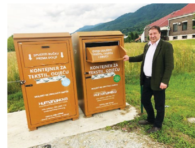
Novi spremnici za otpadni tekstil postavljeni su na četiri lokacije na području Grada Lepoglave

Postavljanjem spremnika za tekstil Grad Lepoglava osigurava uvjete za selektivno odlaganje svih vrsta otpada, u skladu sa zakonskim propisima. Uz spremnike na javnim površinama planira se za potrebe višestambenih zgrada postaviti i 26 spremnika za plastiku te isto toliko spremnika za papir, a višestambene zgrade dobit će i spremnike za odlaganje biootpada