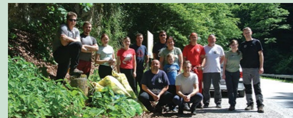
Speleolozi su se u akciji pridružili i vatrogasci te članovi HGSS-a

Kako bi podigli ekološku svijest građana, Speleološka udruga Kraševski viri organizirat će i predavanje o važnosti zaštite podzemlja.