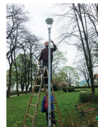
U gradskom parku postavljena je nova javna rasvjeta

- Postavljanjem novih rasvjetnih tijela Grad Lepoglava je uspješno priveo kraju prvu fazu uređenja središnjeg grad-