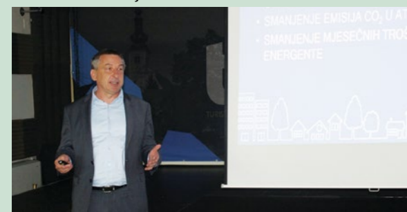
Predrag Štromar, potpredsjednik Vlade u Lepoglavi je predstavio Program energetske obnove obiteljskih kuća

Za provedbu Programa energetske obnove obiteljskih kuća zadužen je Fond za zaštitu okoliša i energetske učinkovitost.