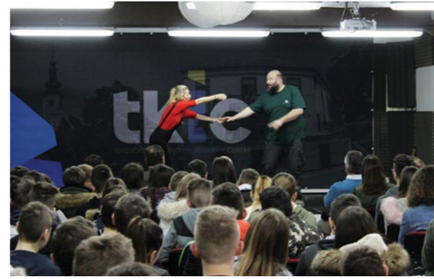
Predstava - Reci drogi - NE, pobudila je veliko zanimanje učenika viših razreda osnovnih škola