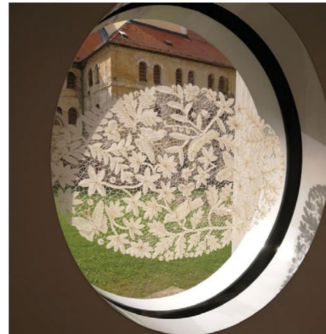
Priče iz Lepoglave bit će predstavljene i djeci iz Italije i Malte

Tako će lepoglavska čipka, UNESCO-va nit koja je spojila Lepoglavu s brojnim državama i kontinentima, kao i popularna bajka „Čipkarice i zmaj“ - priča iz Lepoglave, svoju promociju doživjeti na međunarodnoj razini u svijetu mladih, upravo kroz implementaciju ovog projekta. Preduvjeti za to stvoreni su na bilateralnom sastanku u siječnju, kada je zamjenik gradonačelnika boravio na Malti, gdje se susreo s budućim partnerima iz grada Senglea, koji također sudjeluje u ovom projektu.