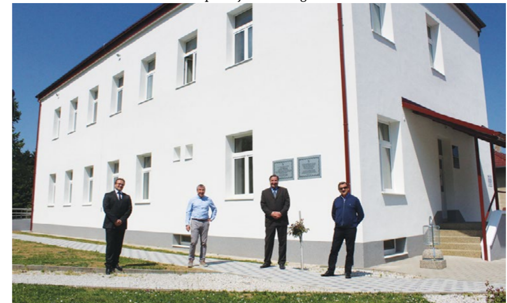
Projekt energetske obnove zgrade gradske uprave vrijedan je 1,2 milijuna kuna

Sjever Hrvatske, iako je imao odlične projekte, dobivao je najmanje novca. Ispravili smo tu nepravdu. Samo za projekte u Varaždinskoj županiji Ministarstvo je dalo više od pola milijarde kuna! Želim čestitati Gradu Lepoglavi i gradonačelniku Marijanu Škvariću na toliko uspješnih projekata - poručio je Predrag Štromar, potpredsjednik Vlade Republike Hrvatske