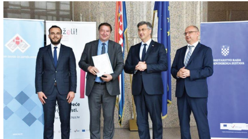
Gradonačelnik Marijan Škvarić na potpisivanju ugovora u Nacionalnoj i sveučilišnoj knjižnici u Zagrebu

Gradonačelnik Marijan Škvarić potpisao je u Zagrebu Ugovor o dodjeli bespovratnih sredstava za projekte koji se financiraju iz Europskog socijalnog fonda u financijskom razdoblju 2014. - 2020. Ugovor se odnosi na projekt - Zaželi bolji život u Lepoglavi i Klenovniku, za čiju je realizaciju Gradu Lepoglavi dodijeljeno više od 524 tisuće kuna bespovratnih sredstava.