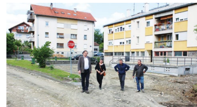
Radovi na uređenju centra Lepoglave rezultat su dobre suradnje Grada i Mjesnog odbora Lepoglava

nja planiranih radova utjecat će recesija uzrokovana pandemijom koronavirusa, no u planu je da radovi ipak budu završeni tijekom ove i sljedeće godine.