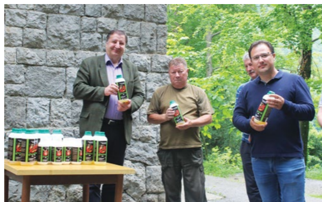
Donacijom repelena nastavljen je dobra suradnja Grada i lovačkih udruga

situacije vezane uz divlje životinje moraju prijaviti stručnim službama Grada Lepoglave na brojeve telefona - 770-413 ili 099/2770-413, odnosno na adresu elektroničke pošte: zastita.divljaci@lepoglava.hr .