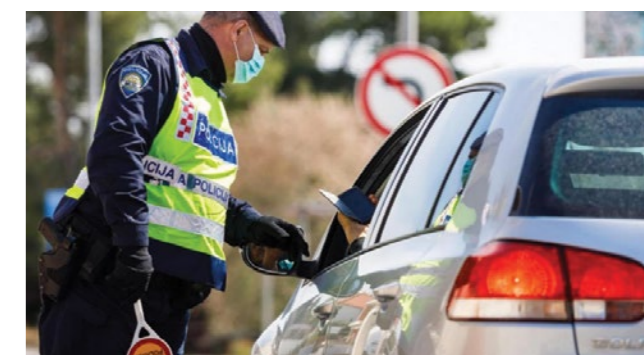
Stožer je izdao 500 tiskanih te 1.516 e-propusnica

Stožer je posebnu pozornost posvetio i informiranju građana o