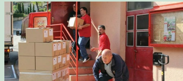
Pakete Crvenog križa dobilo je 59 obitelji s lepoglavskog područja