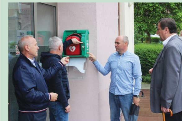
Grad Lepoglava kontinuirano ulaže i u bolju zdravstvenu skrb na svom području

Grad Lepoglava je s 4.500 kuna pomogao nabavu reanimacijske torbe s EKG uređajem i pripadajućom opremom koju će koristiti ekipe hitne službe stacionirane u Domu zdravlja u Ivancu, a koje pokrivaju i područje Grada Lepoglave.