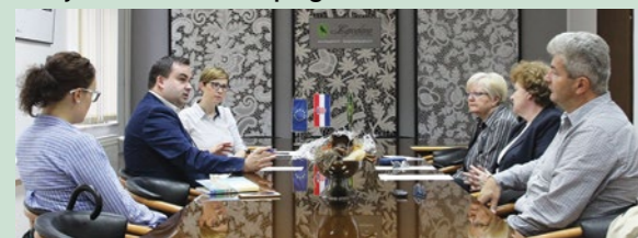
Članovi Savjeta za socijalnu politiku predstavili su brojne aktivnosti

Provedene ali i buduće aktivnosti i programi iz domene socijalne politike bili su na dnevnom redu sjednice Savjeta za socijalnu politiku Grada Lepoglave, čiji su se članovi početkom ožujka sastali u Lepoglavi.