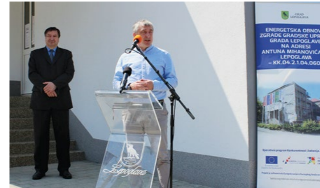
Potpredsjednik Štromar je iz Lepoglave poručio kako će se i dalje snažno zalagati za dobre projekte u ovom dijelu Hrvatske

U Lepoglavi je predstavljen projekt energetske obnove zgrade gradske uprave Grada Lepoglave, vrijedan milijun 215 tisuća i 974 kune, koji je sufinanciran iz Operativnog programa Konkurentnost i kohezija Europskog fonda za regionalni razvoj.