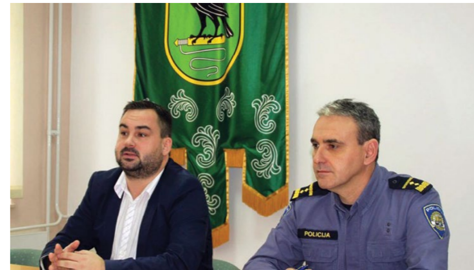
Stožer civilne zaštite Grada Lepoglave odgovorno je i vrlo uspješno proveo niz aktivnosti u vrijeme borbe protiv koronavirusa

nizirali smo i pomoć za starije i bolesne, kao i za osobe kojima je bila propisana mjera samoizolacije. Uveli smo i posebnu telefonsku liniju te adresu elektronske pošte za naše građane, koja je bila vrlo aktivna. Stožer je zaprimio 2.673 telefonska poziva te 1.360 mailova. Veliki dio našeg