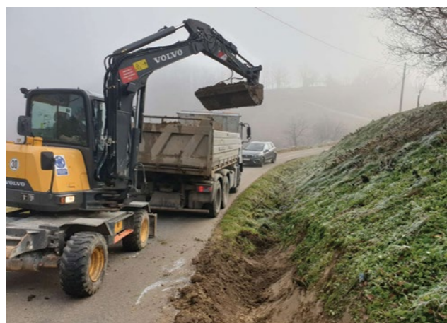
Ovoga proljeća sanirani su novi kilometri nerazvrstanih cesta na cijelom području Lepoglave

Radove na sanaciji koji se provode u okviru programa održavanja nerazvrstanih cesta izvodi domaća tvrtka - TTTG iz Višnjice.