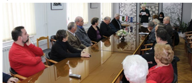
U Lepoglavi je održana skupština Udruge antifašističkih boraca i antifašista

važnosti antifašističke borbe i doprinosu pripadnika NOB-a u borbi protiv svjetskog zla - istaknuo je Kovač dodavši da je u Lepoglavi za vrijeme 2. svjetskog rata postojao ustaški logor u kojem su ubijani ljudi što se ne smije zaboraviti.