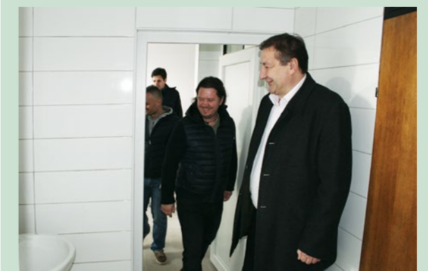
U svlačionicama je ugrađena nova sanitarna instalacija, postavljene su pločice te je obnovljen inventar

Zahvale sponzorima, a posebice Gradu Lepoglavi i Županijskom nogometnom savezu, koji su prepoznali potrebe lepoglavskih nogometaša i nogometašica, uputio je Tonko Županić , predsjednik Zajednice sportskih udruga Grada Lepoglave.