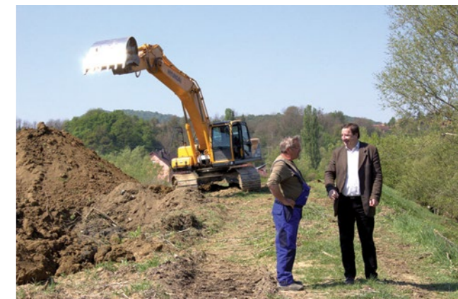
Uređenjem vodotoka bit će spriječeno razlijevanje rijeke Bednje

Prijašnjih smo godina na Dan planeta Zemlje, u suradnji s Pčelarskom udrugom Čmalico, dijelili sadnice medonosnih stabala, što ove godine zbog epidemiološke situacije nismo mogli učiniti. No, to nas nije spriječilo da ovaj dio Lepoglave ople-