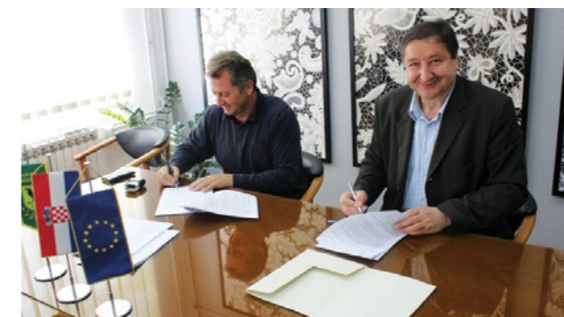
Potpisani ugovor za sanaciju dvaju klizišta u Lepoglavi vrijedan je milijun i 617 tisuća kuna

Grad Lepoglava je za sanaciju ovih dvaju klizišta ostvario potporu Hrvatskih voda u visini od 70 posto vrijednosti radova