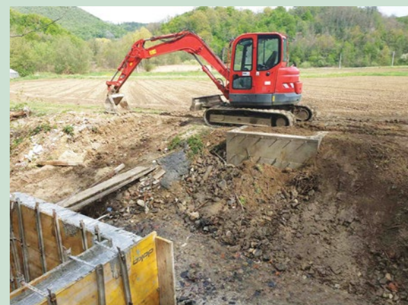
Ministarstvo graditeljstva i ove godine podržalo program sanacije nerazvrstanih cesta na području Lepoglave

Ministarstvo graditeljstva i prostornoga uređenja dodijelilo je Gradu Lepoglavi potporu u visini od 168 tisuća kuna za projekt modernizacije nerazvrstanih cesta na području Grada Lepoglave u 2020. godini.