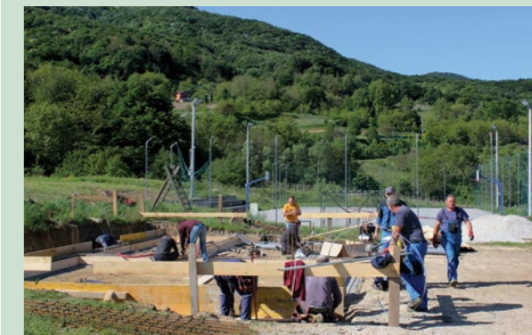
Radovi na izgradnji novoga društvenog doma u Lepoglavskoj Vesi izvršno napreduju

Radovi na gradnji društvenog doma u Lepoglavskoj Vesi vrijedni su oko 360 tisuća kuna, a Grad Lepoglava ih je povjerio tvrtki TTTG iz Višnjice.