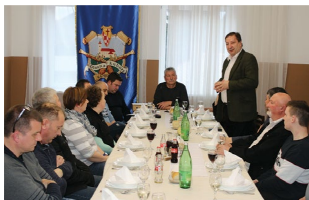
Članovi Udruge na nastupima promoviraju Lepoglavu i njenu bogatu baštinu

Ovogodišnji međunarodni festival ući će tako u povijest čipkarskih festivala u Lepoglavi kao prvi virtualno održani festival.