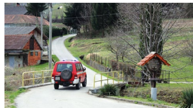
Tijekom krize vatrogasci su s uspjehom proveli 101 aktivnost, za koje su utrošili 1.804 radnih sati

- Stožer je svoje aktivnosti provodio primarno u interesu zdravlja i sigurnosti svih građana. U početku krize i provedbe protuepidemijskih mjera bili smo fokusirani na provođenje zabrane održavanja svih javnih događanja i okupljanja te poštivanja mjera socijalnog distanciranja, kao i pojačanih higijenskih i dezinfekcijskih mjera. No, već 20. ožujka orga-