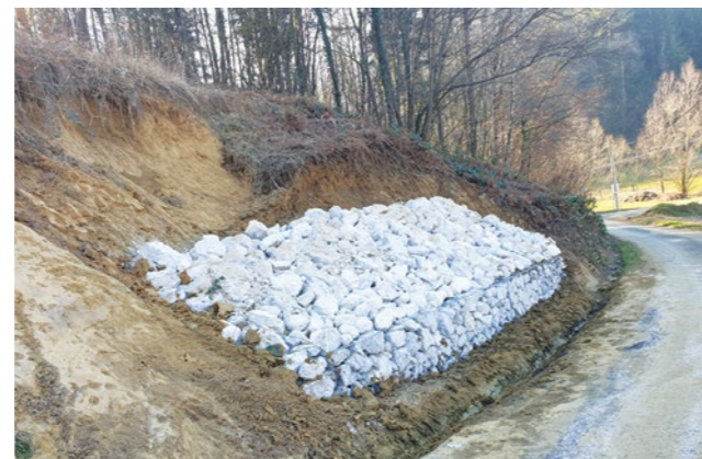
U program sanacije Grad je ove godine uložio milijun kuna

Uz održavanje i popravke asfaltiranih i makadamskih kolnika, izvode se i radovi na održavanju objekata cestovne odvodnje i opreme,