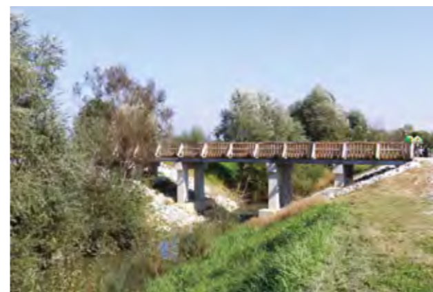
Saniran je drveni most Putine na rijeci Bednji

Ove su godine nabavljena i nova dječja igrala u Žarovnici, gdje je uređen i ograđen prostor za igru djece, u neposrednoj blizini sportskog igrališta, u što je Grad uložio ukupno 8 tisuća eura.