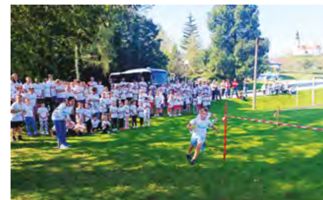
Priredba je održana pod motom „#BeActive“

U programu ovogodišnjeg Europskog tjedna sporta, koji je organizirala Zajednica sportskih udruga Grada Lepoglave, sudjelovalo je više od tisuću sudionika, djece i mladih, koji su trčali, vježbali na spravama, igrali tenis, vozili bicikle ili pješačili. Djeca predškolskog i osnovnoškolskog uzrasta su tijekom Europskog tjedna sporta bila praćena, testirana i usmjeravana na aktivno bavljenje sportom u sportskim klubovima. Važan dio ovoga projekta bila je i edukacija, propagiranje zdrave