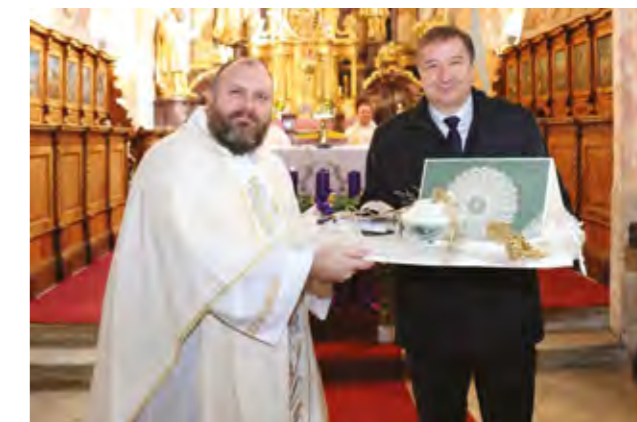
Povodom Dana Grada Lepoglave služena je i sveta misa u lepoglavskoj župnoj crkvi

sti poginulim braniteljima i preminulim građanima Grada Lepoglave, a nastavljeno misnim slavljem u župnoj crkvi u Lepoglavi.