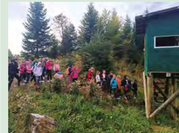
Na izletu su djeca učila i kako se ponašati u šumi i na planini

Ovaj je izlet, koji su pomogli i Zajednica sportskih udruga Grada Lepoglave te vatrogasci iz Lepoglave i Kamenice, odličan je primjer kako djecu potaknuti na aktivnosti u prirodi - te kako ih zainteresirati za očuvanje bioraznolikosti našeg kraja.