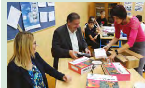
Učenici su dobili nove mjerne instrumente

- Ove donacije dio su potpora kojima Grad Lepoglava sustavnu i kontinuirano pomaže provedbu obrazovnih aktivnosti i procesa u svim osnovnim školama s gradskog područja - istaknuo je gradonačelnik Lepoglave Marijan Škvarić na prezentaciji nabavljenih uređaja i provedbe GLOBE programa u ovoj osnovnoj školi.