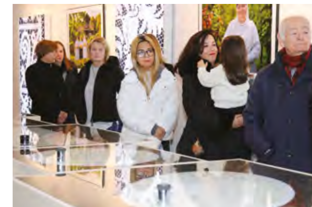
Izložbe su pobudile veliko zanimanje likovne publike

ciju i modernu tehnologiju, našu prošlost i budućnost koju ćemo s drugima podijeliti zahvaljujući ovom prostoru koji će, iako je relativno malen, imati veliki značaj jer će biti centar