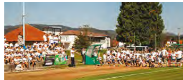
U programu Europskog tjedna sporta ove je godine sudjelovalo više od tisuću djece i mladih

Organizatori su istaknuli da je do sada, u obilježavanje Europskog tjedna sporta na području Grada Lepoglave bilo uključeno više od devet tisuća sudionika.