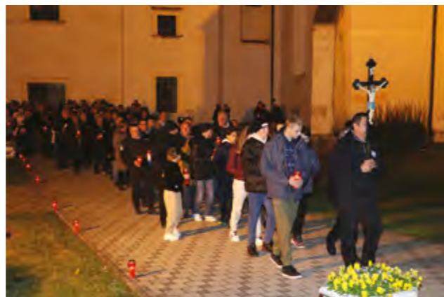
Kolonom sjećanja odana je počast žrtvama Domovinskog rata