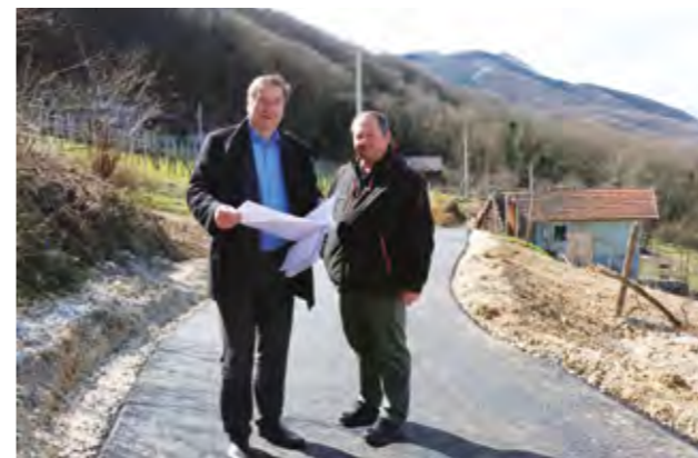
Na području Lepoglave ostvarena su rekordna ulaganja u komunalnu infrastrukturu

Hrvatske. Radovi su bili vrijedni gotovo 45 tisuća eura, a Ministarstvo kulture i medija ovaj je projekt sufinanciralo s 13 tisuća i 272 eura, dok je ostatak sredstava osigurao Grad Lepoglava.