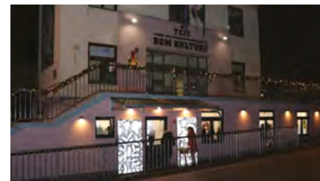
Lepoglava je dobila novi i moderno opremljeni galerijski centar

Galerija će biti središnje mjesto za kulturnu interakciju naše zajednice.