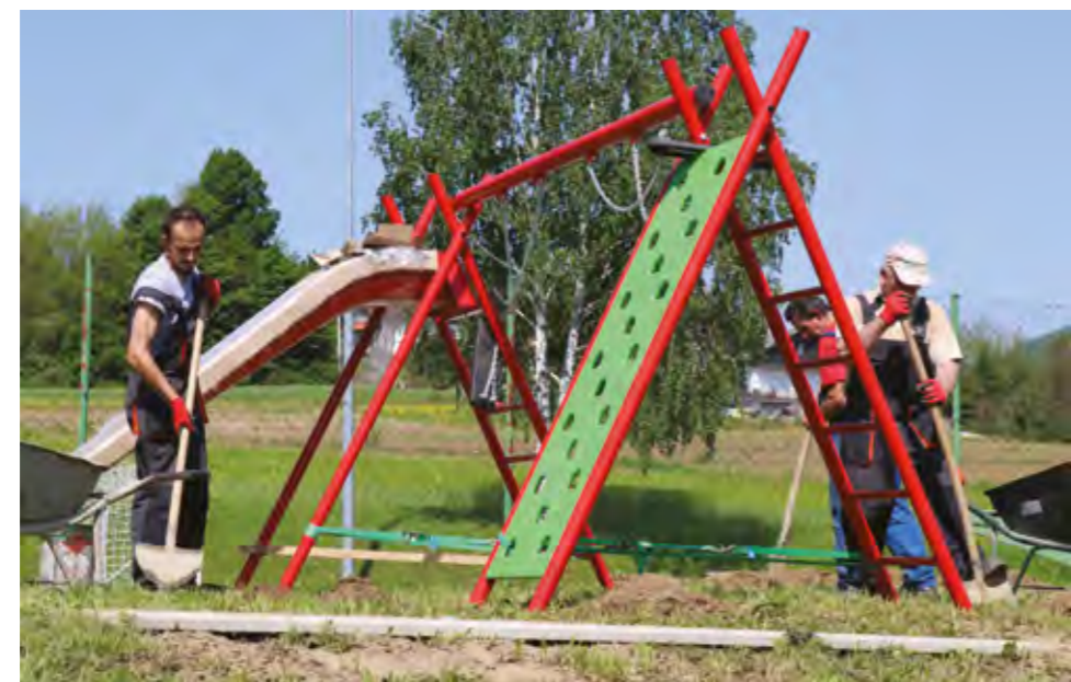
Ove su godine nabavljena i nova dječja igrala u Žarovnici

U Domu kulture u Lepoglavi nedavno je završila i druga faza uređenja nove galerije. Sredstva za uređenje i opremanje galerijskog prostora Grad Lepoglava je osigurao na natječaju Ministarstva kulture i medija Republike