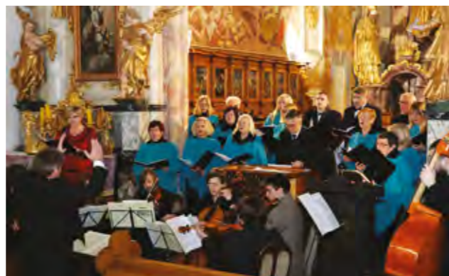
Koncert Kapele Pauline Warasdin u župnoj crkvi u Lepoglavi

su skladbe Vivaldija, Bacha, Händela i Lukačića.