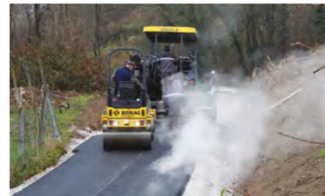
Radovi su izvedeni na sedam dionica na području šest mjesnih odbora darskim djelatnostima. Uz iz fondova Europske unije - cestovnu, ali i drugu komunalnu infrastrukturu koju naglasio je gradonačelnik Marijan Škvarić.

smo izgradili, stvorili smo kvalitetne uvjete za život građana koje želimo zadržati na području Grada Lepoglave. I u ovom slučaju činimo to koristeći sredstva