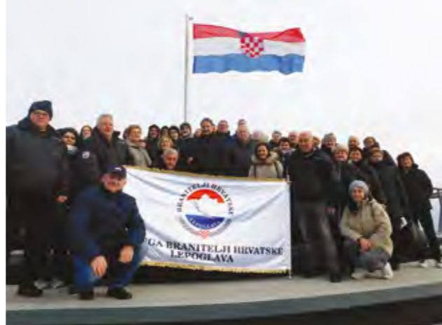
U Gradu Heroja odana je počast žrtvi Vukovara

ju na grobljima u Lepoglavi i Kamenici, kao i patnju svih ostalih poginulih, zatočenih i nestalih u Vukovaru i Škabrnji - poručili su iz Udruge branitelji Hrvatske Lepoglava.