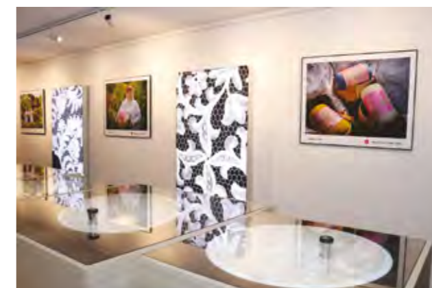
U novoj galeriji otvorene su dvije atraktivne izložbe

Izložba „Xiaomi 13T serije i lepoglavske čipke“ za razgled ostati postavljena do kraja godine, dok će izložbu Profinjenosti niti - pogled na lepoglavsku čipku kroz povećalo, posjetitelji moći razgledati do sljedećeg festivala čipke.