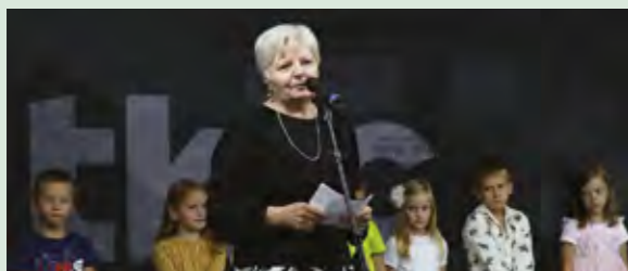
U Lepoglavi je obilježen Dan starijih osoba

Dijelite radost i iskustva, budite i dalje podrška jedni drugima - poručio je gradonačelnik Škvarić .