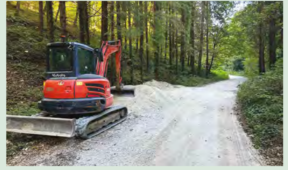
Sanirana je i cesta na Ravnoj gori

timo. Buduće tekuće održavanje sada će biti jednostavnije. Grad Lepoglava će brinuti da potencijal Ravne gore bude dostupan u punoj mjeri - istaknuo je nakon provedene sanacije gradonačelnik Marijan Škvarić.