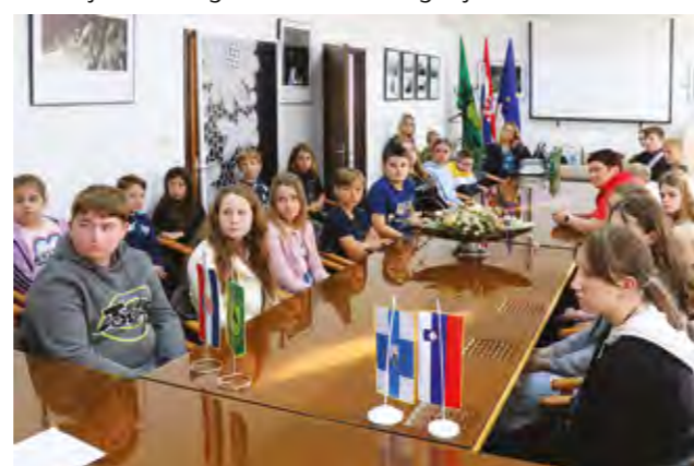
Sjednica Dječjeg gradskog vijeća održana je u gradskoj vijećnici

Dječje gradsko vijeće Grada Lepoglave konstituirano je 2021. godine, kao predstavničko tijelo djece s gradskog područja, kako bi i najmlađi mogli aktivno sudjelovati u životu Grada, te u praksi učiti o demokraciji.