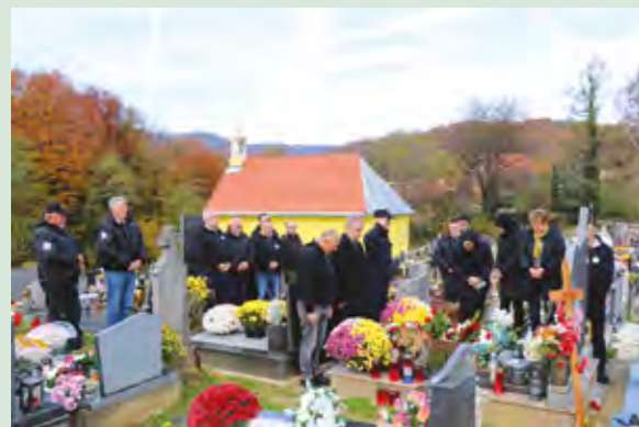
Branitelji Vukovara bili su istinski heroji