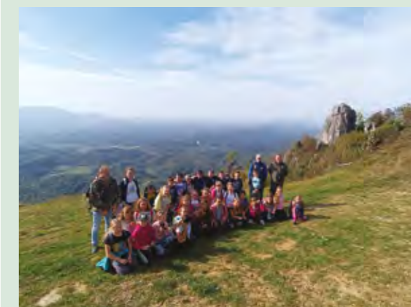
Učenici osnovne škole iz Lepoglave jedan su nastavni dan proveli na Ravnoj gori

Učenici trećeg razreda Osnovne škole Ante Starčevića iz Lepoglave iskoristili su neobično lijepo vrijeme za kraj listopada pa su jedan nastavni dan proveli na prekrasnoj Ravnoj gori, zajedno s lovcima i planinarima.