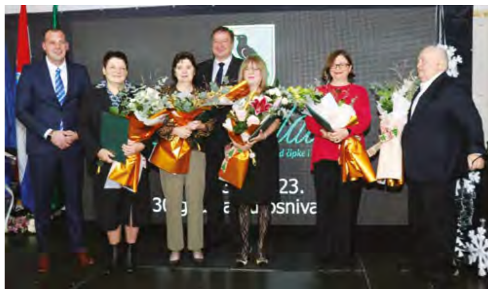
Dobitnici ovogodišnjih priznanja za doprinos ugledu i promociji Grada Lepoglave u zemlji i inozemstvu

Na svečanoj sjednici prikazan je i film kojim su dokumentirane značajnije aktivnosti i projekti koji su provedeni u Gradu Lepo-