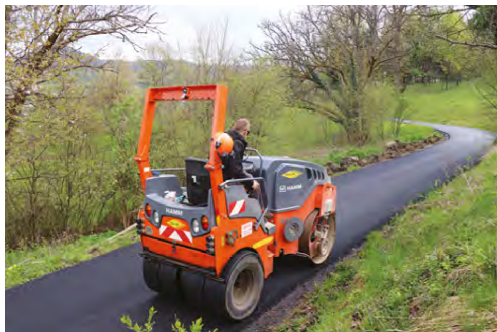
Sanirane su prometnice i na području Višnjice

nih cesta u dužini od oko 10 kilometara. Klizišta su sanirana na nerazvrstanoj cesti u Ulici Augusta Šenoae, na lokaciji Gaveznic - Kameni vrh, na nerazvrstanoj cesti u Muričevcu, zatim na nerazvrstanoj cesti Pošnjaki, u zaseoku Lepoglavska Ves te na nerazvrstanoj cesti u Očuri. Ovim sanacijama spriječena je daljnja devastacija prometnica i okolnog područja, a osigurana je i stabilnost terena, čime je bitno smanjena ugroza za ljude koji žive na tom području te za njihovu imovinu. Spriječena je i daljnja erozija na čak 11 prometnica na području Donje Višnjice, Gornje Višnjice, Bednjice, Zalužja i Zlogonja, u ukupnoj dužini od 10 kilometara. Vrijednost ovih radova, kojima je osigurano dugoročno i kvalitetno korištenje prometnica nužnih za razvoj i normalno funkcioniranje ovih naselja, iznosila je više od milijun i 158 tisuća eura. Sa zadovoljstvom stoga mogu reći da smo ove godine ostvarili rekordna ulaganja u komunalnu