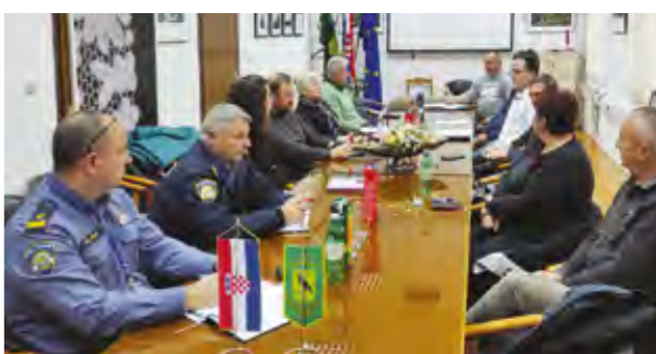
Na sjednici Vijeća najavljene su i predstojeće preventivne aktivnosti