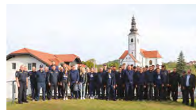
Sudionici ovogodišnjeg Memorijala Darko Komes

- Vatrogasci moraju imati želju, znanje i vještine da bi mogli pružiti pomoć građanima, što vi nesumnjivo imate. Također, potrebni su vam i uvjeti i oprema, o čemu Grad Lepoglava itekako brine. Ovu svoju važnu