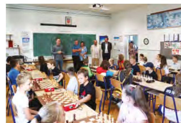
U osnovnoj školi u Lepoglavi održan je turnir u šahu

Igranje šaha izvrsna je nadogradnja procesu stjecanja znanja i drugih vještina važnih za razvoj djeteta - poručio je tom prigodom gradonačelnik Škvarić .