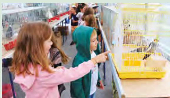
Djeca su uživala na izložbi malih životinja

Izložbu su vrtićki mališani razgledali s svojom omiljenom životinjom. Desetak izloženih malih životinja.