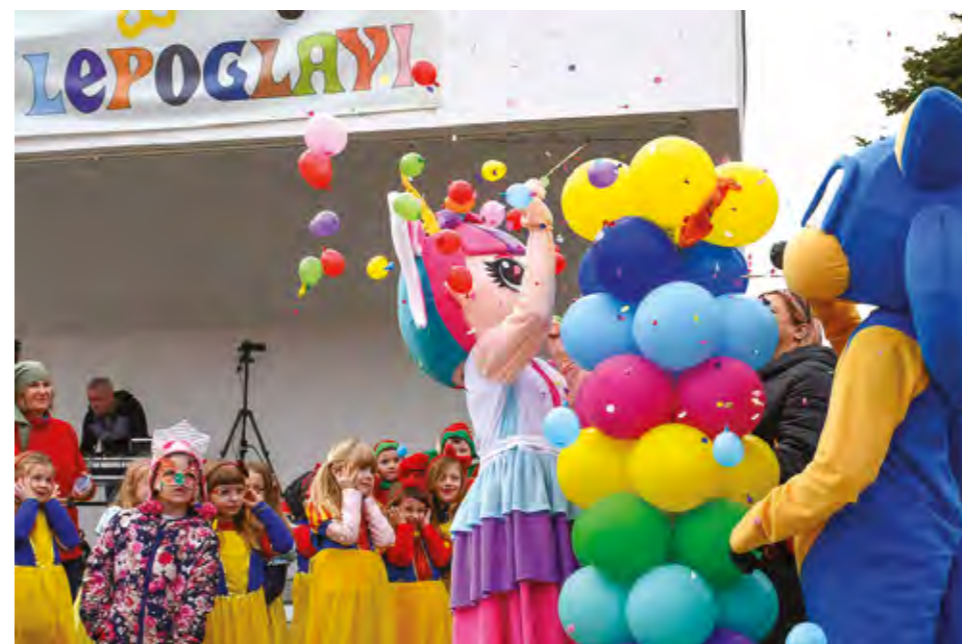
Zima je otjerana na originalni način