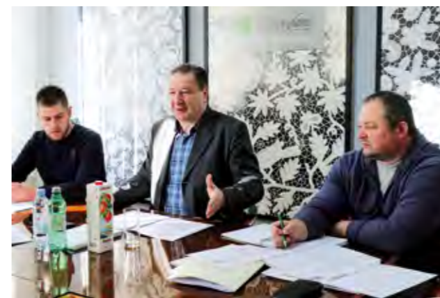
Predsjednici mjesnih odbora na sastanku s gradonačelnikom Lepoglave

Na sastanku je još jednom istaknuto da je komu-