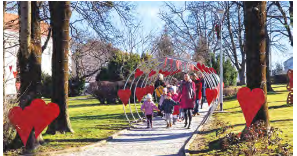
U gradskom parku Valentinovo su proslavili lepoglavski mališani

Smijeh, veselje i radost ispunili su na Valentinovo gradski park u Lepoglavi.