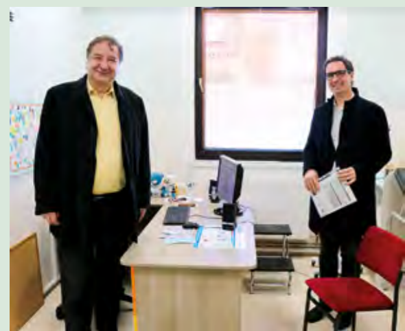
Grad Lepoglava i Dom zdravlja Varaždinske županije zajednički će financirati i nabavu nove opreme za pedijatrijsku ambulantu

Pedijatrijska ambulanta Doma zdravlja u Lepoglavi ponovno je spremna primiti male pacijente.