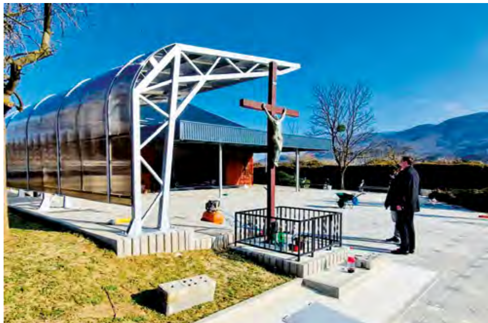
Završen je projekt uređenja groblja u Lepoglavi

- Ovih smo dana dobili uporabnu dozvolu za projekt uređenja groblja u Lepoglavi, čime smo završili taj projekt koji je s 38 tisuća eura sufinanciran sredstvima koje smo dobili na natječaju Lokalne akcijske grupe Sjeverozapad za Mjenu 7.4. Uredili smo grobnu kuću, njeno krovništvo i fasadu, te okolišne grobne kuće - terasu i pristupne puteve, a postavili smo i dvije velike nadstrešnice, koje će štiti od kiše, ali i od jakog sunca. Zahvaljujući izvrsnoj suradnji Grada Lepoglave s Hrvatskim vodama završen je i projekt uređenja potoka u Ulici Patačić, koji je obuhvatio uređene obale tog potoka - bujičara i propusta, a zahvaljujući tom projektu proširena je i prometnica. Taj je projekt nastavak suradnje s Hrvatskim vodama, koje su puno radile na našem području, kako na uređenju potoka - bujičara, tako i na uređenju vodotoka rijeke Bednje.