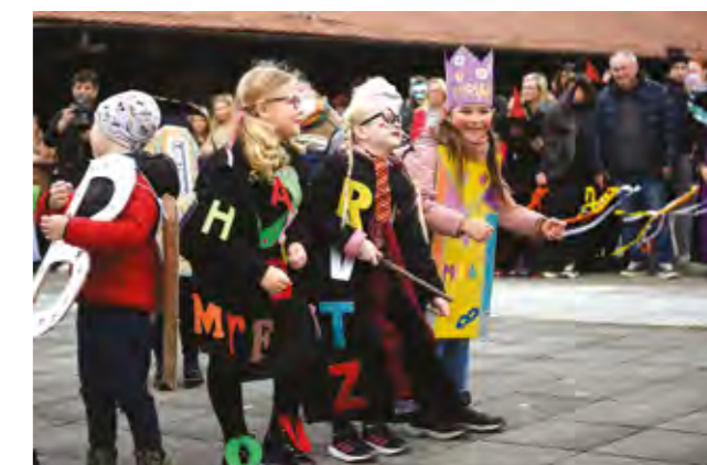
U fašničkom programu bili su i - Abecedići

Dječji fašnik u Lepoglavi održan je u organizaciji Turističke zajedni-