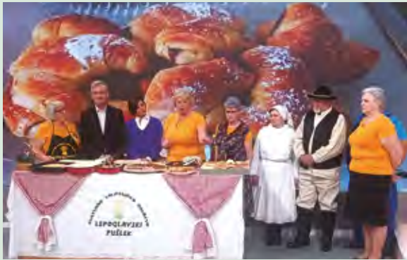
Pušleki su nastupili u rado gledanoj emisiji Hrvatske radiotelevizije

Uz tradicionalna jela Pušleki su u ovoj gledanoj televizijskoj emisiji predstavili i druge aktivnosti KUD-a, pa su izveli i skeč na lepoglavskom govoru.