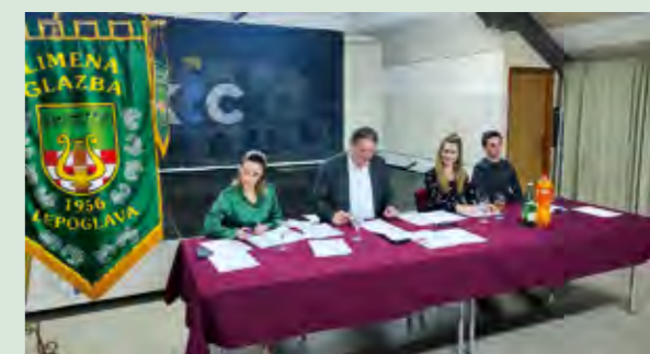
Limena glazba Lepoglava održala je godišnju skupštinu

Članovi Limene glazbe Lepoglava održali su u lepoglavskom TKIC-u 23. veljače, izvještajnu sjednicu skupštine, na kojoj su istaknute njihove brojne aktivnosti.