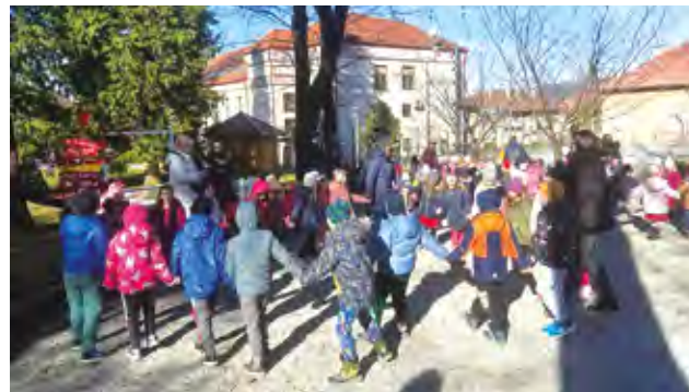
Kada se ftiček ženi uvijek je veselo

Na proslavi Valentinova u gradskom parku u Lepoglavi mališanima se pridružio i gradonačelnik Marijan Škvarić , koji im je zaželio da upravo ljubav bude vodilja u njihovim životima.