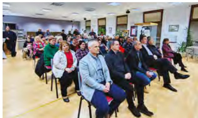
Priredba je pobudila veliko zanimanje posjetitelja