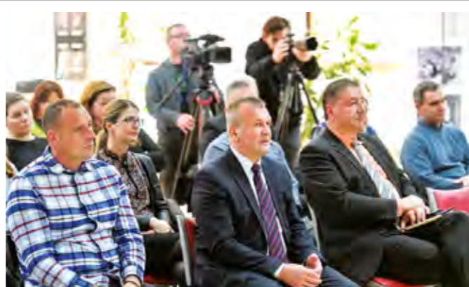
U Domu kulture predstavljen je projekt izgradnje i opremanja Posjetiteljskog centra Gaveznicu

- Naš cilj je prezentirati posebnost i vrijednost ovog jedinstvenog lokaliteta u Hrvatskoj. Za ovaj projekt je