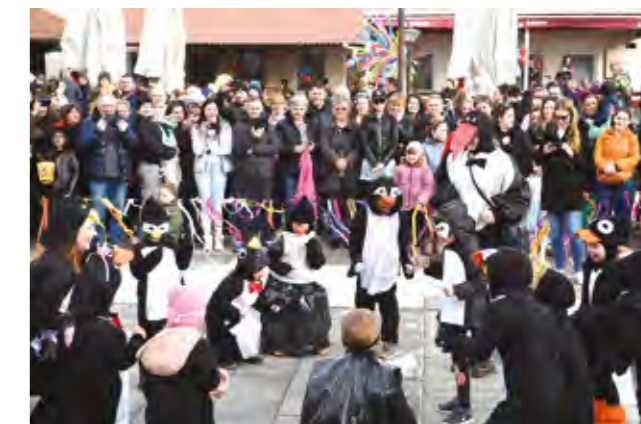
Male maskare predstavile su se kratkim programom

jetku zimu, umjesto spalivanjem fašnika, otjerale na originalni način - bušenjem fašnika od balona.