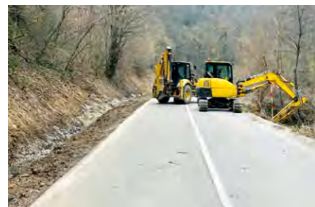
Intenzivno se radi i na cesti kroz Sutinsku