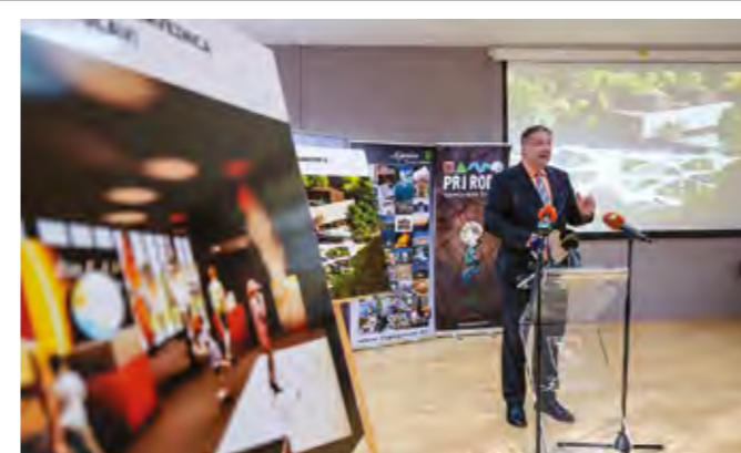
Posjetiteljski centar Gaveznicu prelazi lokalne okvire, a značajno će obogatiti turističku ponudu Lepoglave, ali i Varaždinske županije

- Projekt Posjetiteljskog centra Gaveznicu nema značaj samo za naš grad, nego prelazi lokalne i regionalne okvire, pa možemo reći da je to nacionalna, pa i svjetska razina. Gaveznicu je šesti geološki spomenik prirode u Hrvatskoj i jedino nalazište ahata u našoj državi. Bilo je to i područje kamenoloma, pa smo morali čistiti i naslage otpada, no napravili smo projekt sa sadržajem na kojem moramo biti ponosni. Ne možemo govoriti o korištenju lokacije u gospodarskom smislu, no značaj je u obrazovnom dijelu. Puno je školske djece već