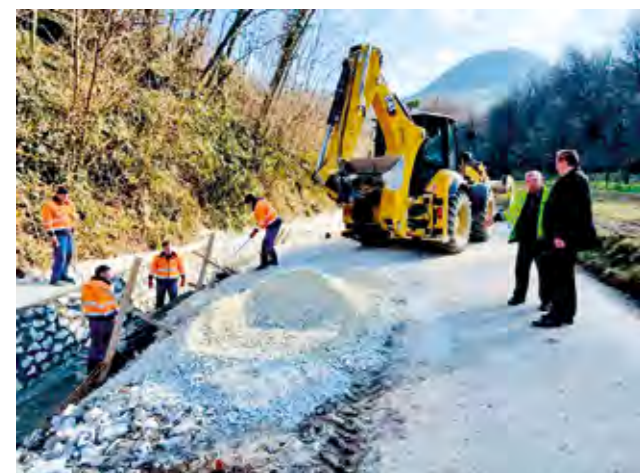
Uređen je i potok u Ulici Patačić