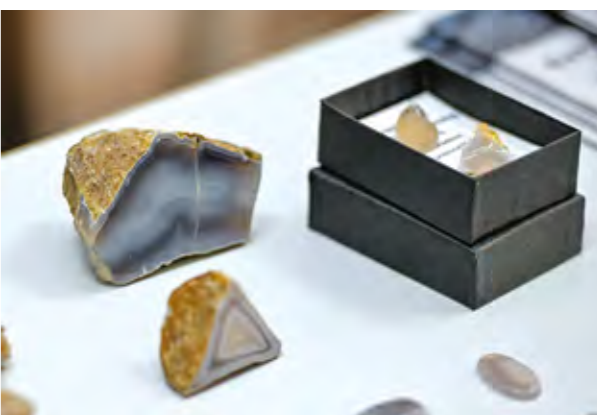
Lepoglavski ahat bit će predstavljen u zasebnom izložbenom prostoru

stva dobilo je naših sedam udruga, više od 10 tisuća eura. To je još samo jedan od pokazatelja značaja našega grada. Znamo da je lepoglavski čipka uvrštena na UNESCO-vu listu nematerijalne kulturne baštine, ali osim čipke, Lepoglava ima zaista bogatu povijesno kulturnu baštinu i tradiciju. Izuzetno smo ponosni na našu kulturu, na našu baštinu, i upravo zahvaljujući našim udrugama, ta se baština njeguje i promovira, ne samo u Hrvatskoj, nego i u svijetu - istaknuo je gradonačelnik Marijan Škvarić .