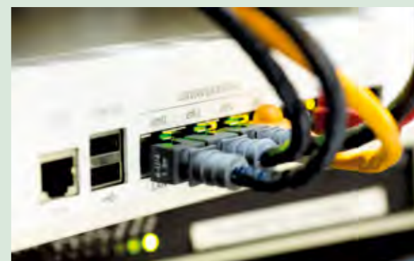
Tvrtka Optix Infrastructure prijavila je PRŠI Lepoglava na natječaj za financiranje širokopojasnog interneta

Grad Lepoglava je s općinama Bednja, Vinica, Cestica, Klenovnik i Donja Voća, nakon odustajanja od takozvanog modela B, po kojem je odgovornost za projektiranje te izgradnju i upravljanje mrežom bila na tijelima javne vlasti, prešao na model A, prema kojem će to učiniti operator koji će na sebe preuzeti odgovornost za projektiranje, izgradnju i operativni rad mreže koja ostaje u njegovom vlasništvu. Pri tom jedinice lokalne samouprave, za razliku od modela B, ne ulazu gotovo ništa, već tek inicijalno financiraju izradu projekta za prijavu na natječaj.