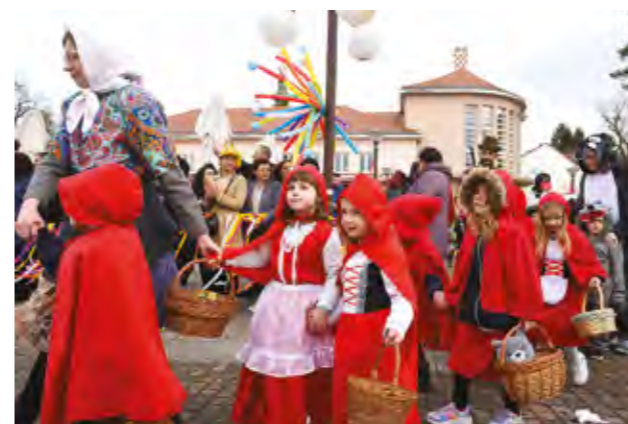
U fašničkoj povorci bile su i Crvenkapike

li odličan odaziv naših lepoglavskih mališana, vrtičaraca i školaraca, koji su se dobro zabavili na našem Dječjem fašniku. Tete iz vrtića, djeca i roditelji vrijedno su pripremili kreativne maske,