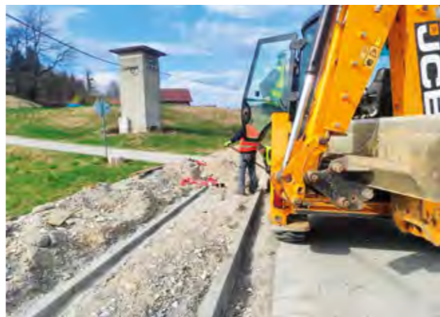
Novi nogostupi grade se i u Žarovnici

Grad Lepoglava je sklopio ugovor s tvrtkom Holcim za dobavu kamenog materijala, što će omogućiti