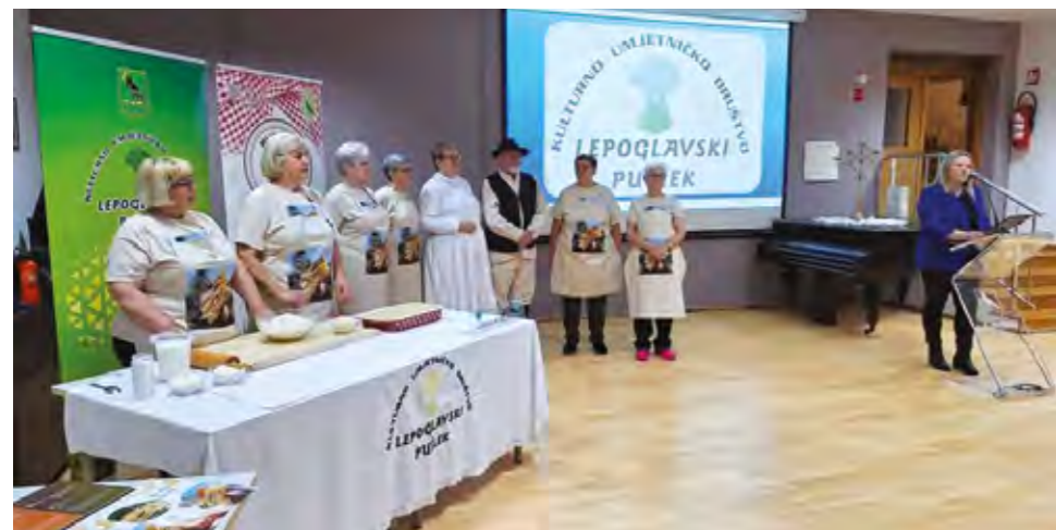
Ukusna jela lepoglavskog kraja privukla su brojne Lepoglavčane koji su uživali u ukusima i mirisima tradicije

Gradska knjižnica Ivana Belostenca u Lepoglavi 1. ožujka odisala je zamanim mirisima bogate gastronomske ponude lepoglavskog kraja.