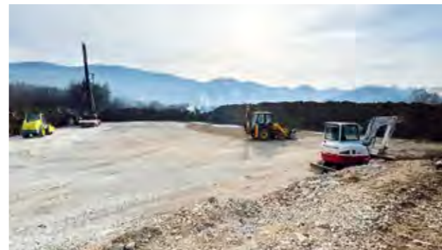
Radovi na izgradnji supermarketu u punom su jeku

- Ovo je još jedna odlična vijest za Grad Lepoglavu i sve naše stanovnike, jer ćemo uskoro u našem gradu imati suvremeni prodajni centar s velikom ponudom prehrambenih i neprehrambenih artikala.