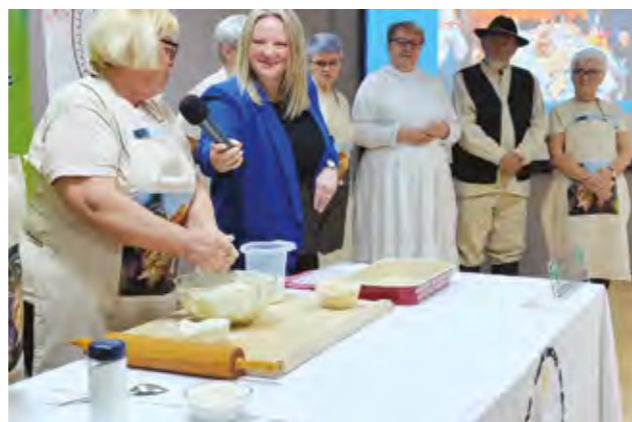
Članice KUD-a Lepoglavski pušlek demonstrirale su izradu Mlinčanog kolača

naš mlinčani kolač zaštićen a još lani smo dobili ispravu o žigu. Naš Mlinčani kolač nije zaštićen samo na razini grada Lepoglave, već i cijele Varaždinske županije - rekla je predsjednica KUD-a dodavši kako je i Varaždinska županija izradila bojanke za lepoglavski vrtić u kojem se nalazi i Mlinčani kolač, a članice su i vrtičaricama prezentirale izradu Mlinčanog kolača, čime znanje i vještine u pripremi tradicijskih jela prenose na nove naraštaje.