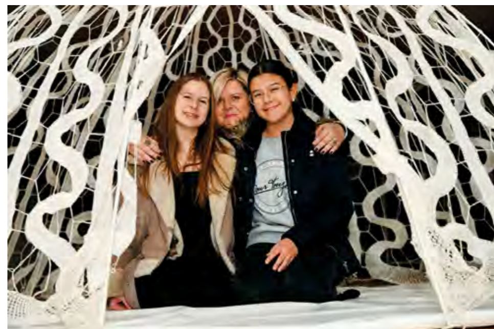
Organizatori su za posjetitelje pripremili i - atrakcije

ODRŽANA IZVJEŠTAJNA SKUPŠTINA LIMENE GLAZBE LEPOGLAVA