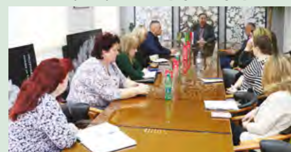
Na sastanku su dogovorene aktivnosti na očuvanju i prezentaciji lepoglavske čipke

Čipkarice su tom prilikom upozorile i na sve manji broj čipkarica, prije svega majstorica, koje mogu izraditi naj-složenije motive lepoglavske čipke. Zbog toga je iskazana potreba za poticanjem svih čipkarica za aktivnije sudjelovanje u procesu očuvanja lepoglavskog čipkarstva.