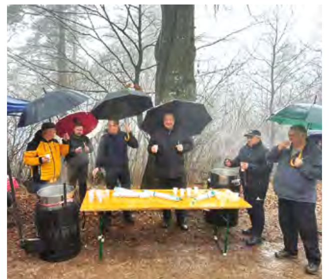
Hodočasnici i izletnicima na Ravnoj gori ponudena je okrijepa

Ovaj tradicionalni pohod na blagdan Bogojavljanja zajednički su organizirali Općina Bednja i Grad Lepoglava.