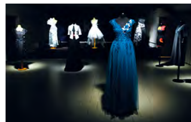
Atraktivne kreacije inspirirane lepoglavskom čipkom

I ove je godine priredba u Noći muzeja, koju su organizirali Grad Lepoglava i Turistička zajednica grada Lepoglave, uz podršku TKIC-a, privukla veliki broj posjetitelja koji su imali priliku razgledati i postav u nedavno otvorenoj galeriji lepoglavske čipke u Domu kulture.