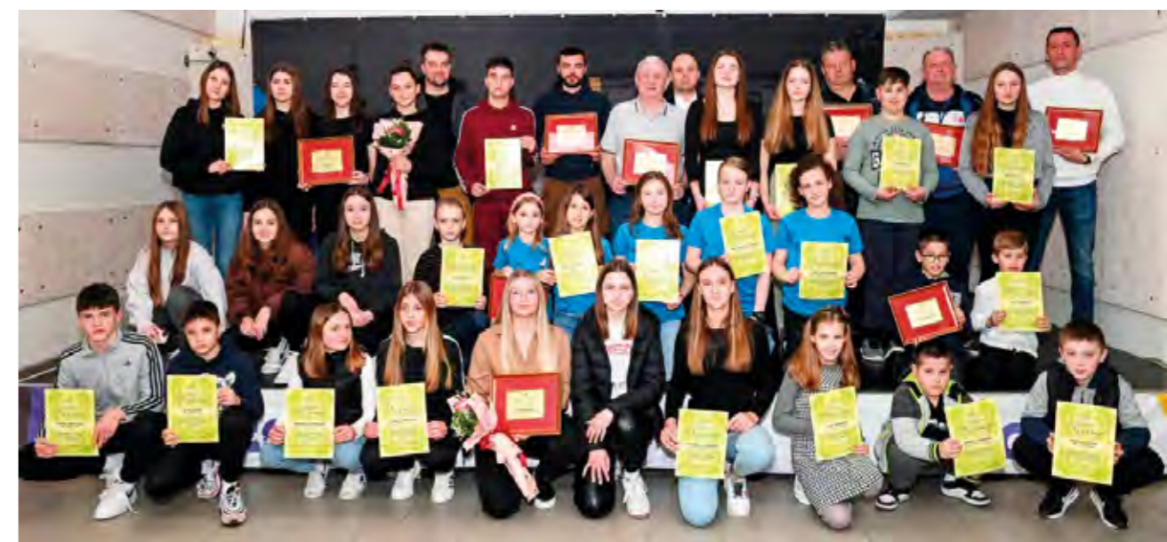
Dobitnici ovogodišnjih priznanja Zajednice sportskih udruga Grada Lepoglave

Priznanje za poseban doprinos sportu grada Lepoglave Zajednica sportskih udruga dodijelila je Udruzi za sport i rekreaciju Višnjica , koja je na 17. Hrvatskom festivalu sportske rekreacije žena u Karlovcu, u konkurenciji 31 ekipe osvojila ukupno 3. mjesto. UŠR Višnjica osvojila je i 3. mjesto na 27. festivalu sportske rekreacije na selu, koja je održana u Poljani Bišku-