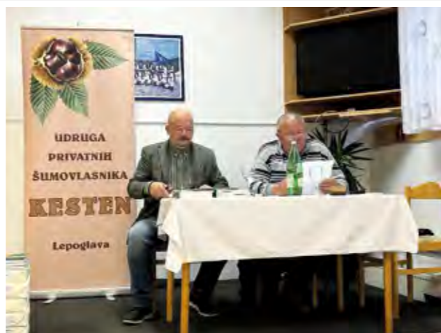
Na skupštini Udruge privatnih šumovlasnika istaknuta je odlična suradnja s Gradom Lepoglavom

Na skupštini ove udruge, koja je osnovana još 2005. godine, njen je rad pohvalio i gradonačelnik