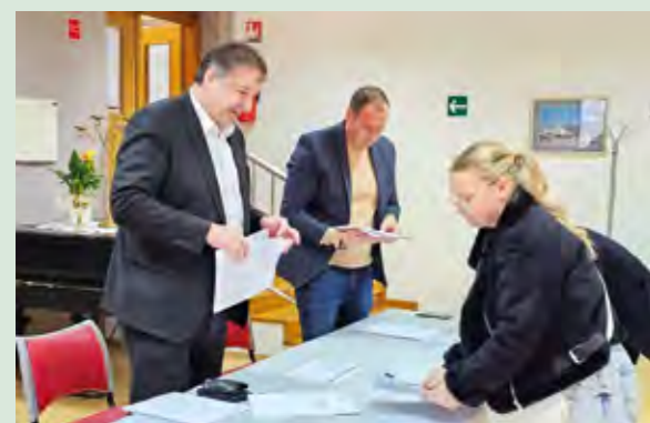
Lepoglava studentske stipendije dodjeljuje već 18 godina

Grad Lepoglava već 18 godina omogućuje studentima studiranje uz gradsku potporu, a ove je godine stipendije dobilo 36 studenata s lepoglavskog područja.