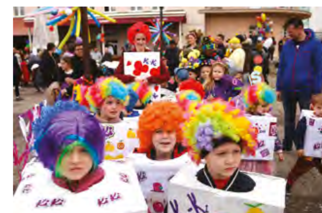
Vesela fašnička povorka u Lepoglavi

broj atmosferi doprinijeli su Limena glazba Lepoglave i gosti iznenađenja - Super Jež Sonic i LOL Maskota.