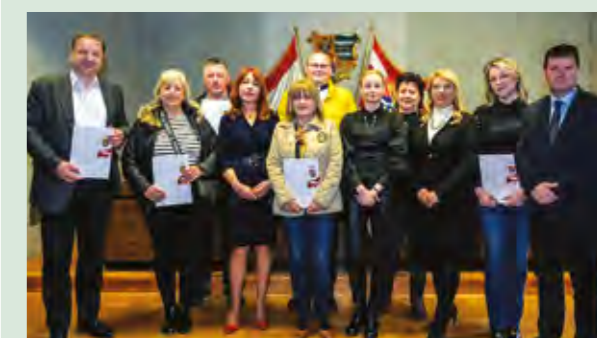
Potpore Varaždinske županije dobilo je i sedam udruga iz Lepoglave

Za 67 programa u kulturi Varaždinska županija izdvojila je više od 206 tisuća eura, a dio tog iznosa Županija je dodijelila i udrugama s područja Grada Lepoglave. Sedam udruga dobilo je potporu u iznosu od 10 tisuća i 730 eura.