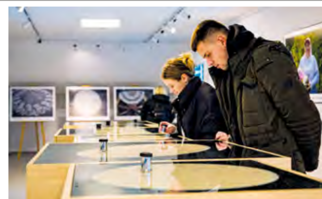
Posjetitelji su sa zanimanjem razgledali izložbu lepoglavske čipke

U Domu kulture su u Noći muzeja bili izloženi odjevni predmeti - kreacije studenata Tekstilno-tehnološkog fakulteta iz Zagreba s detaljima lepoglavske čipke, zatim metalne haljine s aplikacijama lepoglavske čipke i tijare izrađene od metaliziranog konca autorice Snježane Varović , te barokna bluza od čipke i svečana haljina Borisa Pavlina , inspirirana lepoglavskom čipkom „Ljeto u šumi”, kao i replike povije-