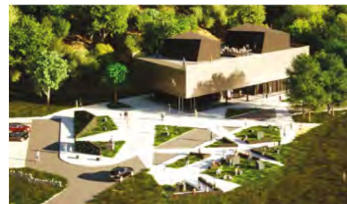
Posjetiteljski centar će se prostirati na oko 1.300 četvornih metara