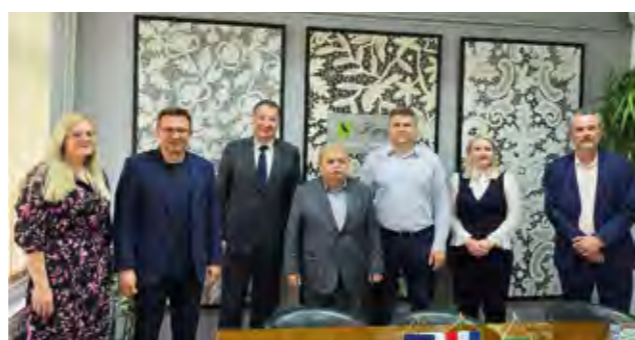
Čelni ljudi jedinica lokalne samouprave na čijem se području provodi projekt na konferenciji za novinare u Lepoglavi

Projekt je prijavljen na raspisani natječaj Ministarstva mora, prometa i infrastrukture, a sredstva