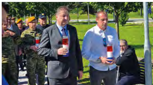
Predstavnici Grada odali su počast poginulim hrvatskim braniteljima

u Lepoglavi, ujedno i Dan otvorenih vrata Udruge branitelja Hrvatske.