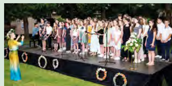
Na koncertu u Lepoglavi nastupilo je četrdesetak mladih glazbenika

Čak četrdesetak učenika područnih odjela Glazbene škole Varaždin - u Lepoglavi, Ivancu, Varaždinskim Toplicama i Cestici, koji su u četvrtak, 20. lipnja, nastupili na koncertu „4-PO“ u gradskom parku u Lepoglavi, svojim su muziciranjem oduševili publiku.