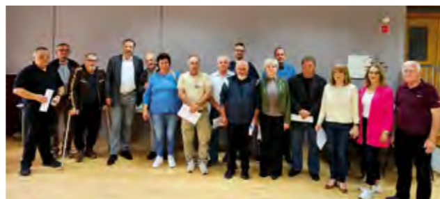
Ugovori su potpisani s predstavnicima 34 udruge koje su dobile sredstva u iznosima od 200 do 5.100 eura

Grad Lepoglava, osim za udruge civilnog društva, izdvaja sredstva i za sportske udruge u iznosu od 250