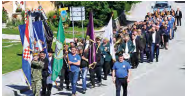
Sudionici proslave u defileu ulicama Lepoglave

Nakon misnog slavlja za poginule, nestale i umrle hrvatske branitelje, kod spomen obilježja u Parku hrvatskih branitelja odana je počast dvanaestorici poginulih branitelja s područja Grada Lepoglave, nakon čega je uslijedio defile centrom Lepoglave, do centralnog gradskog parka, gdje je uz počasni pucanj kuburaša iz Kamenice i Višnjice službeno otvoren program obilježavanja Dana OSRH