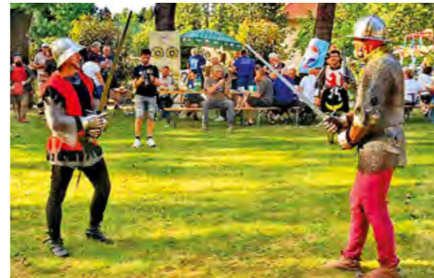
Viteški kamp u Gradskom parku