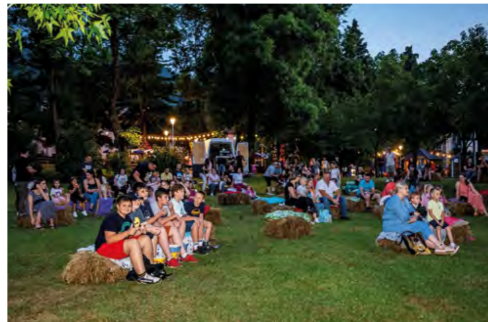
Novo avantura mačka Garfielda u Kinu na otvorenom

Ovogodišnji, 14. Lepoglavski dani, ponudili su niz atraktivnih programa za sve generacije.