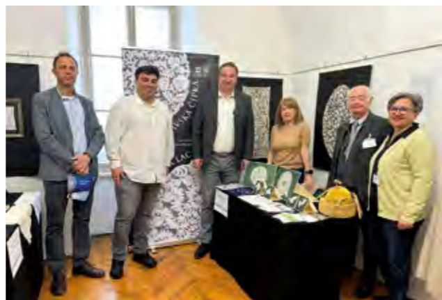
Lepoglavska čipka predstavljena je i na Međunarodnoj izložbi čipke u Križevcima

Lepoglavska čipka predstavljena je i na Međunarodnoj izložbi čipke koja je od 26. do 28. travnja organizirana u Likovnoj galeriji u Križevcima.