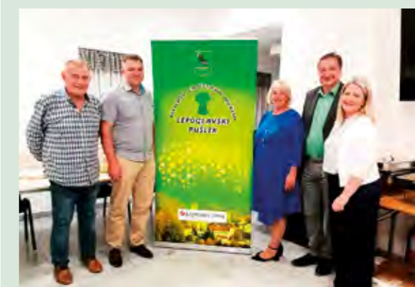
Uzvanici na skupštini pohvalili su rad KUD-a Lepoglavski pušlek

Članovi Kulturno - umjetničkog društva Lepoglavski pušlek prošle su godine bili izuzetno aktivni, a kroz svoje aktivnosti odlično su prezentirali i Lepoglavu te njenu vrijednu tradicijsku baštinu - istaknuto je na redovnoj godišnjoj skupštini KUD-a Lepoglavski pušlek.