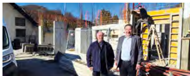
Lepoglavi je odobreno sufinanciranje i druge faze radova na izgradnji Vatrogasnog doma u Kamenici

Lepoglavi je ujedno iz Programa podrške brdsko-planinskog područja odobreno i sufinanciranje druge faze radova na izgradnji Vatrogasnog doma