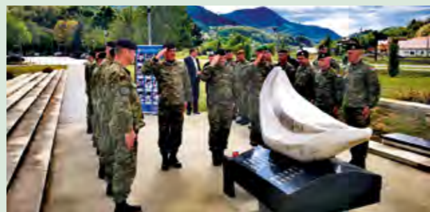
Pripadnici Gardijske oklopno - mehanizirane brigade odali su počast poginulim lepoglavskim braniteljima