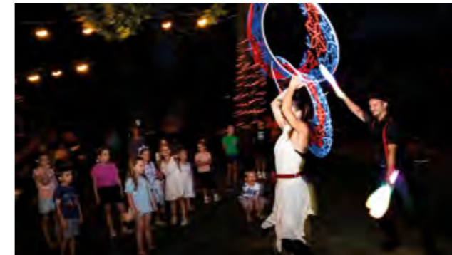
Dojmljiv program Loop cirkusa s LED rekvizitima

U tri dana ove zabavno-turističke manifestacije posjetitelji su uživali u sadržajno bogatom i raznolikom programu za sve generacije. Od petka do nedjelje, od 12. do 14. srpnja, posjetitelji su u gradskom parku uživali uz projekciju „Garfielda“ u Kinu na otvorenom, zani-