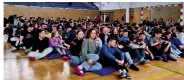
Poučna predstava za osnovnoškolce u Lepoglavi i Kamenici

- Projekt je usmjeren na osjetljivu skupinu djece, kao i na njihove roditelje.