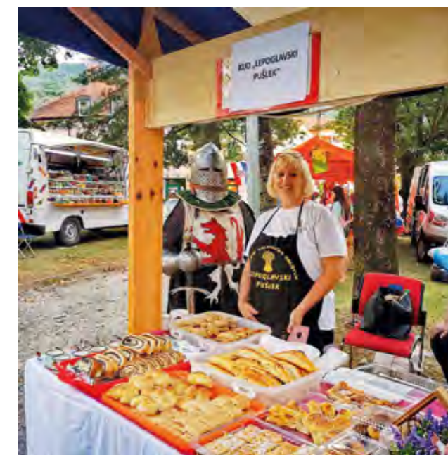
Na Lepoglavskim danima mogli su se kušati domači specijaliteti

vole i rado posjećuju. Organizatori - Turistička zajednica grada Lepoglave, Grad Lepoglava i TKIC zahvaljuju svim partnerima koji su sudjelovali u pripremi programa, a posebno posjetiteljima koji su pomogli da ovo 14. izdanje postane jedan lijepi događaj za pamćenje.