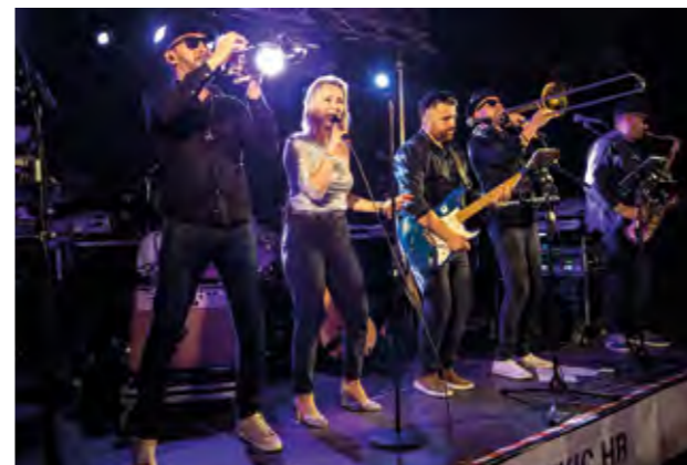
Odličan koncert imao je i MozArt bend