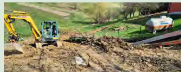
Radovi na sanaciji klizišta u Gornjoj Višnjici

Nakon potpisivanja ugovora s izvođačem radova "Građevinski obrt - Iskop" iz Klenovnika, izvode se radovi na sanaciji klizišta u Gornjoj Višnjici kod kućnog broja 42 A.