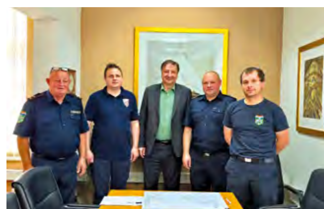
Na sastanku je istaknuta odlična suradnja vatrogasne zajednice i Grada Lepoglave

Na sastanku su istaknute i kapitalne investicije