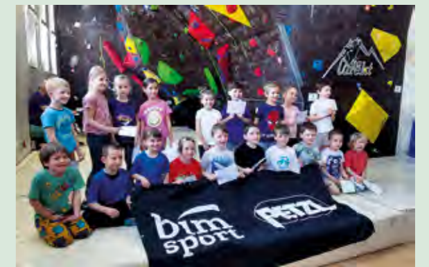
Na natjecanju drugog kola dječje regionalne BOULDER lige nastupilo je 90 mladih penjača i penjačica

U Lepoglavi je 6. travnja održana još jedna atraktivna sportska priredba. Prvi hrvatski Europski grad sporta bio je domaćin natjecanja u sportskom penjanju za mlade uzraste od 8 do 16 godina.