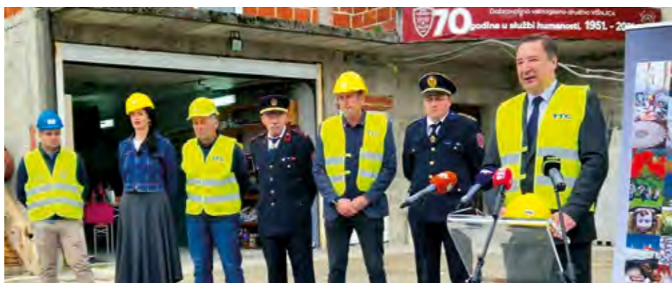
Održana je početna konferencija projekta „Energetska obnova zgrade Dobrovoljnog vatrogasnog društva Višnjica“

U Vatrogasnom domu Višnjica održana je 22. svibnja početna konferencija projekta „Energetska obnova zgrade Dobrovoljnog vatrogasnog društva Višnjica“, koji je financiran iz Nacionalnog plana oporavka i otpornosti 2021.-2026.