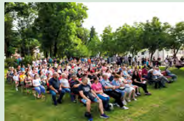
Koncert je pobudio veliko zanimanje publike u Lepoglavi

Organizatori ove glazbene večeri bili su Glazbena škola i njeni područni odjeli, uz potporu Turističke zajednice grada Lepoglave, Grada Lepoglave i TKIC-a.