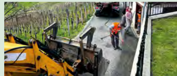
Nerazvrstane ceste uređuju se i na području Mjesnog odbora Žarovnica

- Asfaltiranjem i obradom nerazvrstanih cesta radimo i na poboljšanju uvjeta i kvalitete života naših građana jer, osim što će prometovanje po novouređenoj cesti biti sigurnije, ono će također biti i ugodnije - poručio je gradonačelnik Marijan Škvarić.