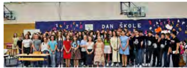
U Osnovnoj školi Ante Starčevića obilježen je - Dan škole

Kako je istaknuto na svečanosti na kojoj je obilježen Dan škole, njenih 268 učenika i 52 djelatnika,