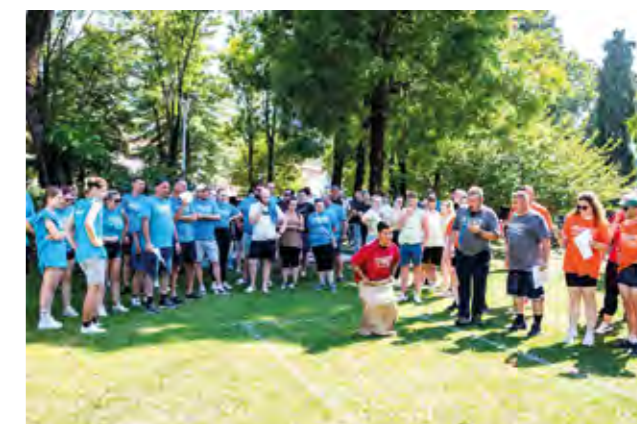
Atraktivno natjecanje na Zabavnim sportskim igrama

va još je jednom pokazao da vatrogasna oprema, lima i vatrogasci zanimaju i velike i male.