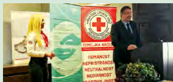
Gradonačelnik Lepoglave istaknuo je na početnoj konferenciji kako je ovaj projekt jako važan za stariju populaciju

U Županijskoj palači u Varaždinu održana je 15. svibnja početna konferencija projekta „Omogućimo život u vlastitom domu“, koji se provodi u sklopu projekta „Zaželi - prevencija institucionalizaciji“, čiji je nositelj Društvo Crvenog križa Varaždinske županije, a partner u projektu je i Grad Lepoglava.