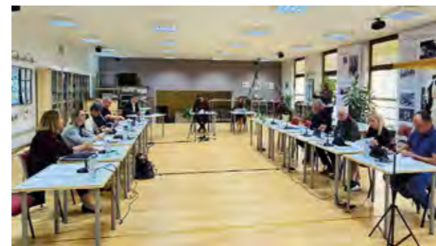
Vijećnici su donijeli odluku o povećanju proračuna za 2024. godinu za čak 873 tisuće eura, odnosno za 10,8 posto

Nekoliko točaka dnevnog reda odnosilo se i na