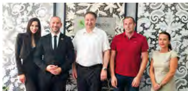
Ministar Damir Habijan na sastanku sa čelnim ljudima Grada Lepoglave

Posebno mi je drago da se ministar Habijan