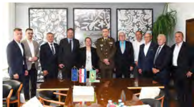
Visoki uzvanici na prijemu u Gradskoj vijećnici

- Njima se trebamo pokloniti s pijetetom i odati im zaslužen priznanje i poštovanje. Danas često puta možemo čuti sintagmu kako se mi, branitelji, trebamo okrenuti budućnosti, a ne prošlosti. Međutim,