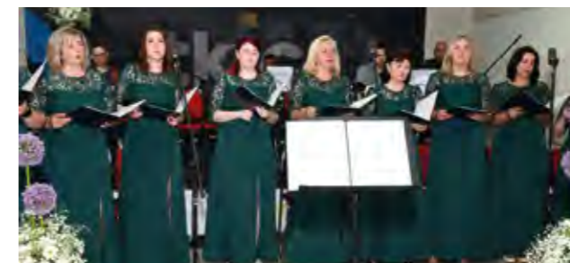
Članice Collegium artisticuma održale su slavljenički koncert

i na slavljeničkom koncertu mogla uživati u njihovom zajedničkom muziciranju. U programu ovoga atraktivnog slavljeničkog koncerta nastupili su i mali gitaristi iz Glazbene škole Varaždin pod vodstvom prof. Mislava Vudjana .