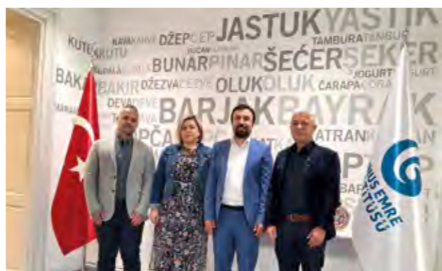
U zagrebačkom Turskom kulturnom centru „Yunus Emre“ dogovoren je program koji će na ovogodišnjem festivalu ponuditi zemlja - partner Turska

O detaljima programa 28. Međunarodnog festi-