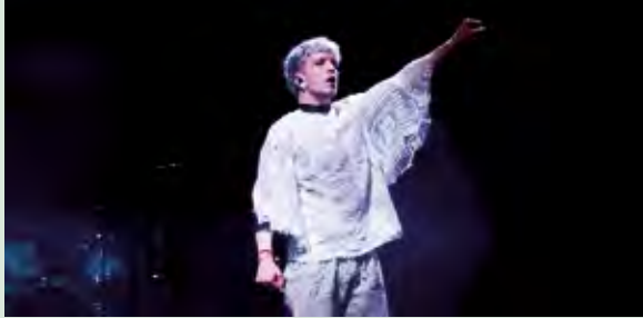
Baby Lasagna postao je promotor čipke i čipkarstva

- Ako budem došao u Lepoglavu, želio bih da mi se „ishekla“ maca ili Gospa - rekao je Baby Lasagna, koji je svojim „outfitom“ globalno promovirao hrvatsku čipku i čipkarstvo.