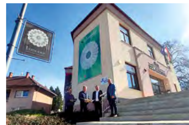
TKIC će dobiti prilaznu rampu za osobe s invaliditetom

Ukupna vrijednost projekta je 533 tisuće i 259 eura, od čega očekivana bespovratna sredstva iznose 477 tisuća i 601 euro.