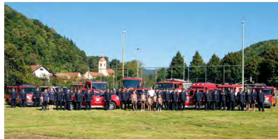
Tijekom svibnja, Mjeseca zaštite od požara lepoglavski su vatrogasci proveli niz aktivnosti Lepoglave

Na sastanku je istaknuto da je Vatrogasna zajednica Grada Lepoglave ove godine prigodno obilježila 30. obljetnicu osnutka.