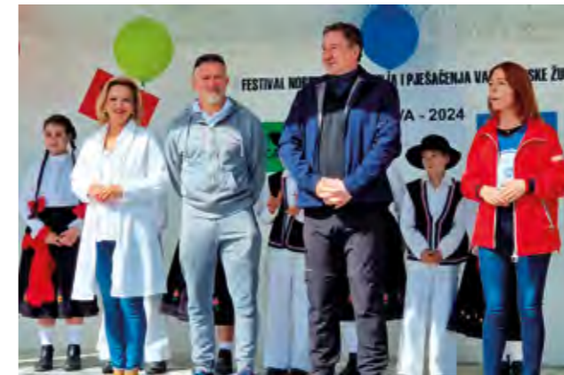
Lepoglava je s velikim uspjehom ugostila poklonike nordijskog hodanja

- Drago mi vas je vidjeti u ovako velikom broju. Vaša ljubav prema prirodi, prema kretanju, hodanju, pokazuje da vodite brigu o svom zdravlju. Drago mi je da je ovaj festival vezan i uz Svjetski dan kretanja, jer je svakodnevna aktivnost iznimno bitna za do-