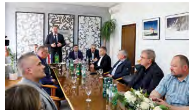
Na konferenciji za novinare predstavljen je Program poticane stanogradnje u Lepoglavi

- Cilj koji smo si postavili je osigurati, prije svega, radna mjesta i to smo u Lepoglavi uspjeli, a sada, posebice mladim obiteljima, moramo omogućiti i rješavanje stambenog pitanja. Upravo s ovim projektom želimo im osigurati i krov nad glavom. Vezano uz POS, posebno želim naglasiti tri bitne odrednice. Prva je da se bavimo politikom koja ima sadržaj i jasne ciljeve. Želimo dati mogućnost našim mladima da ostanu u našem gradu, ali i drugim mladim obiteljima da se mogu doseliti u naš grad. Takav projekt otvara i gospodarski napredak, jer nešto se gradi, stvaraju se nove vrijednosti i koristi za naše gospodarstvenike. Treća stvar koju bih također sa zadovoljstvom istaknuo je moje uvjerenje da je ovo i početak rješavanja državne imovine na području Grada Lepoglave, gdje je čak 60 posto zemlja-