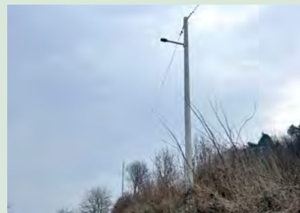
Postavljena nova rasvjeta doprinijet će većoj sigurnosti prometa

Završeni su radovi na izgradnji produžetka javne rasvjete u ulici Gorica na sv. Ivanu, u koju se uložilo 9.900 eura.