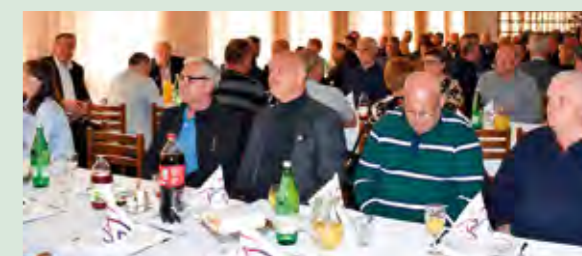
Pčelarska udruga „Čmalico“ održala je u Lepoglavi redovnu skupštinu

U restoranu „Ivančica“ u Lepoglavi Pčelarska udruga „Čmalico“ iz Bednje je krajem ožujka održala redovnu skupštinu.