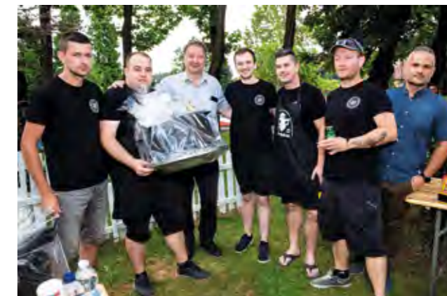
Na Lepoglavskim danima ponovo se kuhala izvrsna kotlovin