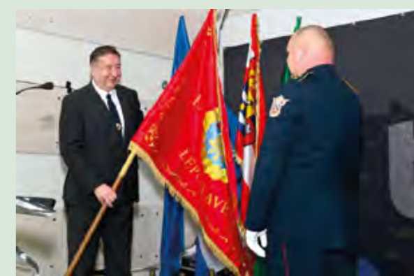
Gradonačelnik Marijan Škvarić uručio je svečanu vatrogasnu zastavu

U Domu kulture u Lepoglavi svečano je obilježena 30. godišnjica djelovanja Vatrogasne zajednice Grada Lepoglave, na kojoj je gradonačelnik Marijan Škvarić uručio svečanu zastavu lepoglavskim vatrogascima.