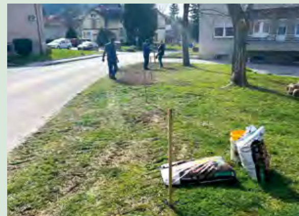
U Mihanovićevoj ulici će biti zasaden novi drvored

početak formiranja drvoreda. Daljnje uređenje će se provoditi nakon izrade "Strategije upravljanja urbanim zelenilom" zajedno sa stručnim partnerom i građanima.