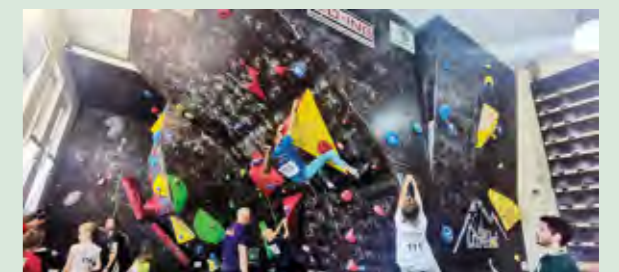
Mladi penjači i penjačice natjecali su se u pet kategorija

- Ovo nije prvo takvo natjecanje koje je organizirao SPK Direkt u Lepoglavi. Drago mi je što su na natjecanju sudjelovali i njihovi članovi, koji su postigli vrlo dobre rezultate, na čemu im čestitam. Lepoglava je ipak grad sporta i time se ponosimo. Grad oduvijek nastoji što više pomagati i podržavati svoje sportaše, a tako ćemo nastaviti i dalje - poručio je gradonačelnik Marijan Škvarić .