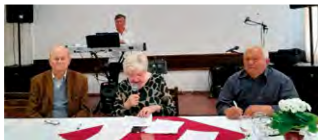
Na skupštini je istaknuta dobra suradnja s Gradom

Škvarić , koji je posebno istaknuo kako lepoglavski umirovljenici uvijek mogu računati na podršku Grada.