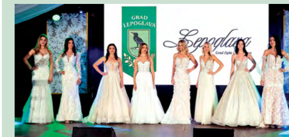
U izboru je sudjelovalo osam djevojaka