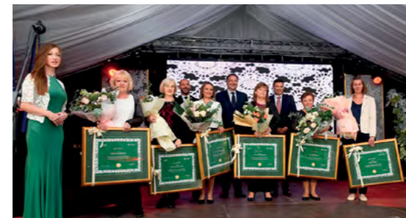
Na svečanosti otvorenja uručena su i priznanja počasne majstorice

nje vremena, zorno pokazuje kako je u izradu čipke potrebno uložiti puno vremena ali i ljubavi prema njenoj izradi. Lepoglava je već niz godina značajno europsko središte čipke, koje čuva, štiti i promovira tu vrijednu baštinu koja je uvrštena i na listu UNESCO-a. Posebno zahvaljujem majstoricama čipkarstva u Lepoglavi na trudu i maru koje su utkale u lepoglavsku čipku,