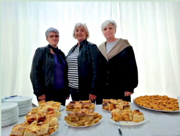
Članice KUD-a Lepoglavski pušlek pripremile su - mlinčani kolač

mo sačuvati i predstaviti na našem međunarodnom festivalu. Zahvaljujem Gospodarskoj školi u Varaždinu, članicama KUD-a Lepoglavski pušlek i našim turskim partnerima, uz čiju smo podršku i ove godine organizirali ovu atraktivnu gastronomsku priredbu - istaknuo je Marijan Škvarić , gradonačelnik Lepoglave na otvorenju „Okusa Hrvatske i Turske“.