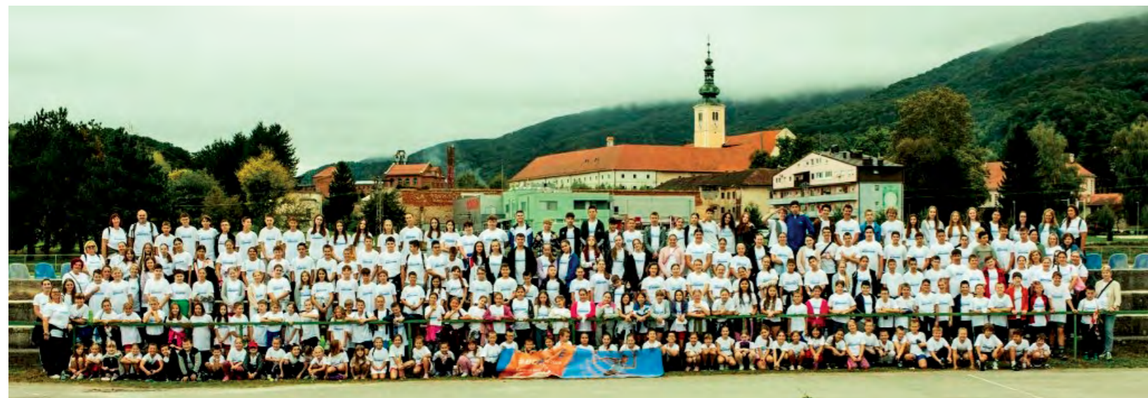
U Lepoglavi je po deseti puta obilježen Europski tjedan sporta

U Lepoglavi, prvom Europskom gradu sporta u Republici Hrvatskoj, i ove je godine obilježen - Europski tjedan sporta. Od 23. do 30. rujna, u ovoj manifestaciji kojom se diljem Europe promiče sport i tjelesne aktivnosti sudjelovalo je više od tisuću djece iz osnovnih škola i dječjih vrtića na području grada Lepoglave.