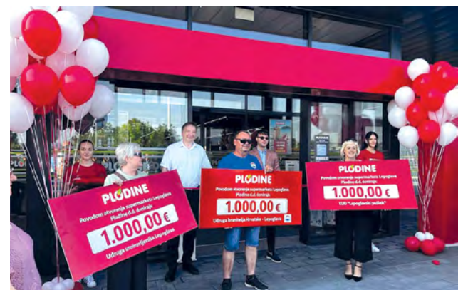
Novi supermarket Plodina u Lepoglavi

Kupcima novog supermarketa na raspolaganju su i odjeli mesnice, voća i povrća, samoposlužna pekara s dnevno svježim pečenim pekarskim proizvodima te gastro odjel s pripremom jednostavnih toplih jela.