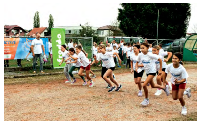
U programu su sudjelovali učenici osnovnih škola s područja grada Lepoglave

- Europski tjedan sporta u Lepoglavi se obilježava već desetu godinu, a do sada je u programima koji su organizirani u Europskom tjednu sporta sudjelovalo više od 10 tisuća sudionika svih dobnih skupina. Glavna tema kampanje "Tjedna sporta" i ove je godine - #BeActive, kako bi se istaknuo glavni cilj manifestacije - poticanja javnosti na tjelesnu aktiv-