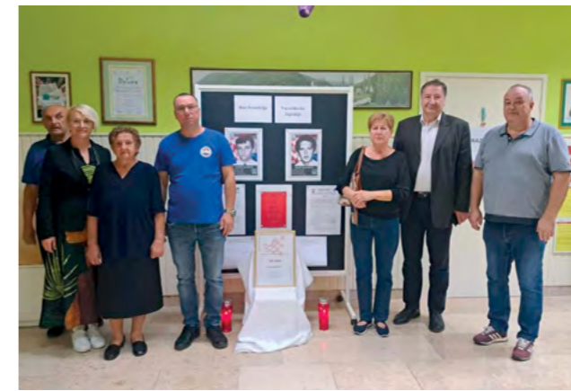
Spomen obilježja otkrivena su u osnovnim školama u Lepoglavi, Kamenici i Višnjici