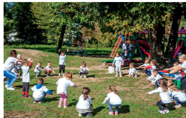
Zdrave navike stječu se još u najranijoj dobi

Programi su ove godine održani u dječjim vrtići-