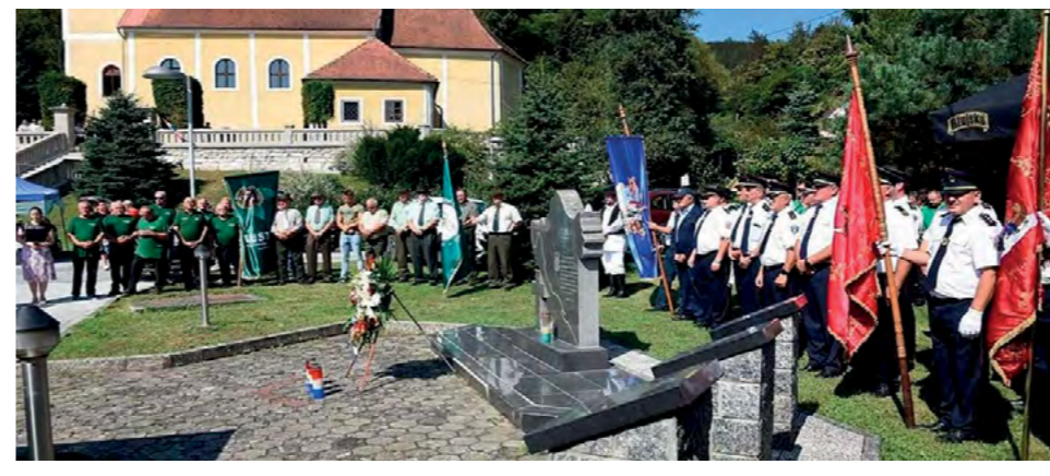
U Kamenici je svečano proslavljen blagdan svetog Bartola

gostiju i uzvanika u Restoranu JAK u Žarovnici, a potom i svečanost otvaranja 19. Memorijalnog malonogometnog turnira na sportskom kompleksu u Žarovnici.