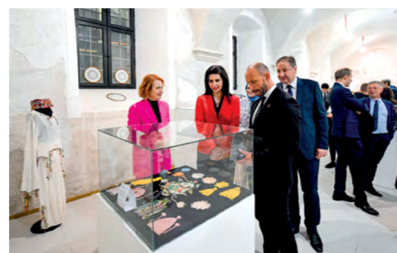
Izložke na festivalu sa zanimanjem je razgledao i ministar pravosuđa, uprave i digitalne transformacije Damir Habijan

glavsku crkvu i pavlinski samostan. Njenu ljepotu i vrijednost prepoznao je i UNESCO, koji je lepoglavsku čipku 2009. godine uvrstio na svjetsku listu nematerijalne kulturne baštine čovječanstva. Izrada lepoglavske čipke nije samo zanat, ona je odraz našeg identiteta, naše predanosti i našeg zajedništva kroz stoljeća. Svaki konac i nit, svaki uzorak čipke priča priču o životima naših predaka, o njihovim običajima i svakodnevnim iskustvima.