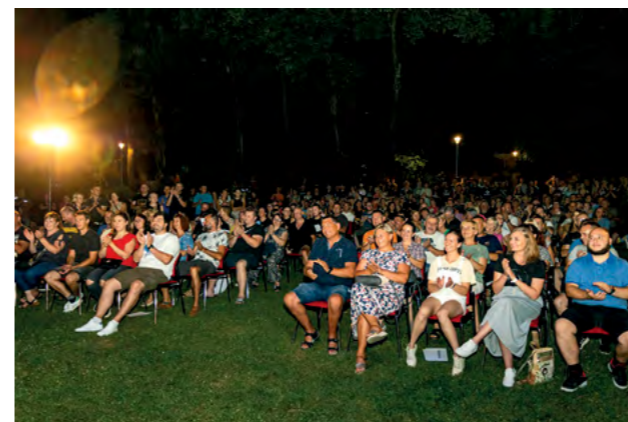
Atraktivni sadržaji privukli su veliki broj posjetitelja

pohvalio je gradonačelnik Lepoglave Marijan Škvarić.