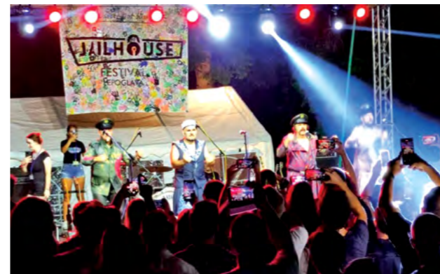
Let 3 je u Lepoglavi održao koncert za pamćenje

okušati u popularnoj igri Escape Room te pogledati film u atraktivnom - kinu pod zvijezdama. I ove su godine organizirane razne društvene igre, na festivalu se igrala i odbojka te badminton, pa su posjetitelji mogli uživati u raznovrsnim sadržajima, među kojima je bio i urnebesni nastup Aleksa & Bare te Saše Turkovića i Gorana Vugrinca.