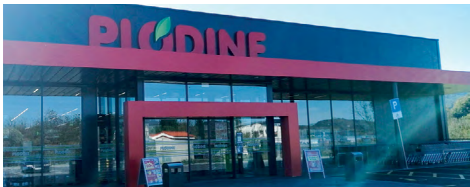
Novi trgovački centar Plodina u Lepoglavi

ve. Želim pri tom istaknuti kako su investitori u prvoj godini oslobođeni plaćanja komunalne naknade, iako su i komunalna naknada i komunalni doprinos na području Grada Lepoglave čak i desetorostruko niži nego oni u većim gradovima i industrijskim centrima. Te olakšice prepoznaju investitori i ulažu u nove kapacitete, iako Lepoglava nažalost, nema najbolju položajnu rentu, jer je udaljena od Varaždina, ali i od autoceste. Posebno me veseli velika ulaganja naših, domaćih poduzetnika. Grad je na raspolaganju poduzetnicima i u okviru zakona spreman ih je podržati u ostvarenju njihovih poduzetničkih ideja, jer je rast gospodarstva ujedno i najbolja demografska mjera. Mladima treba najprije osigurati radna mjesta i krov nad glavom, a onda i kvalitetne društvene sadržaje. Se ponosom mogu reći da Lepoglava danas ima puno uspjeha u ova tri segmenta razvoja - istaknuo je gradonačelnik Lepoglave.