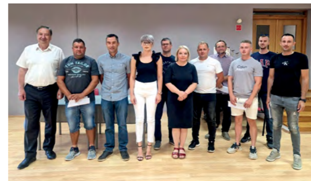
Gradsku potporu ove su godine dobila 22 gospodarstvenika

Razvoj gospodarstva osnova je razvoja grada, stoga nastojimo pomoći našim gospodarstvenicima. Podršku prije svih trebaju mladi gospodarstvenici koji tek ulaze u poduzetničke vode te mali poduzetnici. Drago mi je da je ovaj projekt dobro prihvaćen od naših gospodarstvenika. Na raspisani natječaj javilo se 26 gospodarstvenika, a u odnosu na raspoloživa sredstva od 30 tisuća eura, potpisali smo ugovore s 22 gospodarstvenika s područja Grada Lepoglave. Ukupno je do sada ovu potporu iskoristilo 120 gospodarstvenika, kojima je dodijeljeno više od 160 tisuća eura - rekao je gradonačelnik Marijan Škvarić prilikom potpisiva-