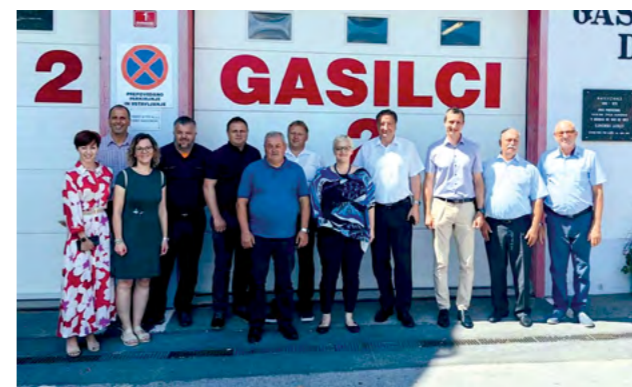
Izaslanstvo Lepoglave posjetilo je Lošku dolinu

Škvarić posebno je istaknuo kako je ovaj posjet Loškoj dolini bio prigoda za širenje dosadašnje suradnje na razini udruga i škola, te na području sporta, kulture i gospodarstva.