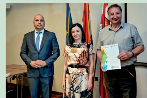
Lepoglava je dobila sufinanciranje projekta Smart City

Grad Lepoglava jedan je od triju gradova i općina na području Varaždinske županije kojemu je dodijeljen ugovor za sufinanciranje razvoja pametnih i održivih rješenja i usluga u javnom sektoru.