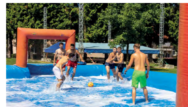
Atrakcija ovogodišnjeg Jailhouse festivala bio je nogomet na vodi

Zanimljivo predavanje o vilama ove je godine na festivalu održao televizijski novinar Kristijan Petrović, a posjetitelji su se mogli