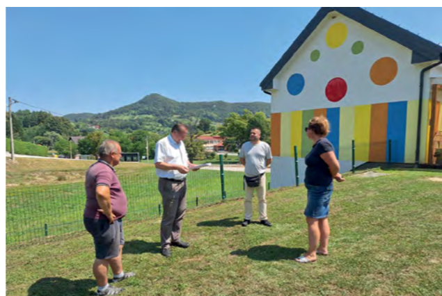
Dječji vrtić u Donjoj Višnjici ove će jeseni dobiti nova igrala

- tobogani, mostići, sjedalice, ljučjačke, penjalice i njihalice biti na raspolaganju djeci u Donjoj Višnjici.