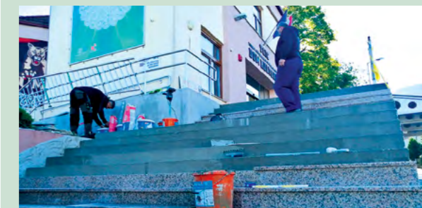
Na stepenište i terasu ispred TKIC-a postavlja se nova kamena obloga

Nakon što smo energetski obnovili zgradu gradske uprave, sada su u tijeku radovi na energetskoj obnovi vatrogasnog doma u Višnjici, koji su pred završetkom, nakon čega ćemo započeti i energetsku obnovu TKIC-a, koja bi uključila izolaciju fasade, krovništa te zamjenu svih prozora na ovom objektu, čime bismo značajno smanjili režijske troškove - najavio je nova ulaganja u lepoglavski TKIC gradonačelnik Marijan Škvarić.