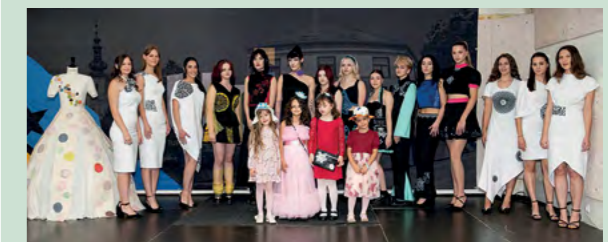
Sudionice atraktivnih modnih revija na ovogodišnjem festivalu čipke

Dan europske baštine, koji je tradicionalno održan u sklopu Međunarodnog festivala čipke u Lepoglavi, započeo je zanimljivim radionicama na kojima su učenici i njihovi mentori aplicirali lepoglavsku čipku na različite ukrasne i uporabne predmete, a okušali su se i u pletenju tekstilnim trakama.