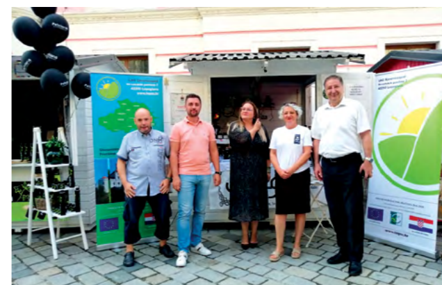
LAG Sjeverozapad je na Špancirfestu i ove godine svojim članovima omogućio besplatnu promociju

- Naš LAG je u prošlom programskom razdoblju bio jedan od najuspješnijih lokalnih akcijskih grupa po iskorištenosti sredstava u Republici Hrvatskoj. U proteklom programskom razdoblju za razvoj poljo-