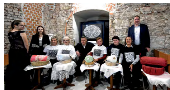
Festival je posjetio i predsjednik Republike Zoran Milanović

Lepoglava je već dugo poznata kao središte majstorski izrađene čipke, tradicija njene izrade seže i daleku prošlost i prenosi