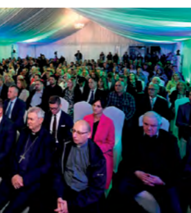
Uzvanici na svečanosti otvorenja ovogodišnjeg Međunarodnog festivala čipke u Lepoglavi

Ove godine će na festivalu biti predstavljene čipke iz čak 15 europskih zemalja, a posebno atraktivne izložke imat ćemo priliku vidjeti zahvaljujući Turskoj, ovogodišnjoj zemlji - partneru. Turska je ove godine donijela i dašak Orijenta u naš kraj. Ovogodišnji moto - Tka-