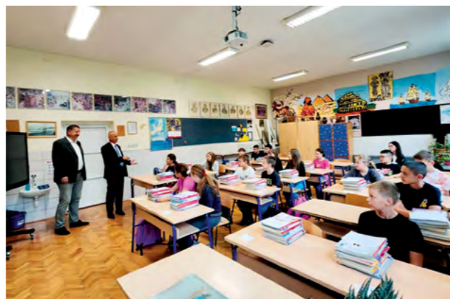
U školske klupe u tri osnovne škole sjelo je ove školske godine 458 učenika

Grad Lepoglava je iz proračuna za program potreba u obrazovanju, na temelju zahtjeva osnovnih škola u prvoj polovici 2024.