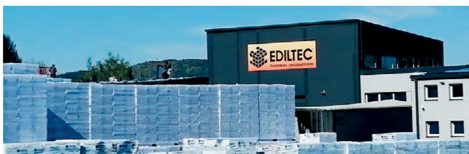
Lepoglava je postala centar proizvodnje okipora

Zahvaljujući gospodarskim mjerama i poticajima na području Grada Lepoglave ulaže sve više stranih, ali i domaćih investitora.