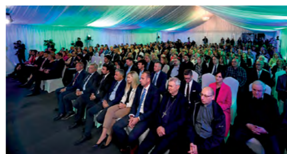
Uzvanici na svečanosti otvorenja ovogodišnjeg Međunarodnog festivala čipke u Lepoglavi

Turske i Lepoglave. Ponosni smo da je upravo Turska ovogodišnja zemlja - partner ovoga uglednog festivala. Vjerujem da će predstavljanje bogate turske kulturne baštine na festivalu u Lepoglavi pridonijeti još boljem razumijevanju i prijateljstvu između naša