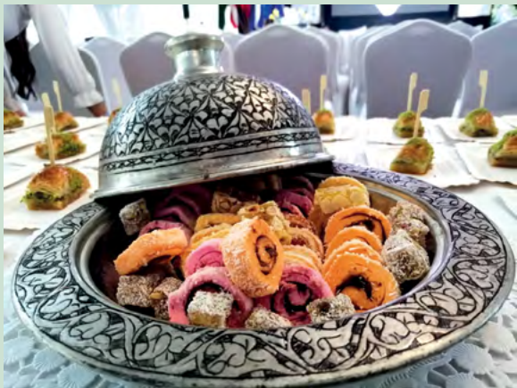
Na festivalu su predstavljene i tradicionalne turske slastice

I na ovogodišnjem, 28. Međunarodnom festivalu čipke održana je već tradicionalna gastronomska priredba na kojoj zemlja - partner predstavlja svoju gastronomiju. Ove je godine zemlja - partner - Republika Turska, posjetiteljima festivala ponudila tradicionalna jela - pide te neodoljivo ukusne baklave i rahatlokum.