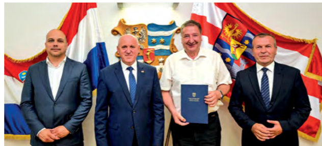
Gradu Lepoglavi dodijeljen je još jedan vrijedan ugovor o sufinanciranju

Inače, ovo je bio već 12. projekt koji je Grad Lepoglava proveo u prvih osam mjeseci ove godine, čime je zadržao vodeću poziciju ne samo u Varaždinskoj županiji, već i na razini cijele države.