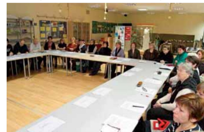
Radionica „Od turističke inicijative do novog turističkog proizvoda“