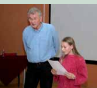
Enes i djevojčica iz publike - dodatan šarm pjesničkom druženju PJSNIČKA VEČER