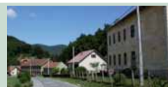
U staroj školi će Učiteljski fakultet uređiti studentski kampus

Kameničku su školu u početku pohađala djeca iz Jerovca, Kuljevića, Bedenca, Žarovnice, Vrhovca, Crkovca, Podgorja i Kamenice. Godine 1879. Jerovec, Kuljevića i Bedenec dobivaju zasebnu školu, a 1951. oformljena je i područna škola u Žarovnici. U to vrijeme škola je bila spojena sa župnim uredom, a djecu je podučavao kapelan Mikec, za čiji se rad plaćalo u naturi (mošt, žito, sijeno, drva) te ponekad, samo djelomično, srebrnim novcem iz seoske blagajne. Godine 1863. sagrađena je školska zgrada koja