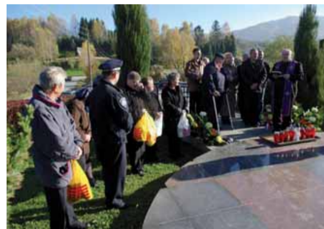
Poginulima je odana počast kod središnjeg križa na groblju u Lepoglavi

Uoči blagdana Svih svetih, u petak su, 29. listopada, roditelji i rodbina poginulih branitelja, predstavnici braniteljskih udruga, Grada Lepoglave, Gradskog vijeća i političkih stranaka kod središnjeg križa na gradskom groblju položili vijence, zapalili svijeće i odali počast lepoglavskim braniteljima poginulim u Domovinskom ratu.