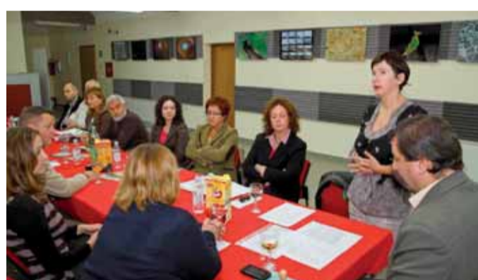
Sastanak radi realizacije projekta Putovima neandertalca

Gaveznica je posve uređena i spremna za dolazak organiziranih grupa. Očekuje ih obilazak dijela nekadašnjeg fosilnog dimnjaka, razgledavanje vulkanskih i ahatških stijena, razglednog kamenog mobilijara s geološkim stupom i informativnim pločama. Ulaznica za pojedinačne