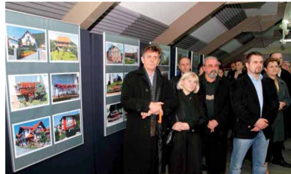
Priredena je izložba fotografija najljepših balkona i okućnica