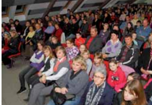
Posjetitelji su u velikom broju pohrlili na predstave pučkih teataru

I mještani Klenovnika i Donje Voće u lipom su se broju odazvali predstavama, a sve to poruka je da narod uživa u izvornom humoru koji mu je blizak i kojeg razumije.