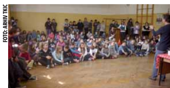
Bitenc se družio s djecom kameničke škole