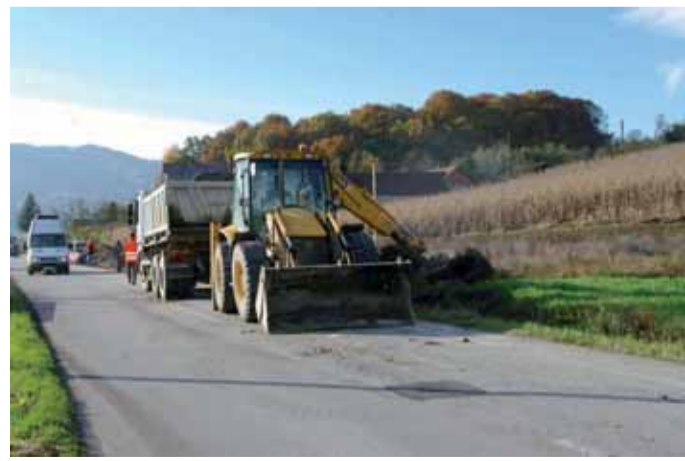
Pješačka staza gradi se na potezu od škole do rotora

Ukupna vrijednost radova je oko 400.000 kuna, a ŽUC i Grad Lepoglava financiraju ih u omjeru 50:50. (mm)