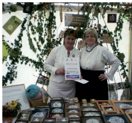
Priznanje čipkaricama za najljepše uređen štand u Đakovu