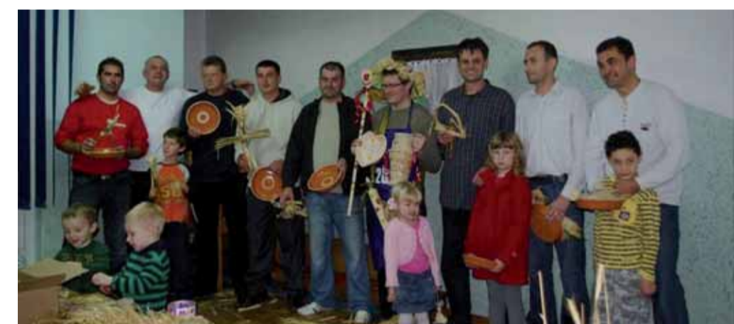
U finalnim disciplinama za naslov „naj“ natjecalo se devet vrtićkih ozeva

Pjesme u povodu Dana kruha, mališani su zapjevali i vlč. A. Kišičeku