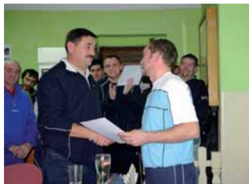
Zahvalnice su uručene sponzorima i podupirateljima koji su omogućili obnovu kuglane

Početak ove godine bili smo primorani krenuti u preuređenje kuglane. Naime, u prvoj i drugoj ku-