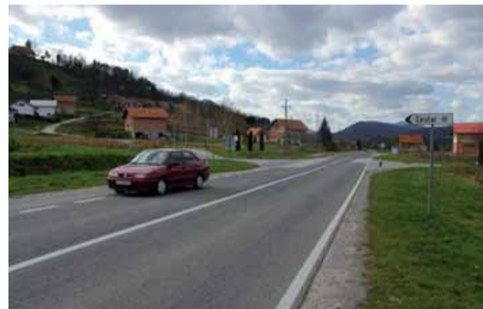
Raskrižje od obilaznice prema gradskom centru bit će rekonstruirano i prošireno