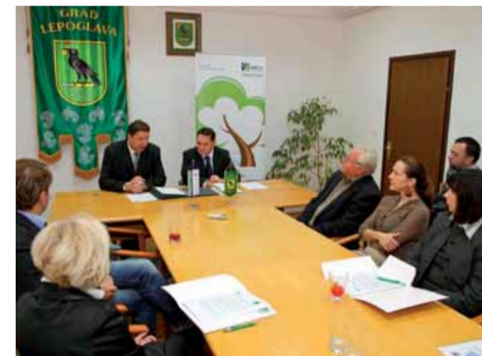
Potpisivanjem ugovora s Vaba bankom do kreditnog fonda od 3 milijuna kuna