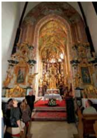
U „paketu“ će biti i obilazak crkve