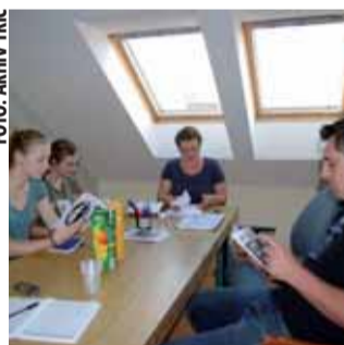
Savjet mladih donio je program rada, koji obuhvaća osam područja djelovanja

U skladu sa smjernicama Nacionalnog i Gradskog programa djelovanja za mlade, Savjet mladih grada Lepoglave donio je vlastiti program rada. Obuhvaća područja obrazovanja i informatizacije, zapošljavanja i poduzetništva, socijalne politike, zdravstvenu zaštitu i reproduktivno zdravlje, aktivno sudjelovanje mladih u društvu, civilno društvo, kulturu mladih i slobodno vrijeme te mobilnost, informiranje i savjetovanje mladih.