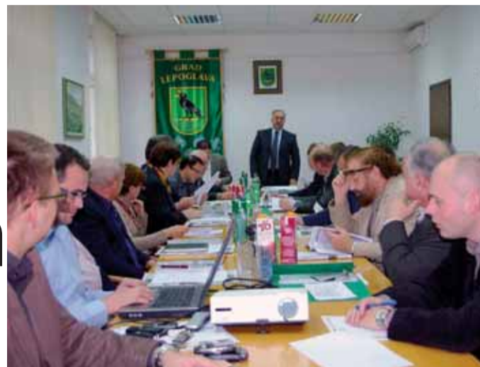
Sav ostvareni prihod od fitness centra vraćat će se lepoglavskom sportu

S prijedlogom da se fitness centar uredi posredstvom donacije ZŠU, neki se vijećnici nisu složili. Dok su neki obrazlagali da bi