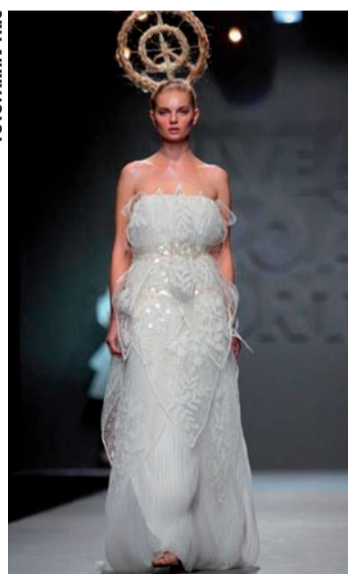
Ljeto u šumi na čipkanj haljini