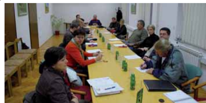
Sa sastanka stanara s gradskim čelničtvom

Najviše polemike izazvala je činjenica da će stanari zgrada, koji se trenutno vodom snabdijevaju iz sustava Kaznionice (koja je u međuvremenu priključena na Ivkomov vodopokrbrni sustav), također postati Ivkomovi potrošači. Problem je što