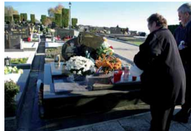
Vijence i svijeće i na posljednja počivališta poginulih branitelja