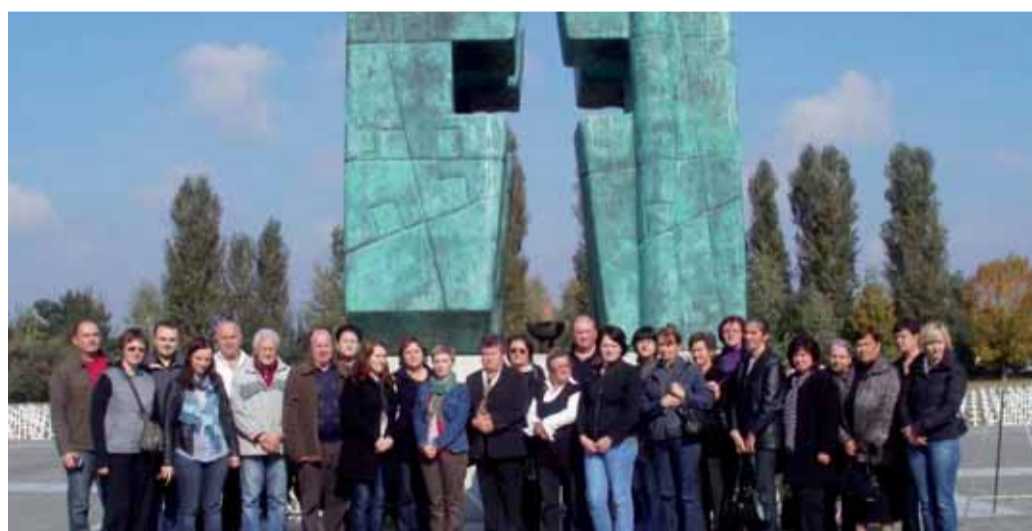
Vukovar zaslužuje svaki molitvu, suzu i cvijet

na. Sudjelovalo je osamnaest članova. Članovi 1. družine Hljavata i 2. družine Javor natjecali su se sa 46 ekipa s ukupno 550 izviđača iz cijele Hrvatske. Ekipa „Pazi, Zagorec“, s deset lepoglavskih poletaraca i izviđača, osvojila je 17. mjesto. Pet istraživača 3. družine Cumulus pomogli su izviđačima odreda Sirius iz Varaždina kao kontrolori, a u akciji je sudjelovalo i nekoliko brđana. (hk)