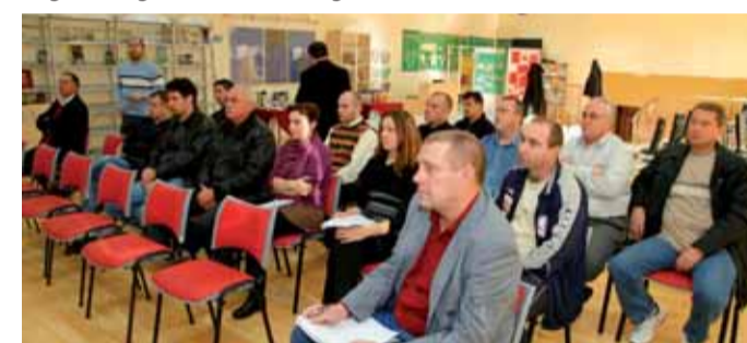
Učinen je prvi konkretan program u prerađivanju SRC-a u sportski kamp, što je ideja koju Grad već više godina razvija sa Zajednicom športskih udruga