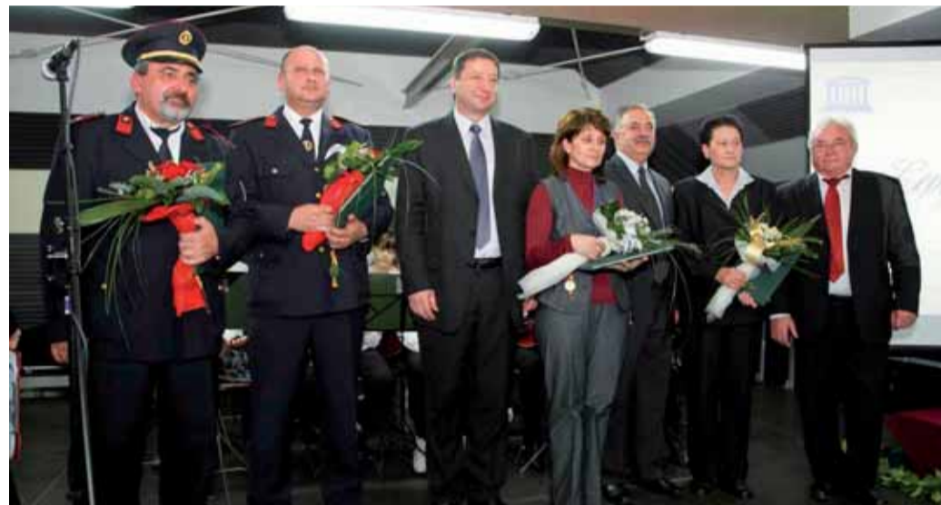
Dobitnici Nagrada Grada Lepoglave za 2010. godinu

- Ove smo godine sve naše snage „upregli“ u to da našim građanima