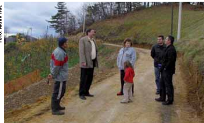
Stigla je voda u Klaidariče

Rekonstrukcijski radovi izvedeni su i na vodovodu u Crkovcu. Kako bi napokon riješili problem vodoopskrbe svih sela i zaselaka, iz lepoglavskih gradskih službi poručuju da će se iduće godine vodovodi graditi i na potezu Hadjaki-Mikulokovo-Be-