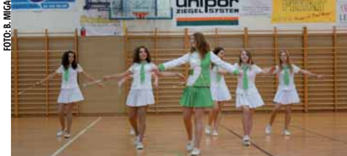
Nastup Lepoglavskih mažoretkinja