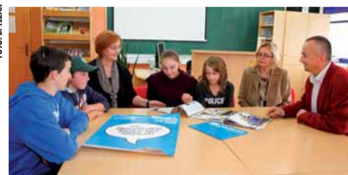
Anketu o vršnjačkom nasilju među čak 235 učenika proveli su članovi školske Novinarske grupe

IZVIDAČI Lepoglavski izviđači na natjecanjima širom Hrvatske