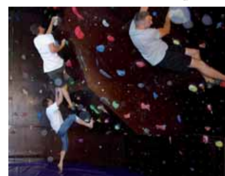
Penjanje s okusom avanturizma

U njemu svakim radnim danom, od ponedjeljka do petka, dežurni instruktori svoje znanje i dugogodišnje iskustvo u penjanju i alpinizmu prenose na mlade naraštaje i time