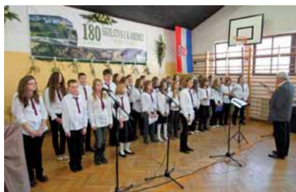
Prigodan program u povodu školskog jubileja priredili su učenici