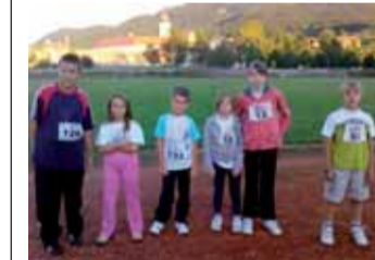
Mladi sudionici cross-tige TRČANJE

Ovom pobjedom nogometaši Lepoglave ostali su na posljednjem mjestu ljestvice, ali su se sada približili samo na bod pretposljednjoj Dravi iz Strmca, odnosno, na dva Mladosti iz Varaždina. Prvenstvo se nastavlja u proljeće, a mi se nadamo da će naši nogometaši ostvariti bolje rezultate te izbjeći ispadanje iz lige. (hk)