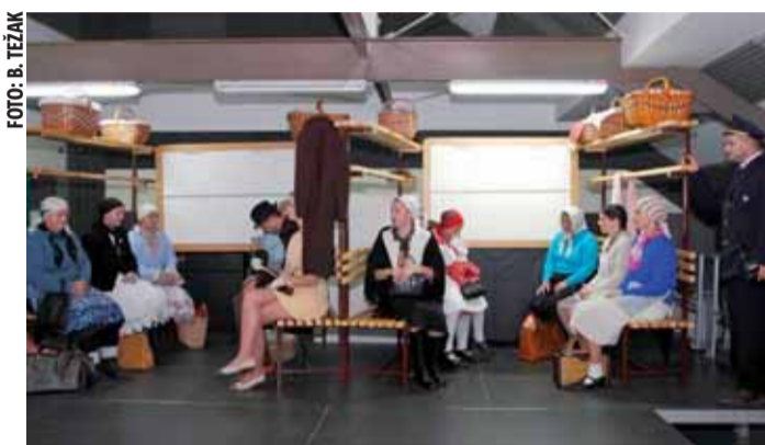
Građani našega kraja ove su godine uživali u humoru pučkog teatra iz Draganića u Karlovačkoj županiji