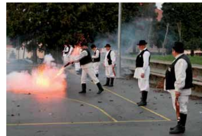
U čast Dana grad i Dana župe zapucali su kamenički i višnjčki kuburaši

Održana su i sportska natjecanja učenika lepoglavskih škola i njihovih vršnjaka iz slovenskog Leskovca i Vidma, a kazališnu predstavu Rodendan u kinodvorani izveli su glumci Lepoglavskog pušleka. Organizirana je i podjela darova na Tawanu u povodu sv. Nikole. (lir)