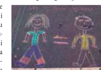
Simbolika dječjih poruka i više je nego jasna

Učenići i djelatnici Osnovne škole Izidora Poljaka u Višnjici i njene područne škole u Cvetlinu u Dječjem su tjednu prigodnim aktivnostima obilježili Međunarodni dan djece. U školskim radionicama učenići su obradili tematiku dječjih prava istaknutih u Konvenciji o pravima djeteta, što ju je Opća skupština UN-a usvojila 1989. godine. Zatim su se uz zvukove dječjih pjesama uputili na igralište te crtanjem kredom na asfaltu dočarali sva prava