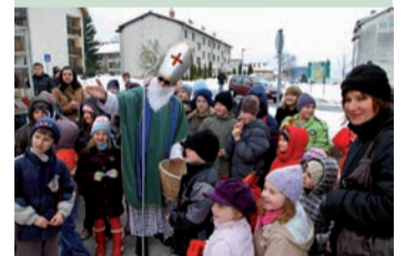
Djecu je pohodio i sv. Nikola