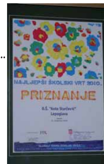
Priznanje lepoglavskoj školi za naj-vrt

učenici u njemu sade i siju izvorno bilje svoga kraja, stare sorte cvijeća, ukraških grmova, voćaka, bave se ekološkom poljoprivredom i time pridonose očuvanju prirodne i biološke raznolikosti. Njihov rad pridonosi povjerenstvu sastavljeno od agronoma, pedagoga i novinara, koji ih redovito tijekom godine obilaze, savjetuju i ocjenjuju, a njihov napredak potom i nagraduju. Čestitke školi, njenim učenicima i cijelom kolektivu! (M. Marković)