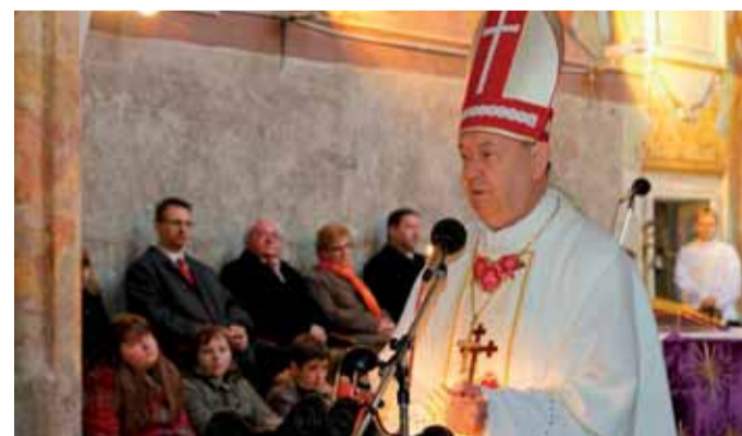
Svečanu misu u povodu Dana župe predvodio je biskup msgr. Josip Mrzljak