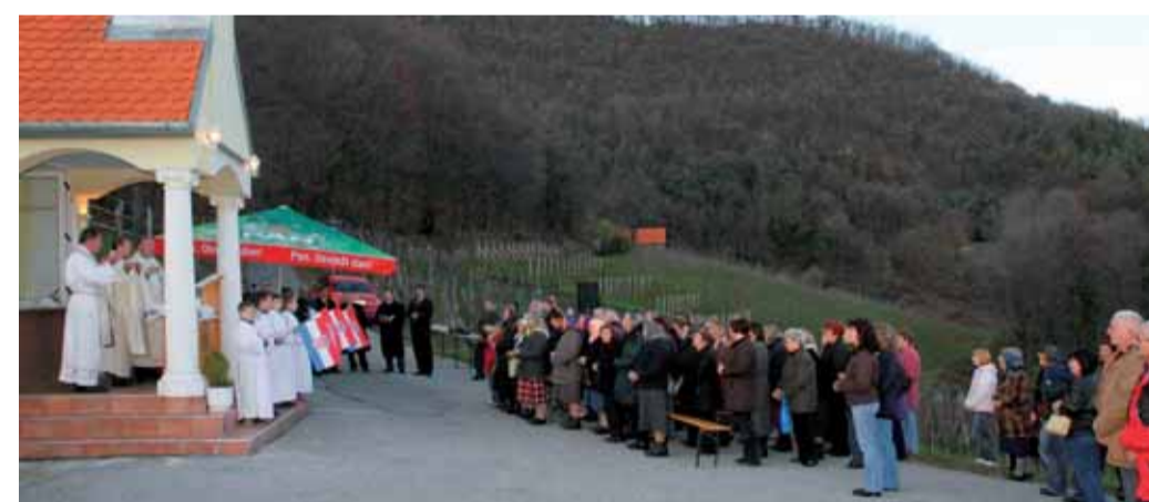
Misi se odazvao velik broj vjernika iz okolnih naselja