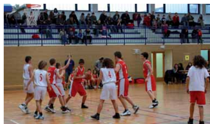
Košarkaško poslijepodne u školskoj sportskoj dvorani u Lepoglavi

košarkaški dan uključili su se i mališani Dječjeg vrtića, koji su izložili svoje radove na temu košarke.