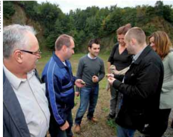
U obilazak Gaveznice ubuduće samo s plaćenom ulaznicom

Uoči potpisivanja koncesijskog ugovora, Gaveznicu su u pratnji domaćina iz Lepoglave obišli i predstavnici Muzeja krapinskih neander-