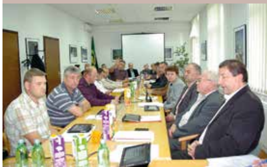
Prihvaćena darovnica Kameničke župe