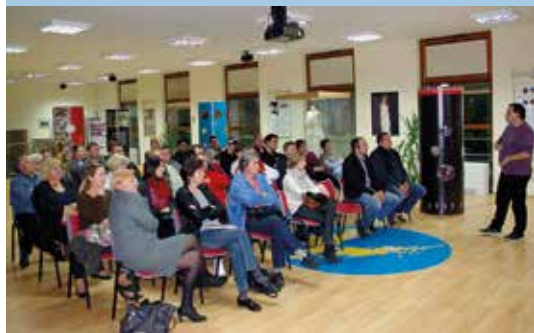
Novi način financiranja udruga