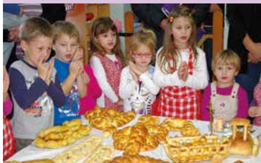
Vrtići i škole obilježili Dane kruha