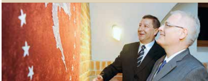
Osim posjetitelje Festival čipke oduševio i visoke uzvanike