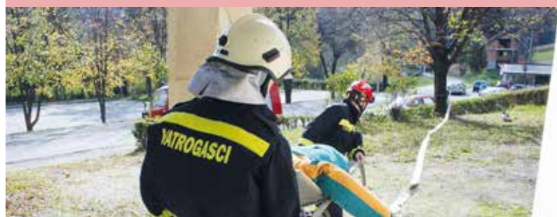
Lepoglavski vatrogasci odmjerili snage