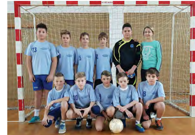
Nogometna ekipa OŠ Ivana Rangera Kamenica

Prvo mjesto osvojili su učenici OŠ Ivana Rangera u Kamenici pobijedivši u finalu ekipu OŠ Ante Starčevića iz Lepoglave te su se tako plasirali na županijsko natjecanje. Treće mjesto osvojila je ekipa OŠ Janka Draškovića iz Klenovnika. Četvrta je bila OŠ Franje Seta iz Bednje, a peta ekipa OŠ Izidora Poljaka iz Višnjice.