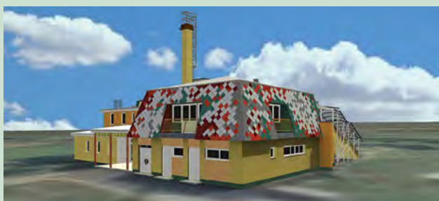
Dječji vrtić Lepoglava

Zbog smanjenja izvornih proračunskih sredstava, uslijed zakonskih promjena, potrebno je mnogo truda, znanja i iskustva da se nadoknadi gubitak