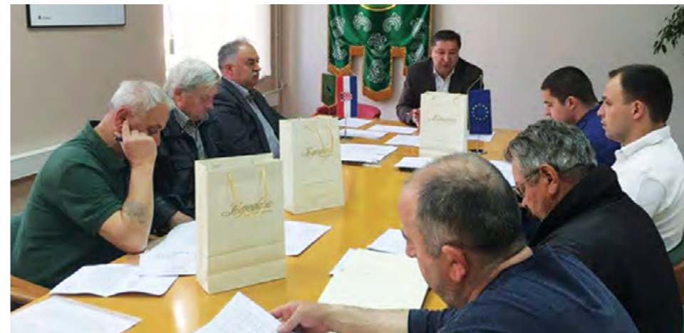
Predsjednici mjesnih odbora informirani su i o planovima tekućeg održavanja komunalne infrastrukture te uređenja nerazvrstanih cesta

Sukladno najavama o održavanju periodičnih sastanaka, u Gradskoj je vijećnici u Lepoglavi 6. travnja održan sastanak čelnih ljudi Grada Lepoglave s predsjednicima gradskih mjesnih odbora. Tom su prigodom predsjednici mjesnih odbora informirani o naplati komunalne naknade na području grada Lepoglave, točnije na područjima svih mjesnih odbora.