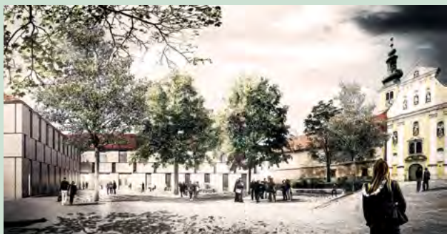
Centar za posjetitelje - Centar pavlina