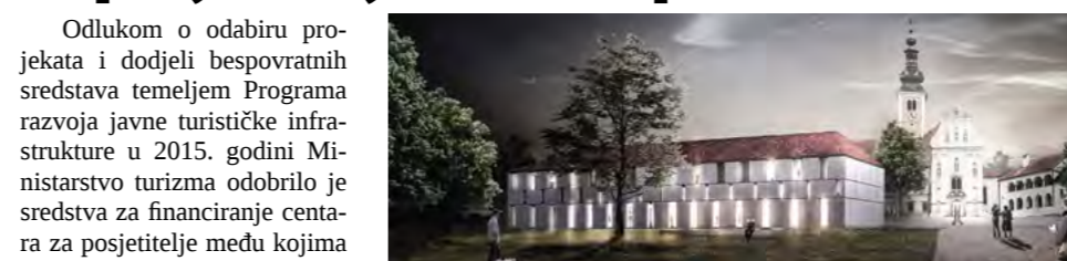
Centar za posjetitelje bit će ishodišna točka svim turistima koji posjete Lepoglavu

Odlukom o odabiru projekata i dodjeli bespovratnih sredstava temeljem Programa razvoja javne turističke infrastrukture u 2015. godini Ministarstvo turizma odobrilo je sredstva za financiranje centra za posjetitelje među kojima je i lepoglavski “Centar za posjetitelje - Centar pavlina” koji je ostvario potporu u iznosu od 430.900,00 kuna.