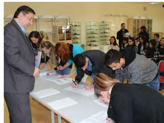
Davanjem stipendija Grad pomaže studentima i potiče obrazovanje

U skladu s razvojnom strategijom u kojoj obrazovanje zauzima značajno mjesto, Grad Lepoglava provodi aktivnosti njegova poticanja. Tako će studenti s gradskog područja, koji su se javili i zadovoljili kriterije gradskog natječaja, u ovoj akademskoj godini primiti gradske stipendije u iznosu od 500 kuna mjesečno.