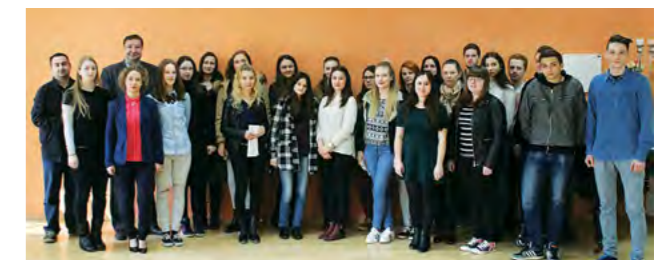
39 studenata primat će tijekom akademske godine stipendiju od 500 kuna mjesečno

Grada pozivamo da se uključite u njegovu daljnju nadogradnju, da budete aktivni sudionici u procesu donošenja odluka što je