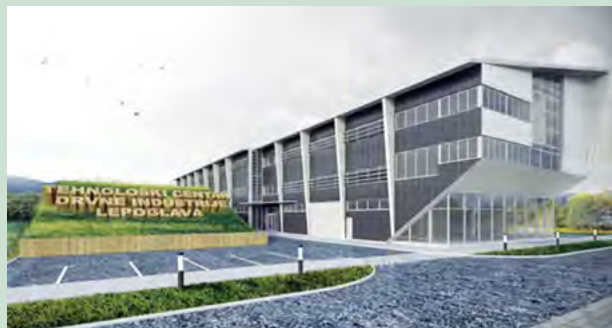
Tehnološki centar drvne industrije