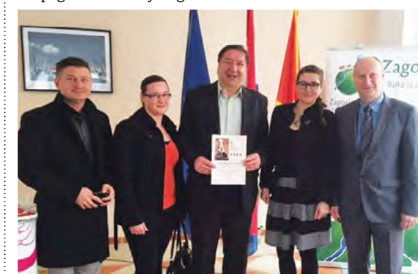
Bučina ulje ATK "Lepoglava" osvojila je srebrnu medalju na 6. izložbi ulja Sjeverozapadne Hrvatske

Agro - turistički klaster "Lepoglava" i u ovoj će godine