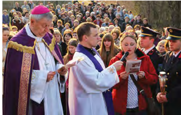
Na križnom je putu sudjelovalo 300-njak vjernika

Vjernici su na križnom putu molili za proglašenje blaženog Alojzija Stepinca svetim