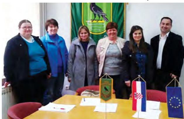
Zaposlena je pet dugotrajno nezaposlenih žena

Mjere aktivne socijalne politike u Gradu Lepoglavi između ostaloga vidljive su i po brizi za svoje starije, nemoćne i potrebite građane. Naime, proširenjem gradske gerontoslužbe, odnosno zapošljavanjem dodatnih pet gerontodomaćica kroz program javnih radova, a koje su 1. travnja potpisale svoje ugovore o radu, Grad Lepoglava je svojim starijim, nemoćnim i potrebitim građanima osigurao svakodnevnu skrb.