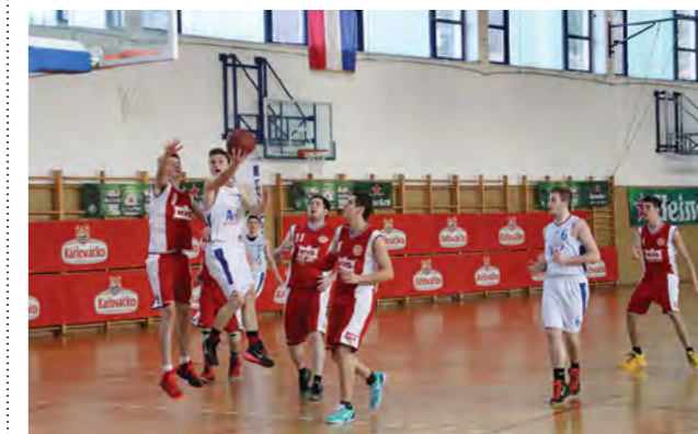
Seniorska momčad Lepoglave bila je najmlađa momčad lige

Košarkaški klub Lepoglava natjecateljsku sezonu 2015/2016 u C- košarkaškoj ligi završio je na posljednjem mjestu prvenstvene tablice. Lepoglavski košarkaši u 18 su prvenstvenih utakmica ostvarili tri pobjede dok su poraženi u 15 utakmica.