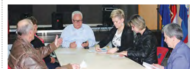
Zaposleni na javnim radovima obavljat će tehničke poslove

Navedeni projekt trajat će do 15. listopada.