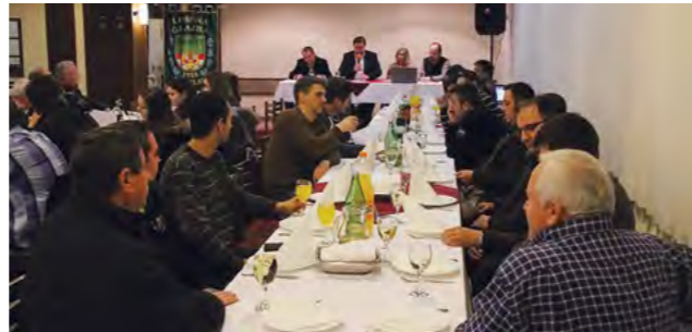
60 godina postojanja Limena glazba će proslaviti velikim koncertom

stuje. Više od ostalih, posebno u ovoj će godini Limena glazba Lepoglava proslaviti 60. obljetnicu postojanja i njena će proslava, uz nastup na županijskoj smotri, biti jedna od značajnijih ovogodišnjih aktivnosti.