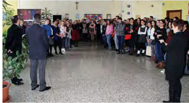
Na natjecanju je sudjelovalo 70 učenika

Hrvoje Kovač uputivši im ujedno riječi dobrodošlice u grad u kojem je osnovana prva svjetovna gimnazija i sveučilište u Hrvata.