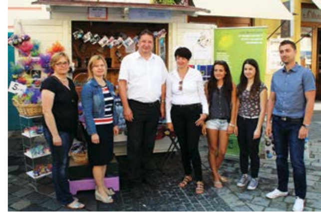
Izložbeni prostor LAG-a bio je smješten na Franjevačkom trgu

Mi u LAG-u izuzetno cijenimo njihov trud naših članova. Posebno želim istaknuti i njihov doprinos u izradi Strategije LAG-a Sjeverozapad temeljem koje smo prijavili naš LAG na natječaj Agencije za plaćanja u poljoprivredi, na Mjeru 19.2 iz Programa za ruralni razvoj Republike Hrvatske, iz koje očekujemo sredstva u iznosu od gotovo 10 milijuna kuna. Ta će sredstva biti