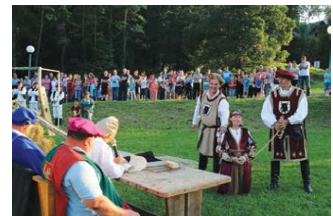
Gosti iz Slovenije uprizarili su legendu o Veroniki Desiničkoj

Manifestaciju Dani sporta, zabave i kulture organizirala je Udruga za sport i rekreaciju "Sport za sve" Višnjica, a uz pokroviteljstvo Grada Lepoglave potporu i pomoć u organizaciji pružili su višnjičke udruge -DVD Višnjica, Kuburaška udruga Prva kubura Višnjica, Lovačka udruga Graničar, OŠ Izidora Poljaka Višnjica i većinom domaći sponzori.