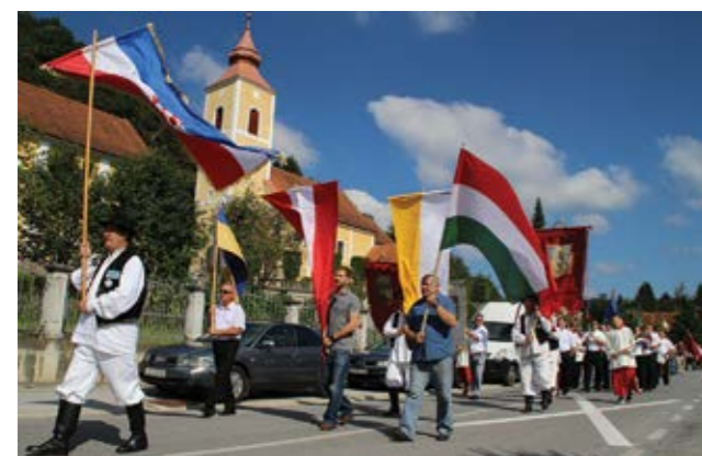
Proslava Bartolova započela je tradicionalnim mimohodom

Na blagdan svetog Bartola, u Kamenici su se okupili brojni vjernici iz kameničke i okolnih župa te inozemstva slaveći blagdan nebeskog zaštitnika Župe Kamenica.