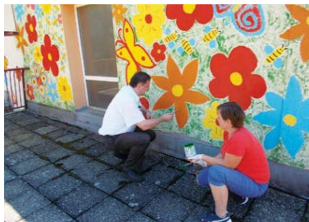
U oslikavanju fasade vrtićkim se tetama pridružio i gradonačelnik

U oslikavanju fasade pridružio im se i gradonačelnik Marijan Škvarić te su zajed-