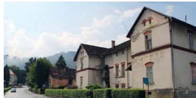
Derutne zgrade u vlasništvu države predstavljaju opasnost za građane

Brigu o održavanju navedenih zelenih površina već dugi niz godina vodi upravo Grad Lepoglava koji s građanima dijeli zabrinutost po pitanju održavanja derutnih objekata u državnom vlasništvu u centru Lepoglave. Takvi objekti predstavljaju opasnost i narušavaju vizualni identitet grada. Dio njih u dobrom su stanju i mogli bi biti stavljeni u funkciju poput vile za koju je Grad Lepoglava već ranije tražio da se ustupi na korištenje bratiteljima.