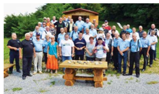
Sudionici Memorijala aduševljeni su baravkom u lepoglavskom kraju