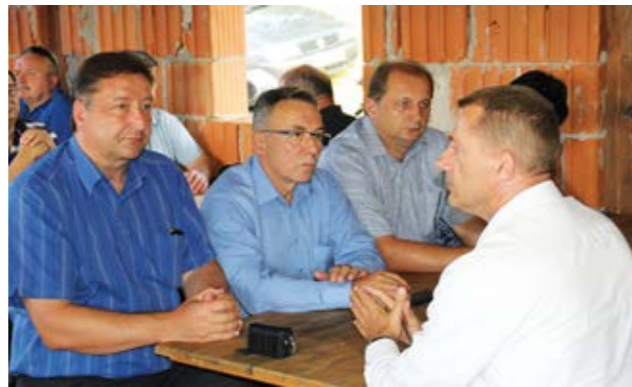
Turnir podupire Grad Lepoglava

Ove godine turnir je otvoren u Jerovcu. Prije otvorenja