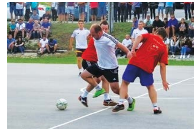
Nogometne utakmice ponudile su puno uzbuđenja

Nakon pozdravnih govora, kolona koju su činili članovi braniteljskih i višnjičkih udruga te svi gosti, uputila se do mjesnog groblja gdje je na grobu i kod spomen obilježja, polaganjem vijenaca, paljenjem svijeća, mo-