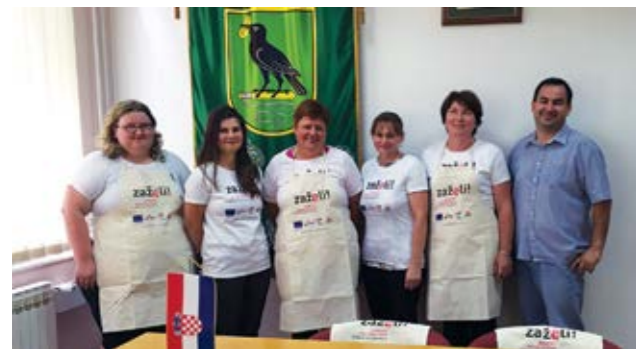
Zaposlene žene rade na poslovima pomoći starijim i nemoćnim osobama

Radi se o programu zapošljavanja nezaposlenih žena iz evidencije zavoda, koje rade na poslovima pomoći starijim i nemoćnim osobama u njihovim domaćinstvima. Ovim je programom na razini Hrvatske zaposleno više od 2.500 osoba, od kojih pet na području grada Lepoglave.