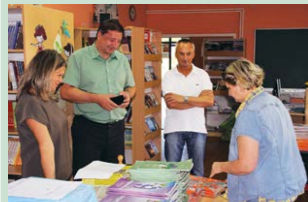
Ovo je jedan hvalevrijedan projekt, ističe gradonačelnik Škvarić

Prvog dana školske godine u svim su školama na području grada Lepoglave osnovnoškolce uključene u projekt razmjene udžbenika na klupama su dočekali školski udžbenici. Riječ je o projektu koji je prije nekoliko godina pokrenula Varaždinska županija, a podržao i Grad Lepoglava. U OŠ Ante Starčevića u Lepoglavi besplatne je udžbenike dobilo 75 posto učenika uključenih u projekt. U OŠ Ivana Rangera u Kamenici u projekt se uključilo 95 posto učenika, dok su se u OŠ Izidora Poljaka u Višnjici u projekt uključili gotovo svi učenici. Svi oni udžbenike su dobili besplatno.