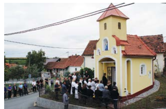
Misa zadušnica u kapelici u Lepoglavskoj Vesi