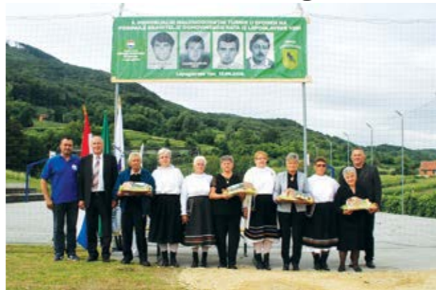
Članovima obitelji četvorice poginulih branitelja, u znak pažnje, uručeni su pokloni