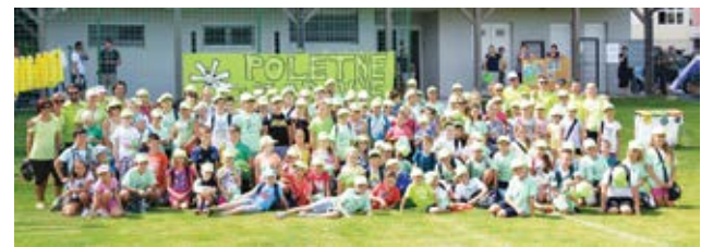
Sudionici igara družili su se i dobro zabavili

Poletne zabavne igre svojevrsni su nastavak dugogodišnjeg projekta Otvorene zabavne škole nogometa, a podupiru ih i financijski pomažu Grad Lepoglava, Općina Bednja i slovenska Općina Videm, jedinice lokalne samouprave koje su se zahvaljujući ovom projektu zbližile i ostvarile suradnju i na drugim