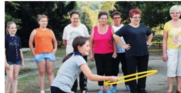
Razlike u godinama nisu prepreka za druženje

U okviru prvog projekta mladi su izviđači obilazili domove umirovljenika družeći se s njima te im pomagali u obavljanju kućanskih poslova. Drugi projekt obuhvatio je druženje kroz razmjenu iskustva, a realiziran je na Sportsko - rekreacijskom centru u Lepoglavi gdje su se okupili umirovljenici i izviđači družeći se kroz zabavne igre te kroz pričaoice u kojima su umi-