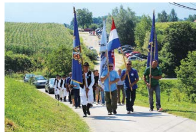
Branitelji su na misu stigli u mimohodu

Na Dan pobjede i domovinske zahvalnosti i Dan hrvatskih branitelja, ujedno i blagdan Majke Božje Snježne, u istoimenoj je kapeli u Žarovnici, u nazočnosti brojnih vjernika, služeno misno slavlje te