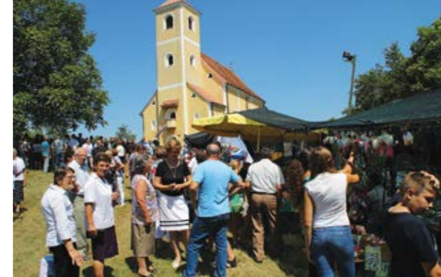
Održano je tradicionalno prošćenje

šom čovjeku i od toa druoa procesijom oko kapele Majke