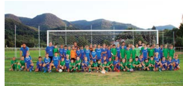
Mladi igrači NK Lepoglave i GNK Dinamo

Godina je u kojoj Nogometni klub Lepoglava slavi 70 godina postojanja. Vrijedan jubilej Klub obilježava nizom aktivnosti i događanja. Jedna od njih bilo je gostovanje dvije mlade selekcije GNK Dinamo koje su u Lepoglavi odigrale utakmice s vršnjacima iz NK Lepoglave.