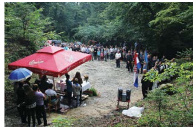
Obilježavanje stradanja u šumi Belaš počelo je s demokratskim promjenama

U šumi Belaš u Višnjici, na mjestu gdje su po završetku 2. svjetskog rata, prema riječima svjedoka, partizanske jedinice smaknule stotinu zarobljenika, uglavnom pripadnika poraženih vojnih formacija iz okoline Varaždina, služena je misa povodom Europskog dana sjećanja na žrtve totalitarnih i autoritarnih režima.