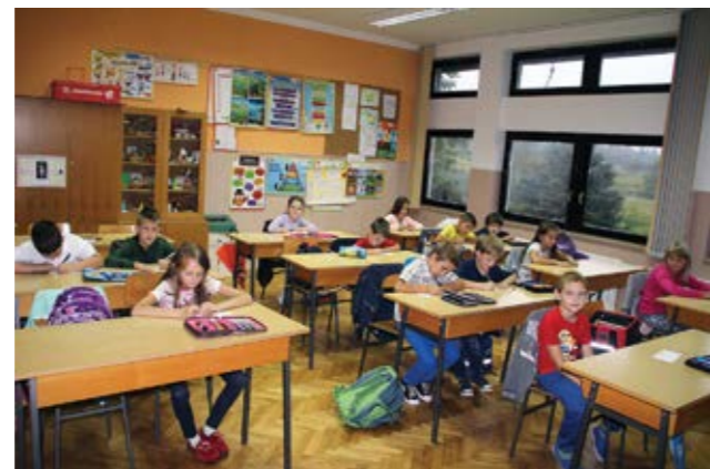
Nova školska godina počela je 5. rujna 2016., a traje do 14. lipnja 2017.

U OŠ Ivana Rangera u Kamenici i njenom područnom odjelu u Žarovnici u novu je