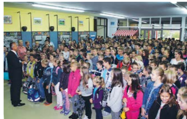
Učenici su prvog dana nastave dobili raspored sati i potrebne informacije

školsku godinu krenulo 168 učenika od kojih 27 u prvi razred. U školu u Kamenici u prvi je razred krenulo 12, a u područnoj školi u Žarovnici 15 učenika.