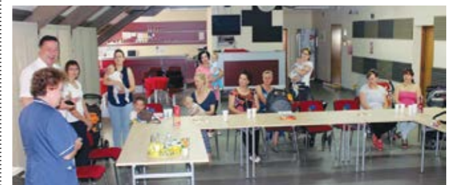
Potporu radu grupe za dojenje dao je i gradonačelnik Marijan Škvarić

Potporu radu grupe za dojenje dao je i lepoglavski gradonačelnik Marijan Škvarić koji je prigodom obilježavanja Svjetskog tjedna dojenja posjetio članice grupe. Gradonačelnik Škvarić naglasio je da će Grad Lepoglava, kao i u ovoj prigodi, pružiti potporu programima i projektima koji se tiču najmlađih građana grada Lepoglave budući da je riječ o ulaganju u budućnost samog grada.