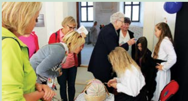
Devet europskih zemalja predstavilo svoju čipkarsku tradiciju