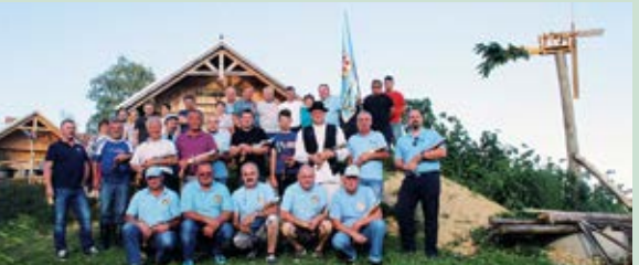
Višnjički kuburaši i njihovi gosti

Postavljanje klopoteca nije moglo proći bez počasnog pucanja. Višnjički su kuburaši zapucali sa svojim gostima i gromoglasno najavili približavanje vremena berbi.