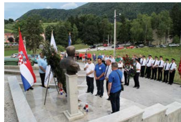
Ođavanje počasti Stjepanu Križancu

Odigraivanjem završnice 21. memorijalnog malonogometnog turnira Stjepan Križanec u Višnjici je završena trodnevna manifestacija Dani sporta, zabave i kulture, održana pod pokroviteljstvom Grada Lepoglave.