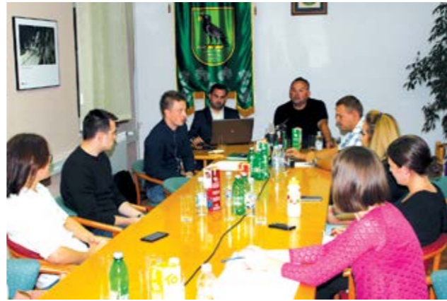
Savjet mladih Grada Lepoglave