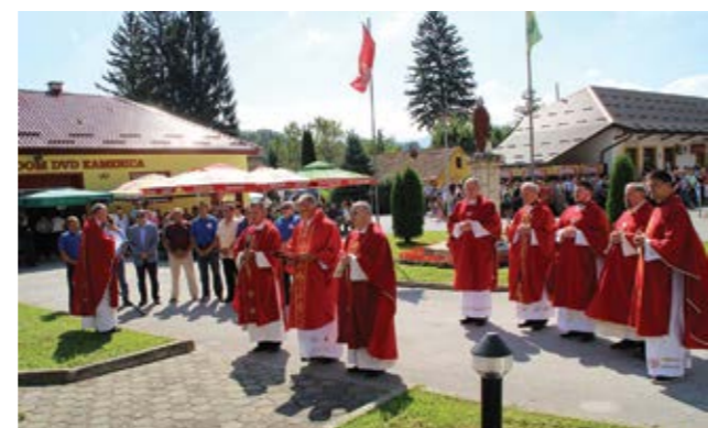
Kod spomen obilježja odana je počast trojici vukovarskih heroja

završetku misnog slavlja, zapucali su kuburaši iz udruge Glasna kubura iz Kamenice.