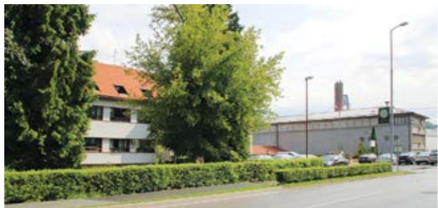
Obnova će trajati 12 mjeseci

Radovi moraju biti završeni u roku od 12 mjeseci od uvođenja u posao.