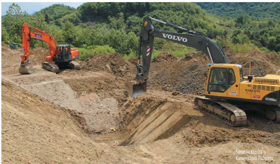
Sanacija klizišta u Kameničkom Podgorju

- Na žalost, posljednjih je godina uslijed nepovoljnih vremenskih prilika došlo do pojave brojnih klizišta. Posebice je pogođeno područje Kameničkog Podgorja. Sanacije klizišta zahtijevaju velika financijska sredstva tako da Grad, lišen značajne potpore s državne razine, ne može odjed-