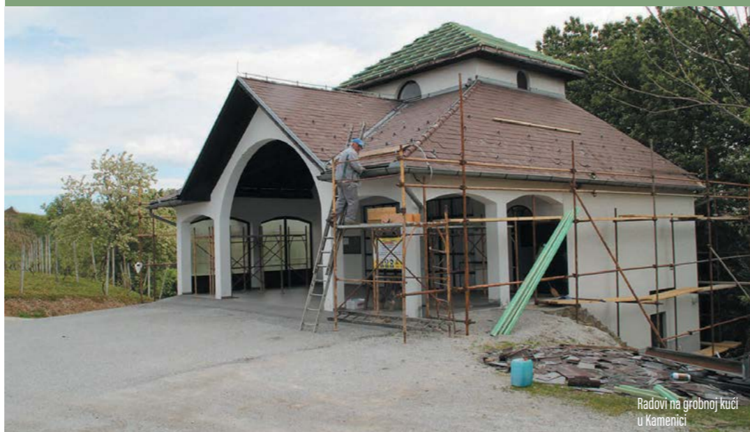
Radovi na grobnoj kući u Kamenici

Grobna kuća na groblju u Kamenici dobit će, zahvaljujući investiciji gradova Lepoglave i Ivanca novi krov, a obnovljena će biti i fasada