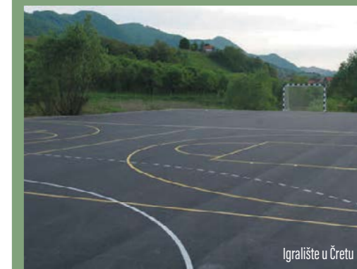
Igralište u Čretu

Uz navedena sportska igrališta postaviti će se i rasvjeta na dječje igralište u Zlogonju.