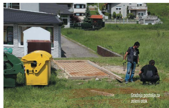
Gradnja postolja za zeleni otok

ma Fonda za zaštitu okoliša i energetske učinkovitosti, a na kojima građani mogu besplatno odlagati selektirani otpad.