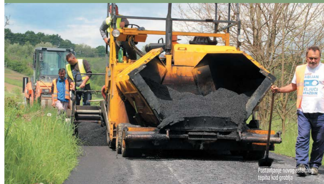
Postavljanje novog asfaltnog tepiha kod groblja

Zahvaljujući suradnji Grada i ŽUC-a postavljeni novi metri asfaltnog tepiha na cesti kod gradskog groblja i u Budimu