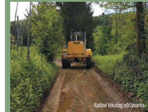
Radovi tekućeg održavanja

Radovi tekućeg održavanja komunalne infrastrukture odlukom su Gradskog vijeća na naredne četiri godine dodijeljeni tvrtki TTG iz Višnjice.