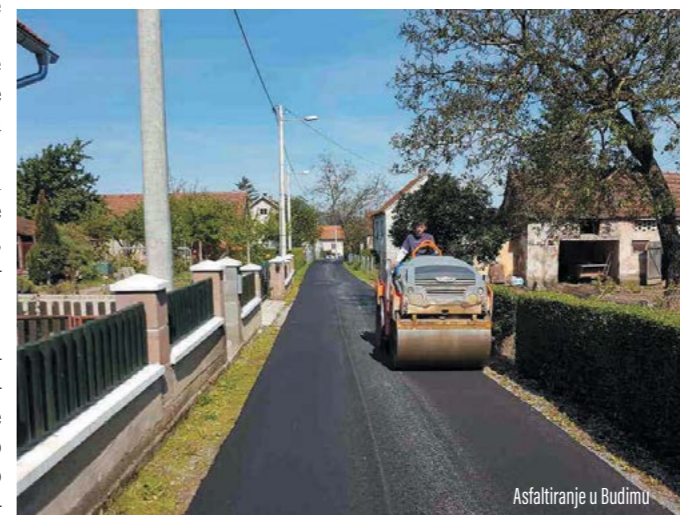
Asfaltiranje u Budimu

Uz navedenu cestu na isti je način sanirana i cesta u naselju Budim. Na tom je dijelu postavljen novi asfaltni tepih u duljini od 625 metara.