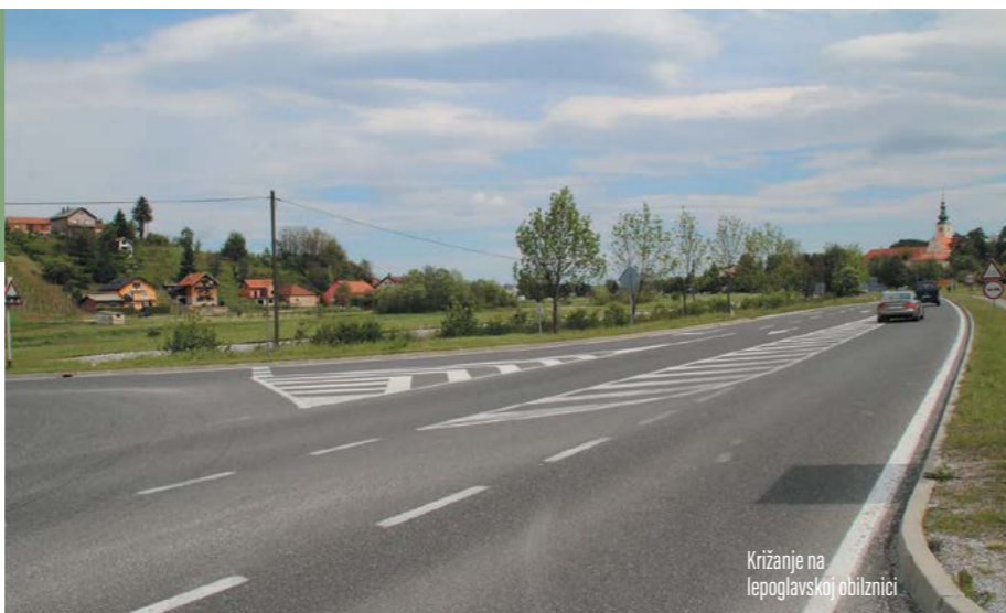
Križanje na lepoglavskoj obilaznici

Ne samo gradnjom nogostupa već i drugim aktivnostima nastojimo povećati sigurnost u prometu na području grada Lepoglave. Utvrdili smo potrebu za određenim zahvatima vezanima za prometnu infrastrukturu među kojima je potreba osvijetljavanja križanja na državnoj cesti D35 odnosno obilaznici. Zahvaljujući dogovoru s Hrvatskim cestama koje su također uvidjele