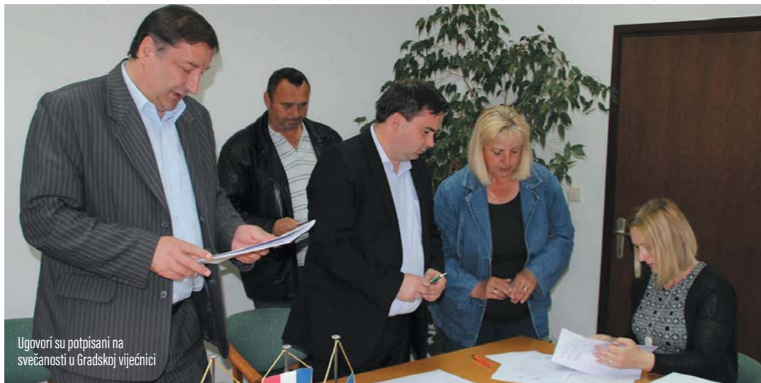
Ugovori su potpisani na svečanosti u Gradskoj vijećnici

Potpisani ugovori o financiranju programa i projekta organizacija civilnog društva