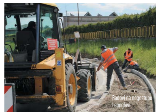
Radovi na nogostupu Lepoglavi

Ostvarenju tog cilja pridonio je i završetak 1. faze izgradnje nogostupa u Žarovnici u duljini od 350 metara. Vrijednost radova iznosila je gotovo 870.000 kuna, od kojih je Županijska uprava za ceste osigurala 75 posto, dok je preostalih 25 posto osigurao Grad.