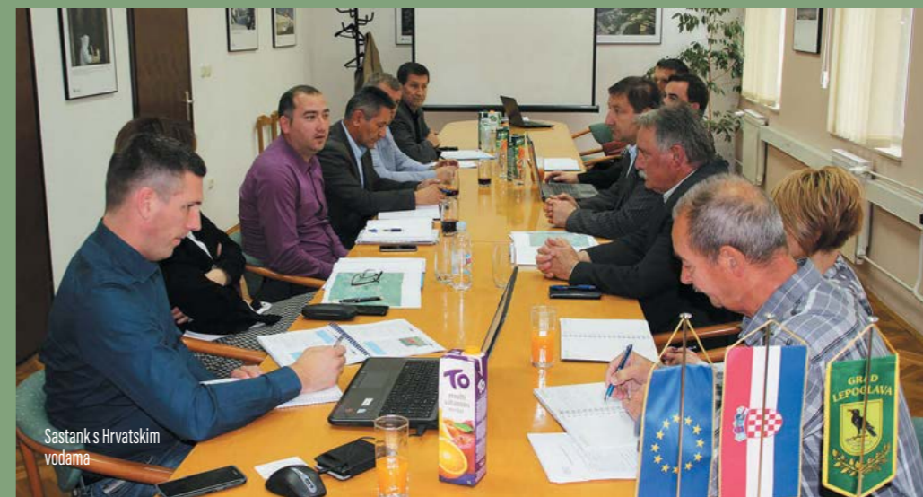
Sastanak s Hrvatskim vodama

- Nepostojanje sustava odvodnje u Lepoglavi jedan je od najvećih problema tako da je njegova izgradnja jedan od gradskih komunalnih prioriteta. Riješene problema nudi se kroz projekt Aglomeracije kojim bismo željeli do 2023. izgraditi sustav odvodnje i ponuditi građanima još viši životni standard, ali i izbjeći plaćanje kazni Europskoj uniji koja je odredila rokove do kada sustavi odvodnje moraju biti izgrađeni i stavljeni u funkciju. Mi smo već odradili jednu fazu tog projekta izgradnjom djela sustava odvodnje vrijednosti 8.5 milijuna kuna, financiranu od strane Hrvatskih voda i manjim dijelom sredstvima Grada