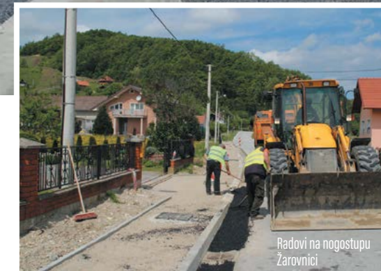
Radovi na nogostupu Žarovnici

Od prijašnja tri kilometara postojećih nogostupa u desetak se godina došlo na 17 kilometara uređenih nogostupa