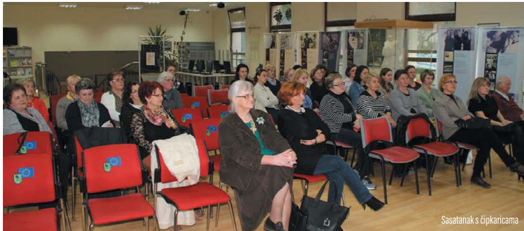
Sastanak s čipkaricama