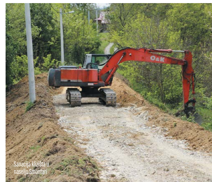
Sanacija klizišta u naselju Smontari

Inače, Programom gradnje objekata i uređaja komunalne infrastrukture za 2017. godinu predviđena je izrada projektne dokumentacije i stvaranje uvjeta za sanaciju klizišta na nerazvrstanim cestama u naselju Galovići u Žarovnici i naselju Ves u Gornjoj Višnjici.