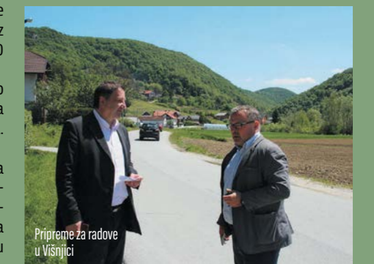
Pripreme za radove u Višnjici

U drugoj se fazi planira izgradnja 1099 metara dugog nogostupa od raskrižja prema Zlogonju pa prema samom Zlogonju. Cijena izgradnje navedenog nogostupa je 1.965.000 kuna dok se u trećoj fazi planira izgradnja nogostupa od centra Višnjice prema Zalužju u duljini od 390 metara i vrijednosti 830.000 kuna.