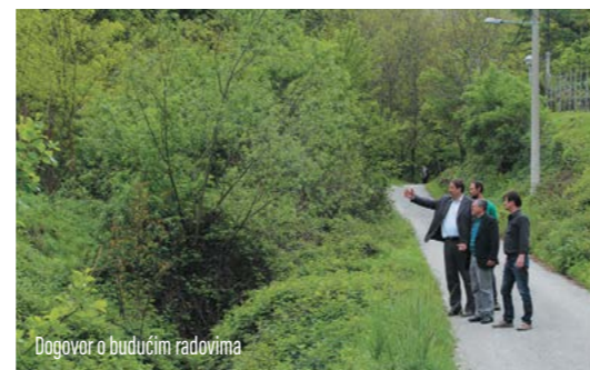
Dogovor o budućim radovima

U dogovoru s Hrvatskim vodama na gradskom se području intenzivno uređuju vodotoci potoka