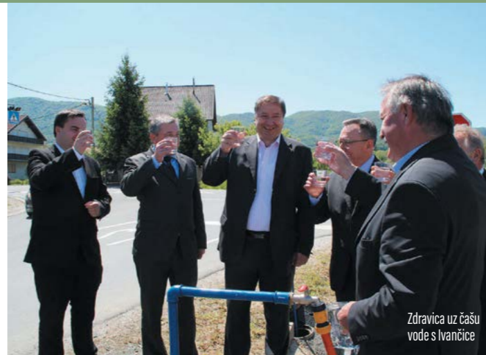
Zdravica uz čašu vode s Ivančice

- Puštanjem vode s Ivančice u Varkomov sustav postigli smo cilj koji smo si postavili u Gradu Lepoglavi, a to je da na cijelom gradskom području imamo dobru i kvalitetnu vodu – istaknuo je gra-