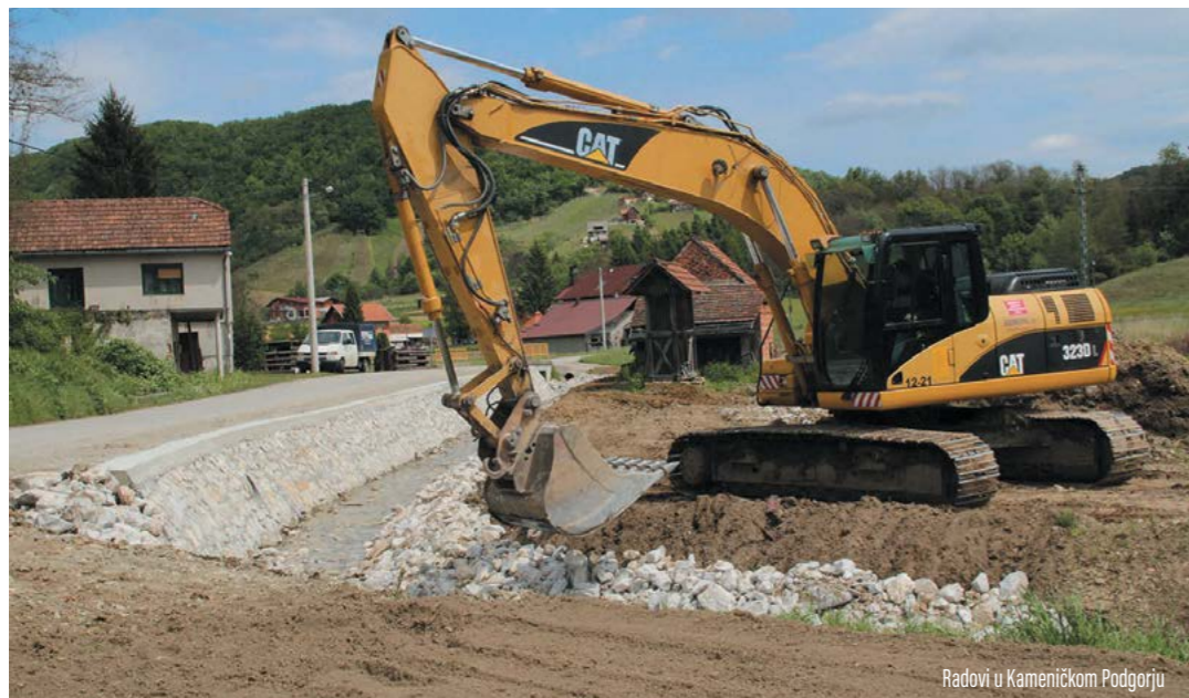
Radovi u Kameničkom Podgorju