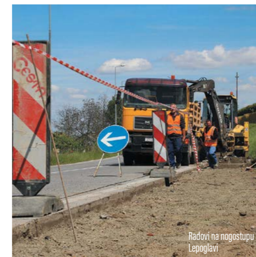
Radovi na nogostupu Lepoglavi

Rekonstrukcija se provodi u suradnji sa Županijskom upravom za ceste, a u skladu s gradskim Programom gradnje objekata i uređaja