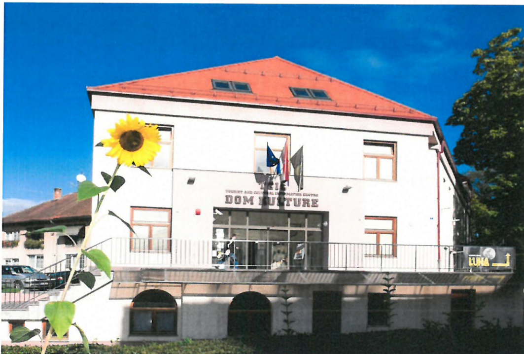
Slika 2. Zgrada „Dom kulture“ - TKIC d.o.o.“

Zadaća TKIC-a d.o.o. je osigurati funkcioniranje javnog objekta „Doma kulture“ što podrazumijeva održavanje objekta i opreme. U tu svrhu osigurali smo sve preduvjete za stručno održavanje svih uređaja u sklopu Centra. Potpisani su ugovori o stručnom nadzoru i održavanju svih važnijih segmenata održavanja (kotlovnica, uređaj za hlađenje, vatrodajava, video nadzor, vatrogasni aparati, dizalo, računalna oprema, dimnjačarske usluge i sl.). Uz sve navedeno, Centar je sa svojom opremom osiguran kod osiguravajućeg društva čime su osigurani svi preduvjeti za normalno funkcioniranje bez bojazni za potencijalno većim kvarovima, oštećenjima ili svojevrsnim havarijama.