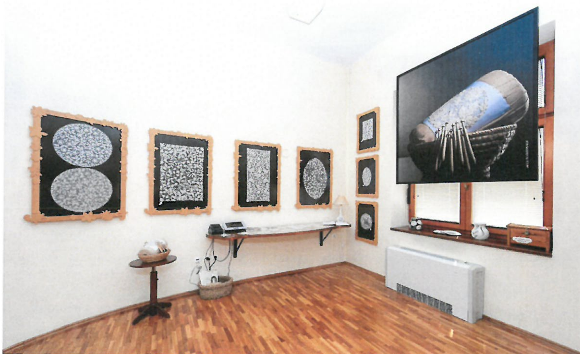
Slika 7. Galerija Lepoglavske čipke

Prijavljena su dva projekta na program Očuvanja nematerijalne kulturne baštine Ministarstva kulture za Ekomuzej Lepoglava i Čipkarsko društvo Danica Bresler.