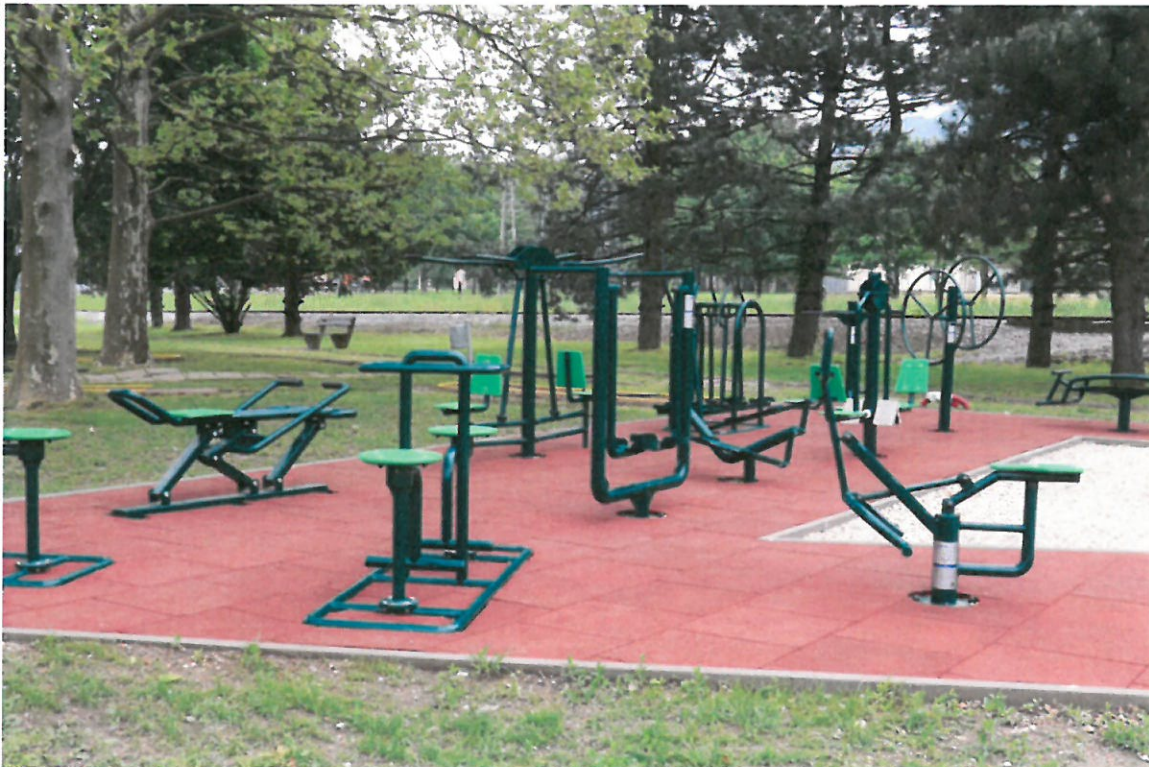
Slika 8. Fitness na otvorenom

čipke 2022, županijska smotra limenih glazbi, Valentinovo, Potraga za Uskršnjim jajima, proslava Dana grada i svečana sjednica Vijeća, Kazališne noći, Otvaranje Outdoor fitnessa, Božićni koncert, Advent u Lepoglavi, školske priredbe, mnogobrojne skupštine udruga u Domu kulture ili na drugim lokacijama, te ostali događaji prema potrebi, a koji su od bitnog značaja za sugrađane i Grad Lepoglavu.