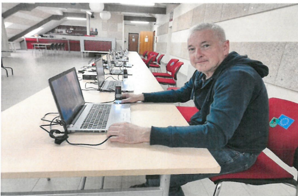
Slika 3. Radionica mikroskopi

Tijekom 2022. godine pored redovnih djelatnosti nabavljena je i nova tehnička (glazbena i multimedijalna) oprema za kvalitetnije usluge korisnicima dok je ostala tehnička oprema servisirana po potrebi. Informatička infrastruktura je nužna za djelovanje cijelog Centra i kao takva podložna je kvarovima. Nakon određenog perioda potrebno je modernizirati/zamijeniti/servisirati dotrajale komponente IT sustava što je i u konačnici ostvareno (produljenje licenci, domena, hostinga, programa).