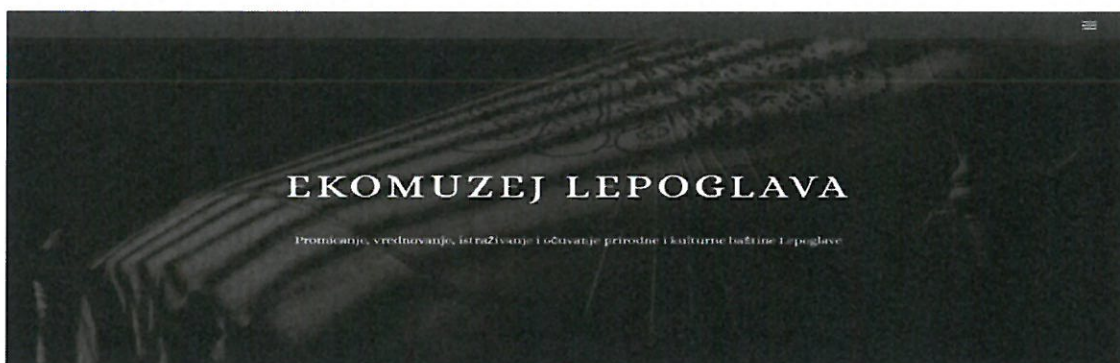
Slika 6. Web stranica „Ekomuzej Lepoglava“

Isto tako, Tvrtka uređuje i Facebook stranicu udruge „Ekomuzej Lepoglava“, stranicu „Grad Lepoglava“, stranicu „Lepoglavski dani“ i stranicu „Čipkarski festival“ gdje se pružaju točne informacije o događanjima, vijestima i obavijestima iz područja kulture i turizma.