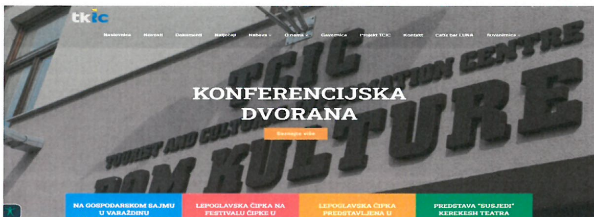
Slika 5. Web stranica „TKIC d.o.o.“

TKIC d.o.o. u 2022. godini održavao je web stranicu www.tkic.hr te Facebook stranicu „Dom kulture-TKIC“ kao news portal putem kojeg informira građanstvo o aktivnostima koje se provode u prostorijama TKIC-a d.o.o., a čije je održavanje vezano za zakup domene i smještaj na Internetu (hosting). Istovremeno TKIC d.o.o. objavljuje i sve materijale i odluke vezane uz web stranicu www.lepoglava.hr . Informiranje se vrši također preko stranica www.lepoglavski-dani.com , ekomuzej-lepoglava.hr .