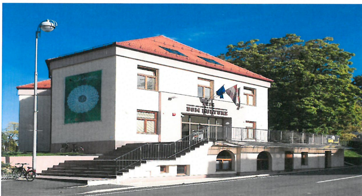
Slika 1. Zgrada „Dom kulture“ - TKIC d.o.o.“

Turističko kulturno-informativni centar d.o.o. (skraćeno TKIC d.o.o.) osnovan je 22. prosinca 2008. godine od strane Grada Lepoglave, koji je i 100% vlasnik TKIC-a d.o.o. Osnivanjem TKIC-a d.o.o., grad Lepoglava je oformio neovisno tijelo koje će upravljati objektom „Dom kulture“ i tako ispunio jedan od uvjeta održivosti projekta „Tourist and Cultural Information Centre- TCIC“ (skraćeno TCIC) financiranim od EU iz fonda PHARE 2005.